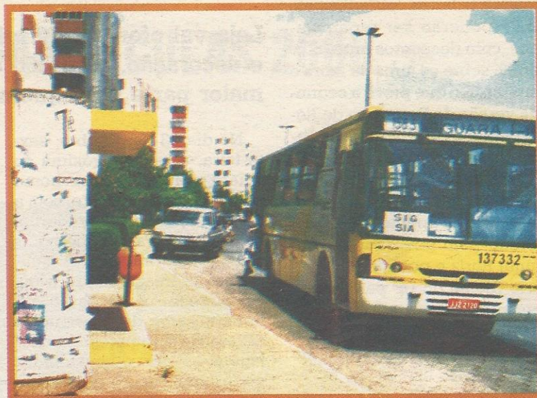
Projetos não especificam como será o controle do passe livre