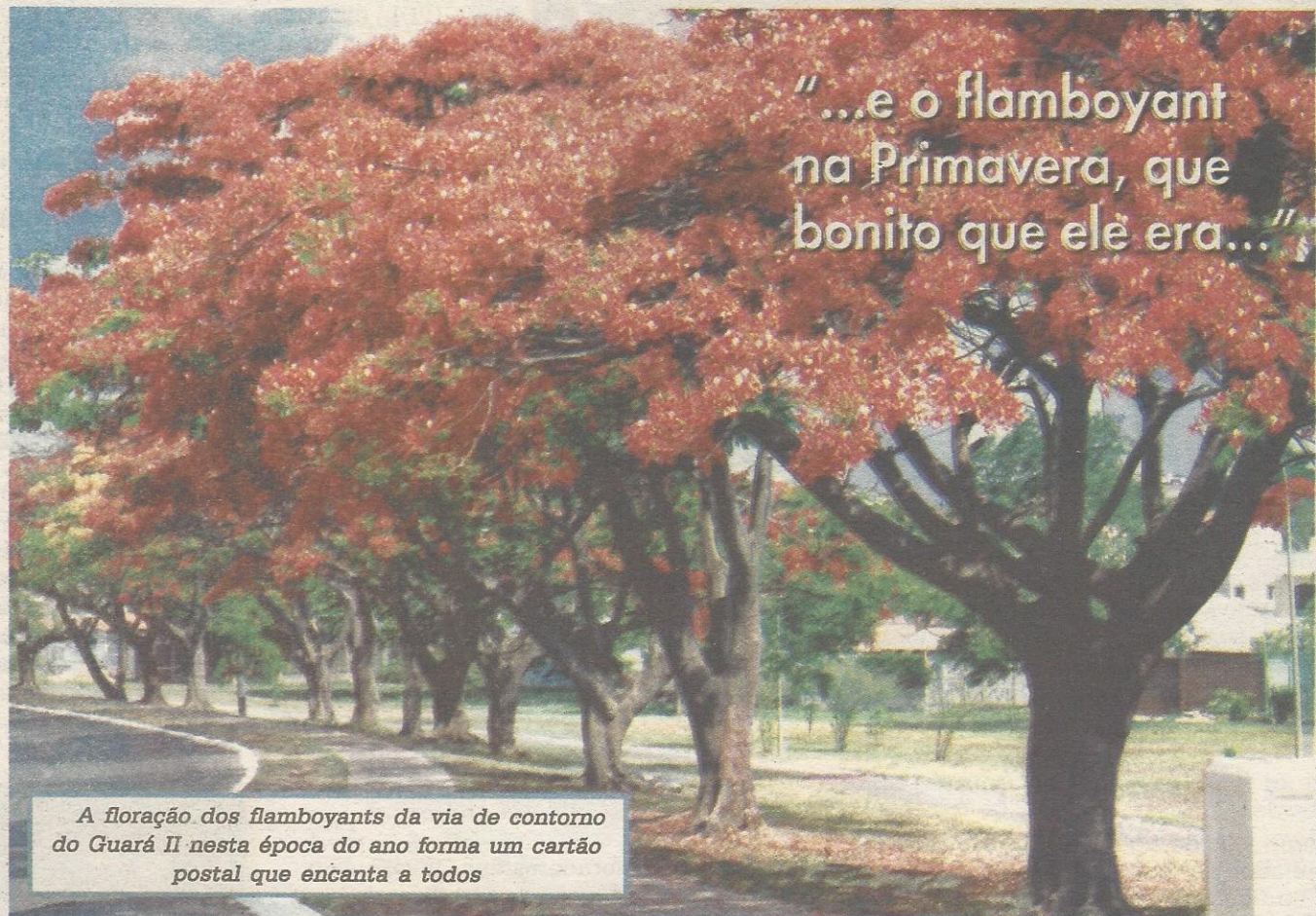
A floração dos flamboyants da via de contorno do Guará II nesta época do ano forma um cartão postal que encanta a todos

"...e o flamboyant na Primavera, que bonito que ele era..."