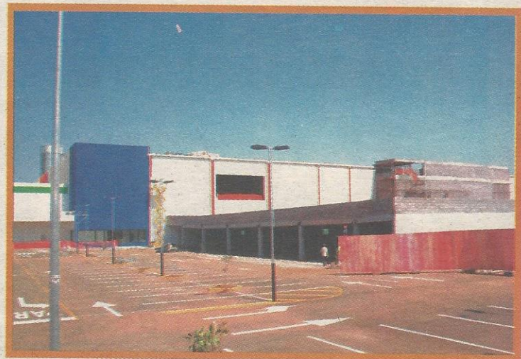
Nova loja será anexa à Merlin Leroy e fica pronta em novembro

Para o guaranaense, é mais uma oportunidade de emprego. A previsão do grupo é oferecer entre 800 a 1 mil empregos diretos, com preferência para quem morar perto da loja, caso de Guará, Candagolândia, Núcleo Bandeirante e Riacho Fundo.