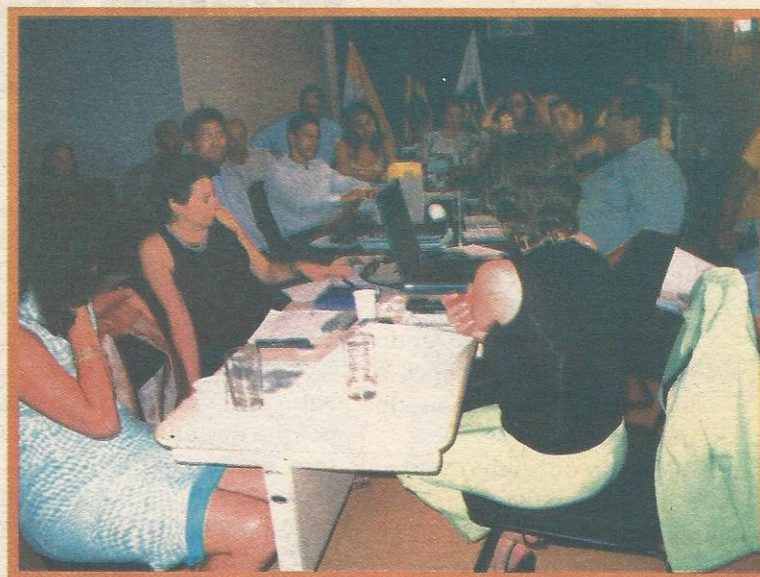
Os conselheiros do Guará tiraram todas as dúvidas sobre o PDL

Já para 2006, o PDL prevê: ampliação da Reserva Ecológica do Guará, com a revisão das