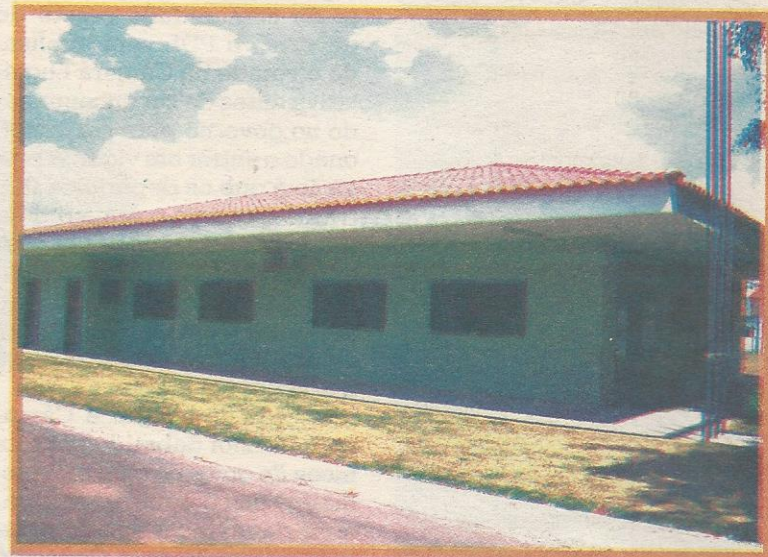
Nova sede do Cartório Eleitoral do Guará, na QI 7 do Guará I

Outras informações: Cartório Eleitoral do Guará - fone: 3382.7741