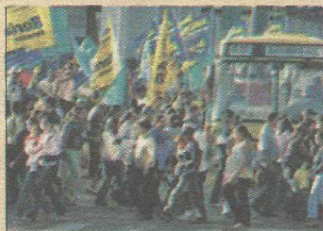
TRE está preocupado com o risco de guerra de bandeiras

Para preservar a segurança no trânsito em locais de maior movimento, o TRE/DF definiu onde pode e não pode ser realizado o bandeiraço. No Guará, está proibido a movimentação com bandeiras nas proximidades da Feira, no balão central do Guará I e no cruzamento entre o Guará I e II, em frente ao Supermaia.