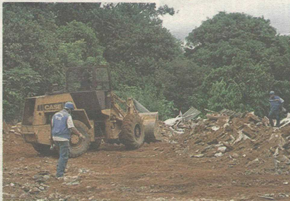
Siv-Água já removeu 18 construções em área de proteção ambiental