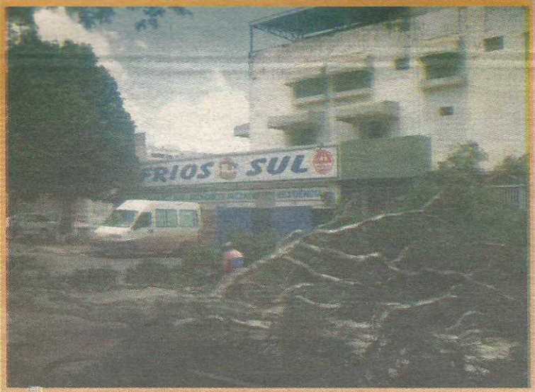
A poda será feita em toda a cidade

4º BPM ganha policiamento tático especial. Site vai ajudar na interação com moradores