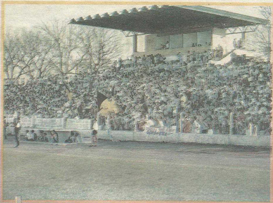
O velho Estádio do Cave será demolido para dar lugar a outro moderno estádio

Os dois estádios vão servir de treinamento para as seleções que vão participar do grupo que terá Brasília como sub-sede da Copa do Mundo de 2014, que será realizada no Brasil. Por isso, serão construídos nos padrões exigidos pela