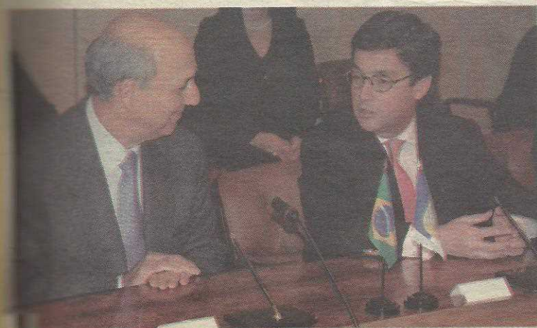
Arruda e o presidente do Bird, Luiz Alberto Moreno