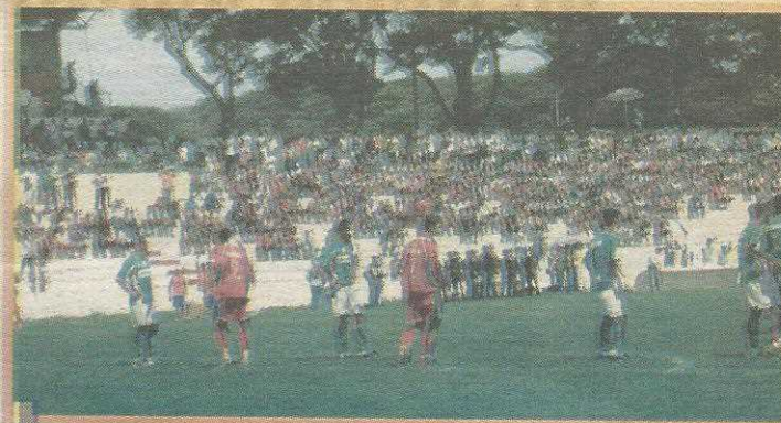
Cerca de 2 mil pessoas estiveram no Cave

Time da cidade está em 6º lugar no Campeonato Brasileiro