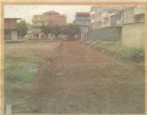
Obra deveria estar mais adiantada

Avaliada em R$ 1,3 milhão, a obra trará, além do