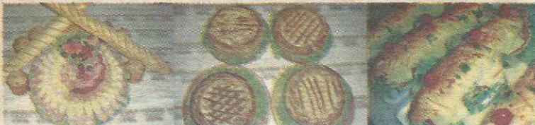
Tábuas de Frios - Tortas Salgadas - Sanduichos - Rahanada - Pães Especiais

Outra vantagem da página é oferecer links com diversos segmentos da Segurança Pública e organizações sociais como Conselhos Comunitários de Segurança - CONSEGs, e Junta de Prefeituras e Associações do Guará - JUNPAG.