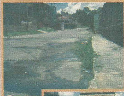
Água corre sobre o asfalto

As duas quadras foram entregues no final do segundo Governo Roriz e não foram, por causa da pressa na entrega,