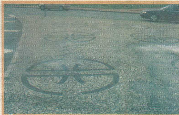
O calçamento em pedra portuguesa está sendo todo recuperado, para evitar acidentes aos praticantes de caminhada

al, na QE 20, vai contar com uma nova, mais ampla e melhor estruturada área para estacionamento. De acordo com ele, o custo total da obra está estimado em R$ 61 mil em execução para empresa Bela Vista Terraplanagem e Urbanização.