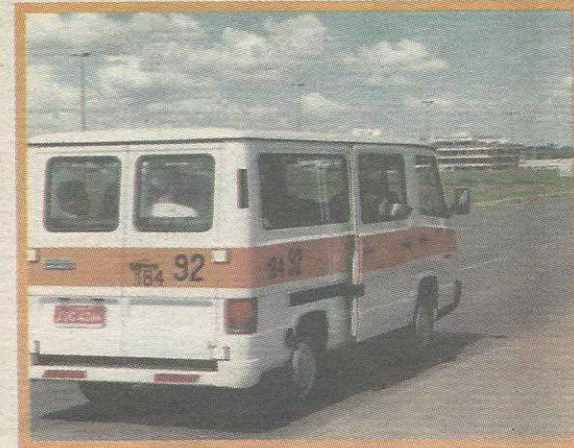
Superlotação e excesso de velocidade - as reclamações mais comuns dos usuários