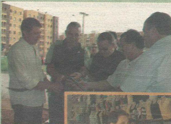
O governador em exercício em visita à Feira do Guará