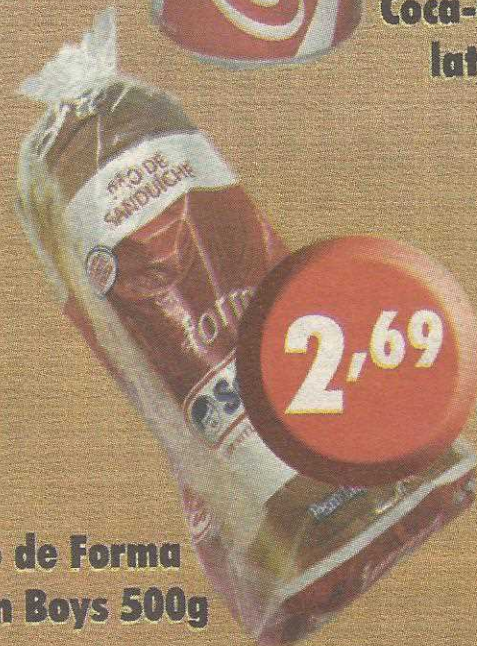
Pão de Forma Seven Boys 500g