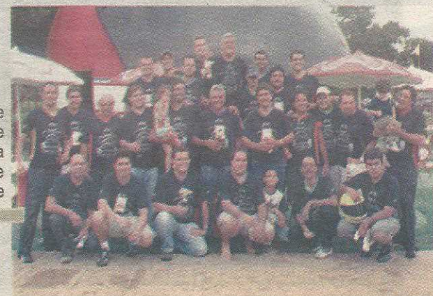
O grupo reúne 54 pilotos, que buscam a diversão e a amizade

Ou enviar uma mensagem para speedsinvas@gmail.com .