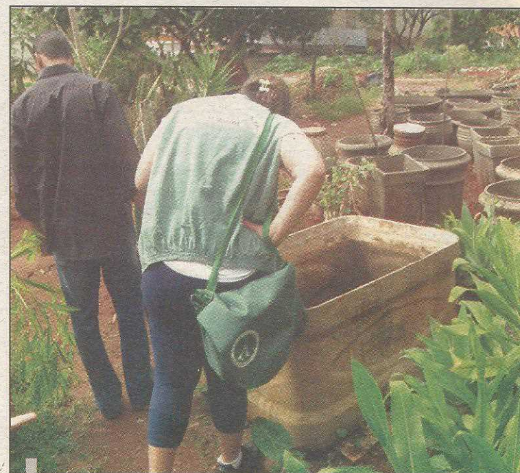
Técnicos do governo têm se surpreendido com a falta de cuidado dos moradores para evitar a presença do mosquito

Uma das principais preocupações da operação contra a dengue é o ramo de oficinas e lojas de pneus. Uma equipe está percorrendo a cidade para a retirada de entulho e pneus velhos apontados pela comunidade como elementos que favorecem a doença. Nas oficinas, os proprietários e funcionários são instruídos a não acumular material