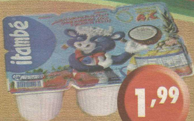
Iogurte Polpa Itambé 600g