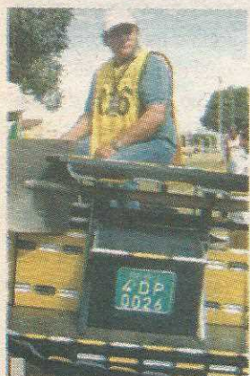
A partir de agora, só vão poder circular as carroças identificadas