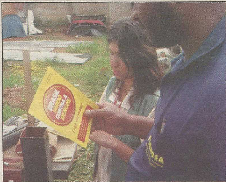
Folheto explicativo sobre a dengue está sendo distribuído durante a campanha no Guará

A forma de combate mais eficaz contra a dengue é evitar que o mosquito nasça. Mais de 90% dos focos do mosquito Aedes aegypti , de acordo com levantamento de técnicos da Secretaria de Saúde, estão concentrados nas residências.