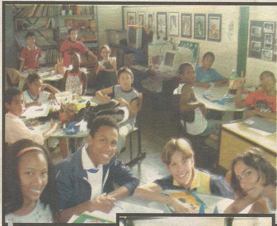
Os talentos estão nas artes, na Matemática, nos jogos...

As produções dos estudantes estão à disposição para quem quiser conhecer e ajudar.