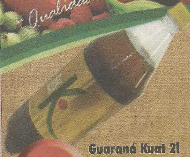
Guaraná Kuat 2l