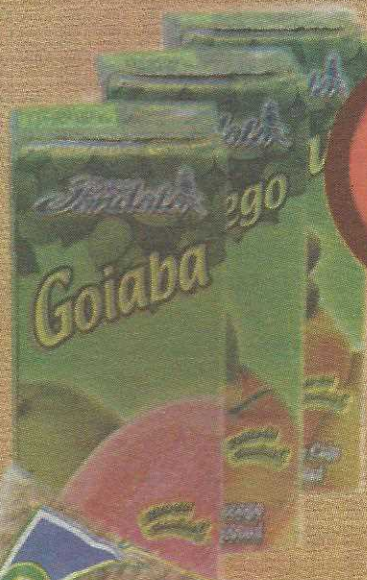
Suco Jandaia 200ml