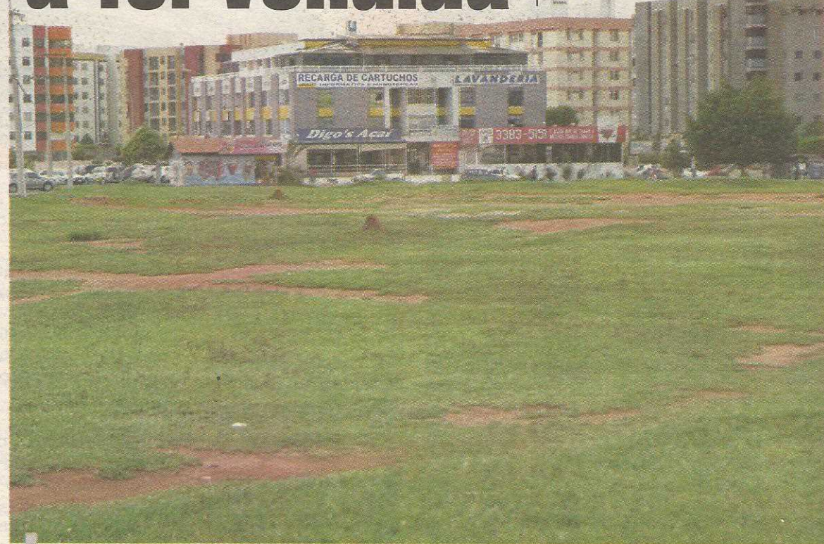
De acordo com incorporadores, os preços dos terrenos estavam 50% acima do mercado

Outro incorporador, que preferiu não se identificar, culpa também a Medida Provisória editada no mês passado pelo GDF suspendendo todos os alvarás de construção na Região do Guará. "O mercado está muito assustado com a instabilidade e a insegurança jurídica provocadas pela medida. Como é que alguém vai investir tanto dinheiro correndo o risco do governo mudar de humor no meio do caminho. As empresa de fora, de capital aberto, não investi-