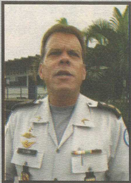
Cel. Lobo é morador do Guará há 15 anos

te. Ela não tem como estar em todos os locais para proteger o cidadão o tempo todo. É preciso que cada um procure se prevenir como puder para evitar o crime", diz.