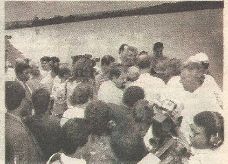
O ato se transformou numa grande festa, com a presenç4 de cerca de 3 mil pessoas

As tr4s lagoas de oxidação - uma ao lado da OE 36, outra na OE 38 e a terceira no Sof Sul - foram criadas em 1970, com a inauguração da cidade, porque eram a 4nica alternativa para recolher o esgoto produzido pelos moradores. Na 4poca, a cidade tinha apenas 30 mil moradores, mas com o aumento brusco da populaç4o para 100 mil habitantes em apenas 20 anos, as lagoas passaram a ser um transtorno para a populaç4o. Os im4veis estavam sendo desvalorizados porque muitos n4o suportavam mais o ataque dos mosquitos e o mau cheiro do es-