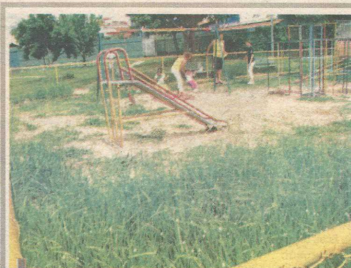
Parquinho infantil quase sem condi4oes de uso