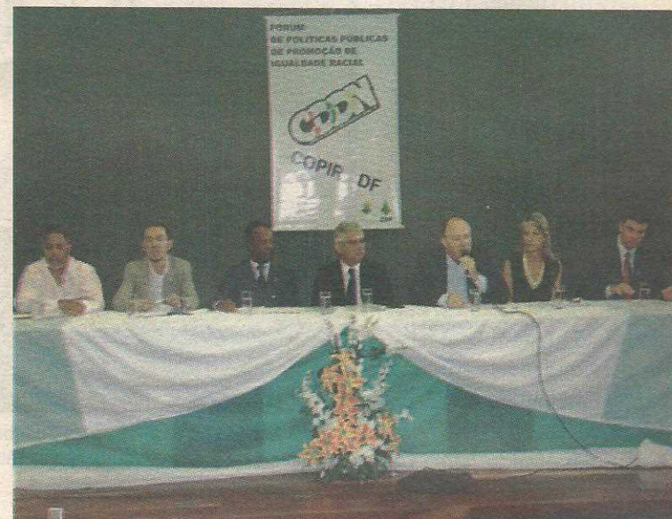
O fórum abriu a série que será realizada em todo o DF sobre o assunto

Durante o fórum, foi ministrada palestra sobre o Plano Nacional de Implementação da Lei 10.639/03, que incluiu no currículo oficial da Rede de Ensino a obrigatoriedade do estudo da história do povo negro no Brasil, resgatando sua contribuição nas