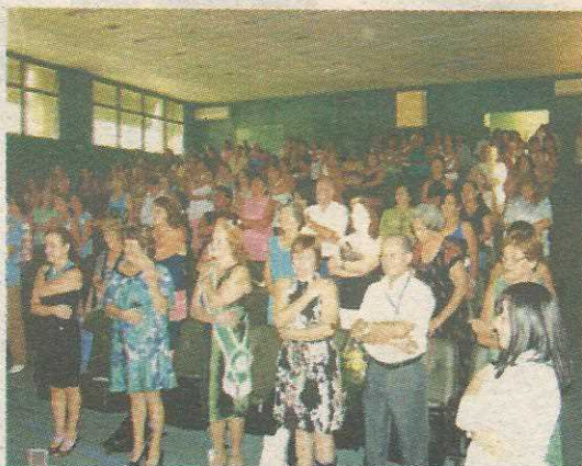
Cerca de 200 mulheres foram homenageadas

O evento em homenagem ao Dia Internacional da Mulher promovido pela Administração Regional do Guará emocionou as cerca de 200 participantes. Na última sexta-feira (dia 6), o auditório da Administração ficou totalmente ocupado