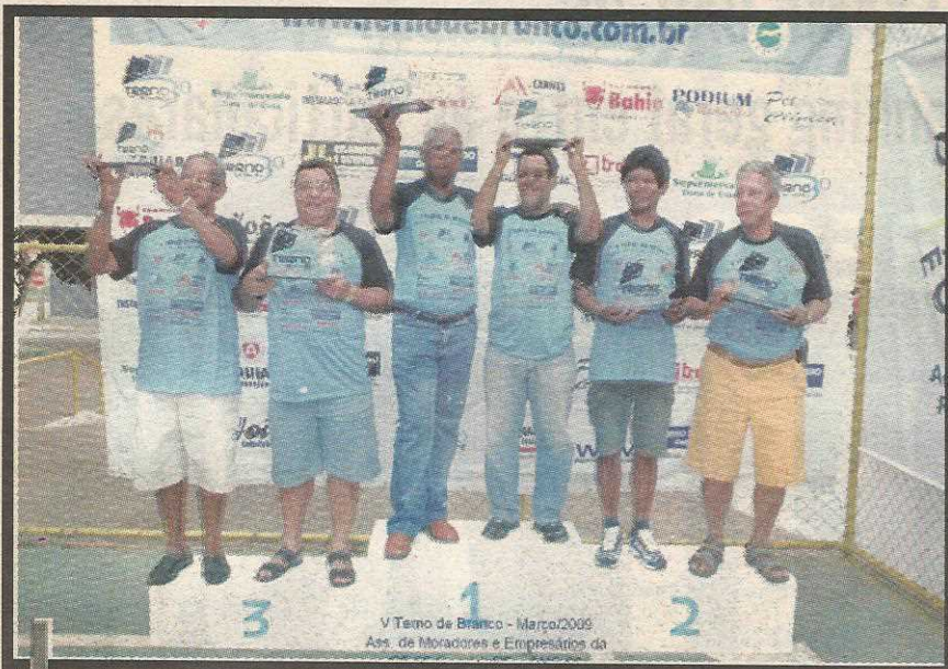
O pódio não teve representantes do Guará