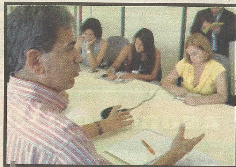
Presidente da Câmara na conversa com os jornalistas

Para compensar, a Mesa decidiu contingenciar recursos pro-