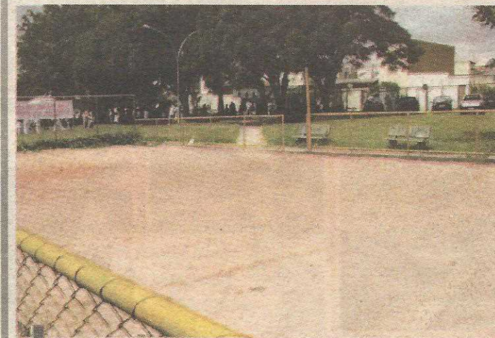
Quadra de areia foi reformada no ano passado, mas, de acordo com moradores, a quantidade de areia colocada foi menor do que teria sido licitada

Os moradores pedem tamb4m a constru4o de um posto comunit4rio de seguran4a nas proximidades da passarela da QE 1, a implanta4o de um projeto de coleta seletiva de lixo, em parceria com ONGs ambientalistas, a recomposi4o das placas de sinaliza4o, a volta do policiamento ostensivo da PM e a revitaliza4o da Reserva Biol4gica do Parque do Guar4, vizinha 4s duas quadras.