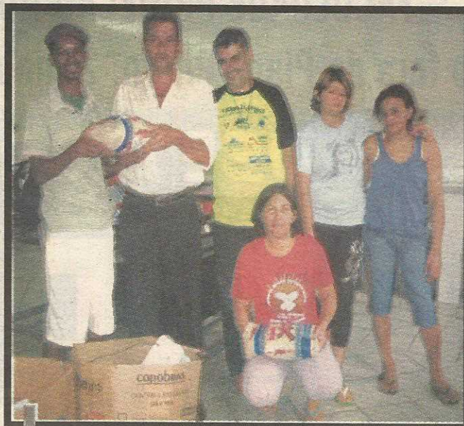
Núcleo Social Santo Aníbal recebe os donativos