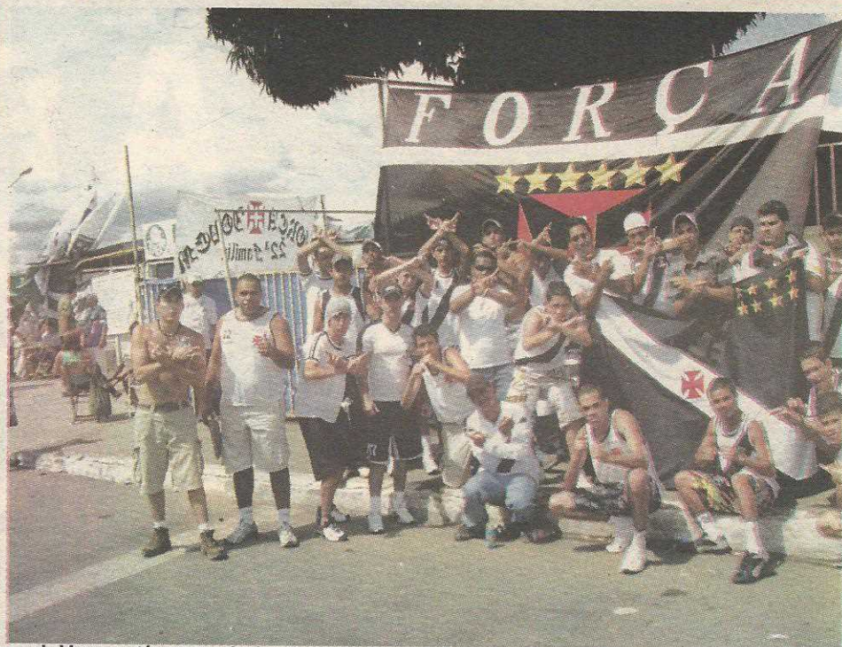
As duas torcidas são vizinhas no Pontão do Cave. A Mancha Verde é bem maior, mas a Força Jovem do Vasco está crescendo depois que veio para o Guará