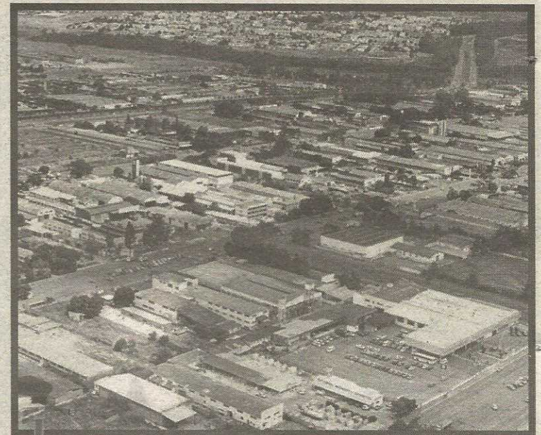
O SIA foi o respons4vel pela cria4o do SRIA, primeira denomina4o oficial da cidade do Guar4

Vencidos pela insist4ncia Mesmo com a promessa de Wadj4, os representantes da co-