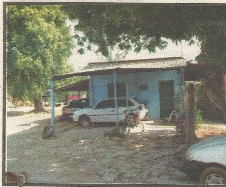
As duas emendas garantiriam a permanência de 70 chacareiros, que ainda insistem em ficar na área ambiental

Haveria ainda outra inconstitucionalidade, porque a concessão de terras públicas somente pode ser proposta pelo governo. O Tribunal de Contas do Distrito Federal tem cancelado todas as leis e emendas de autoria dos deputados distritais que se referem ao assunto. O principal exemplo foi o cancelamento de todas as concessões de terrenos para igrejas, templos e outras entidades aprovadas pela Câmara Legislativa. Essas concessões estão sendo liberadas agora porque a proposta foi encaminhada pelo GDF.