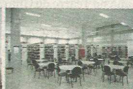
P4 - FACULDADE PROJEÇÃO BIBLIOTECA CENTRAL TAGUATINGA *