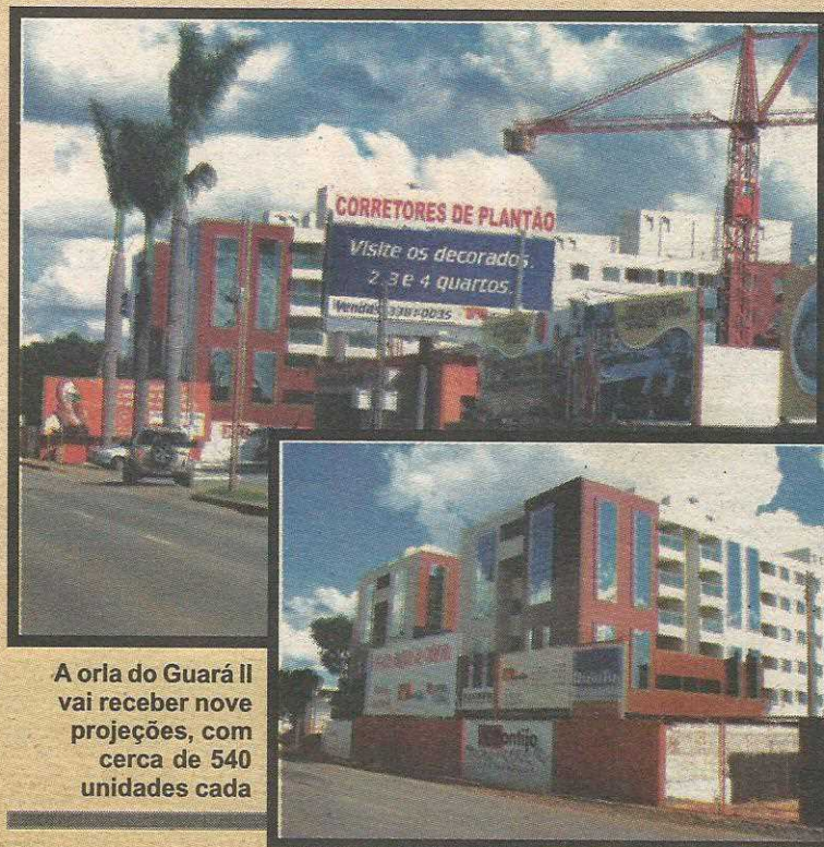
A orla do Guará II vai receber nove projeções, com cerca de 540 unidades cada

Com essa população, a cidade do Guará passa a ser incluída no grupo das 60 maiores cidades brasileiras e a quarta maior região administrativa do Distrito Federal, atrás apenas de Taguatinga, Sobradinho (incluindo os condomínios) e Samambaia.