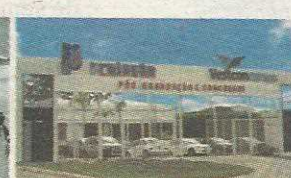
P5 - NÚCLEO DE PÓS-GRADUAÇÃO PLANO PILOTO - 906 NORTE