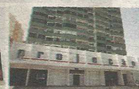
P3 - FACULDADE PROJEÇÃO NÚCLEO DE PRÁTICA JURÍDICA E LABORATÓRIOS DE COMUNICAÇÃO SOCIAL TAGUATINGA