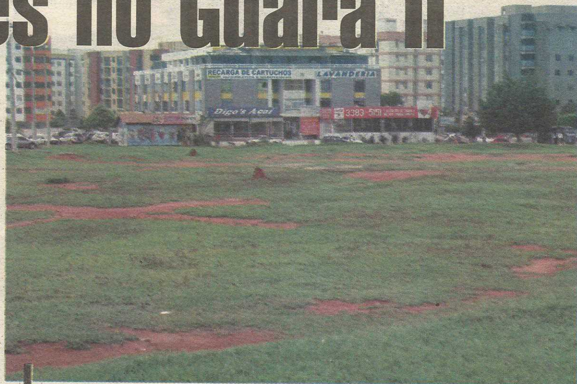
A maioria dos terrenos está na QI 31, em frente ao Centrão

Com a alteração do gabarito no Plano Diretor Local (PDL) do Guará, cada edifício pode ter até 13 andares, o que vai provocar um desnivelamento visual no centro do Guará, porque todos os outros edifícios têm seis andares.