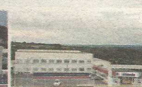
P7 - FACULDADE PROJEÇÃO GUARÃ II