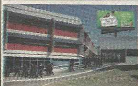
P1 - COLÉGIO E FACULDADE PROJEÇÃO TAGUATINGA