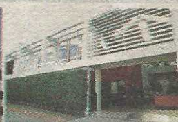
P2 - FACULDADE PROJEÇÃO TAGUATINGA