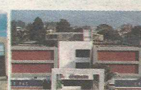
P6 - COLÉGIO PROJEÇÃO UNIDADE GUARÃ