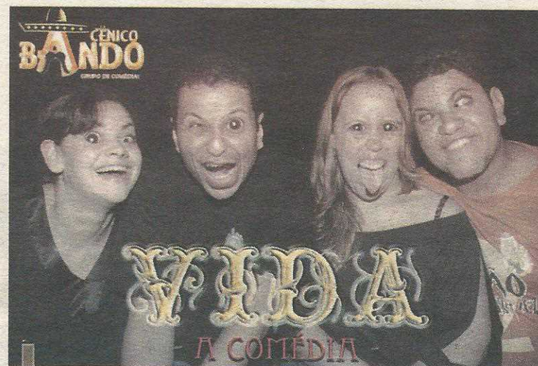
Peça promete muitas risadas ao público

Além dessas novidades, a peça vai continuar apresentando as esquetes das duas irmãs siamesas que mostram como é difícil nascer tão colada com alguém; uma sala de parto onde