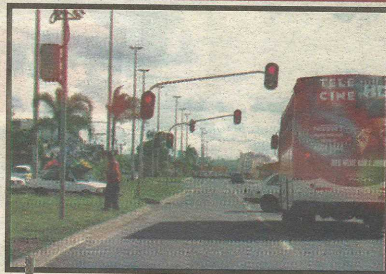
Moradores vão ajudar na formação da política de trânsito no Guará

A Administração Regional do Guará está colaborando com a