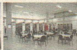
P4 - FACULDADE PROJEÇÃO BIBLIOTECA CENTRAL TAGUATINGA