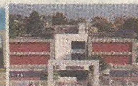
P6 - COLÉGIO PROJEÇÃO UNIDADE GUARÁ