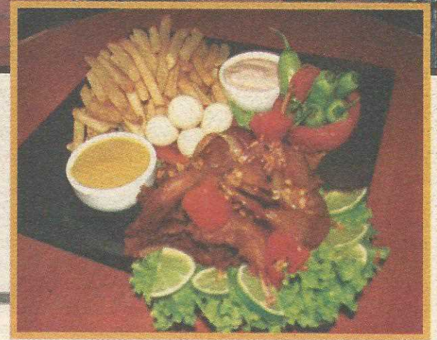
Com a lei seca, maior parte da clientela da Casa da Codorna passou a ser do Guar

melhores votados pelos clientes e por jurados que visitam os bares durante esses 20 dias sem se identificar e avaliam a qualidade do petisco e o atendimento.