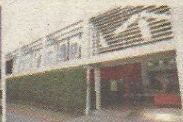
P2 - FACULDADE PROJEÇÃO TAGUATINGA