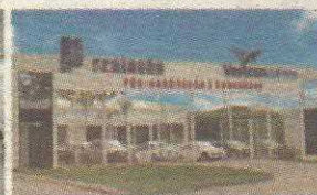
P5 - NÚCLEO DE PÓS-GRADUAÇÃO PLANO PILOTO - 906 NORTE