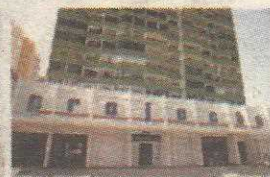
P3 - FACULDADE PROJEÇÃO NÚCLEO DE PRÁTICA JURÍDICA E LABORATÓRIOS DE COMUNICAÇÃO SOCIAL TAGUATINGA