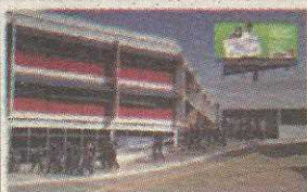
P1 - COLÉGIO E FACULDADE PROJEÇÃO TAGUATINGA