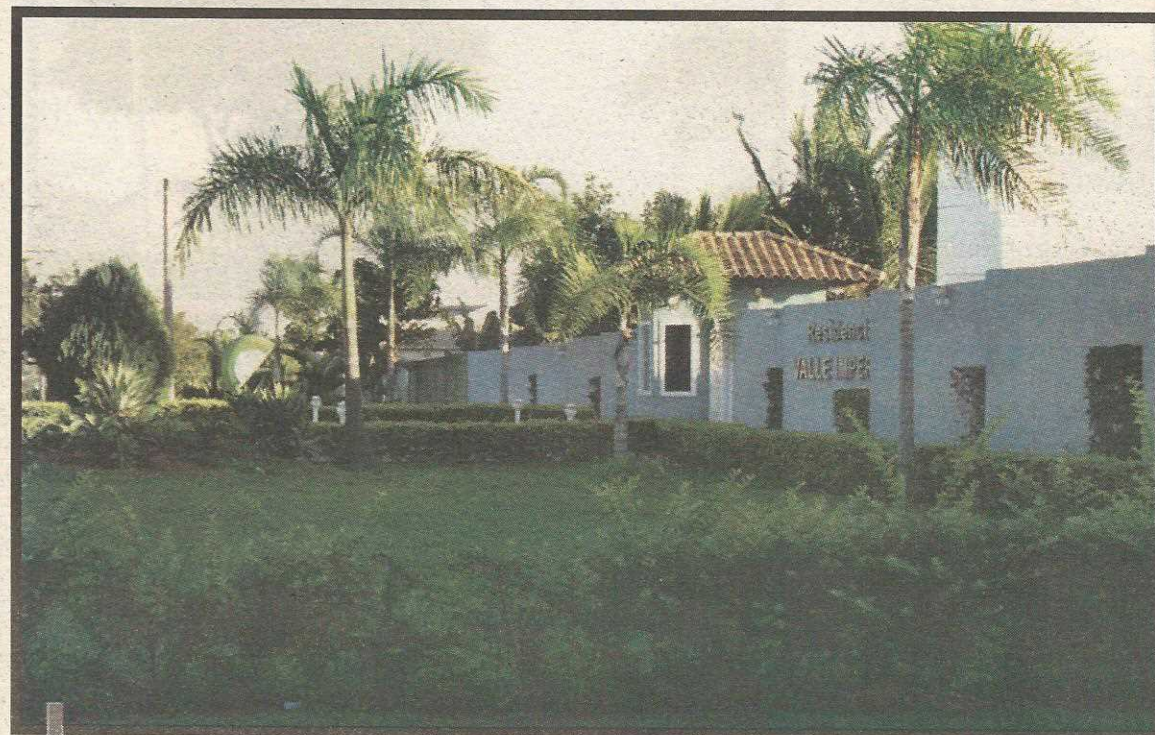
A parte do bairro entre o Córrego Vicente Pires e o Jockey Clube deixa de pertencer à Região do Guará

A cooperação entre os governos vai além. Na primeira semana de