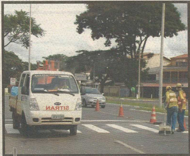
Providência atingirá todas as vias do Guará

Além das faixas, o órgão instalou semáforos para pedestres nos principais pontos de circulação do Guará. O alerta auxilia na atenção do motorista e aumenta a segurança para quem atravessa as ruas. Ao ser acionada pelo pedestre, a sinalização fica vermelha para os carros por um tempo e depois volta a ficar verde. O semáforo só pode ser acionado novamente após algum tempo, o