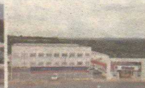
P7 - FACULDADE PROJEÇÃO GUARÁ II