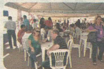
Churrasco de inauguração do apto. decorado - 09/05