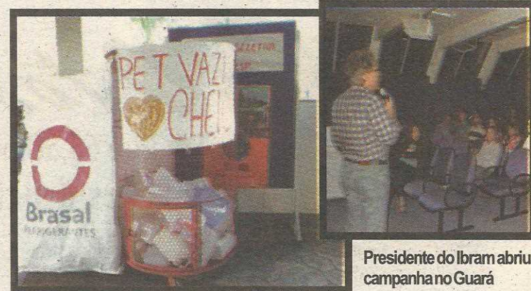
Presidente do Ibram abriu campanha no Guará