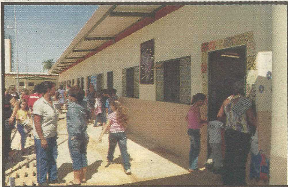
Construção é moderna e funcional. Foram investidos R$ 1,8 milhão

Com a inauguração da Escola Classe (EC) 02 na Vila São José, em Vicente Pires, 560 alunos matriculados em escolas de Taguatinga passaram a estudar perto de casa. Além de representar uma economia mensal de R$ 25 mil com transporte escolar, o funcionamento da nova unidade, a segunda de Vicente Pires, amplia a oferta de vagas na rede pública para o próximo