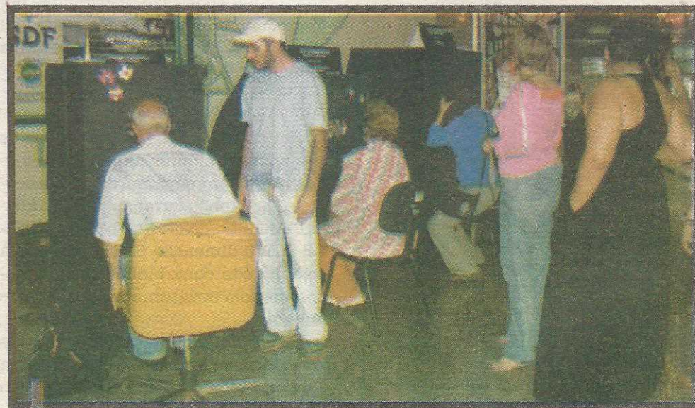
Novidade despertou o interesse do público que esteve na Administração

Contatos com a produção da Companhia: (61) 8171-3731 e (61) 8402-3120.