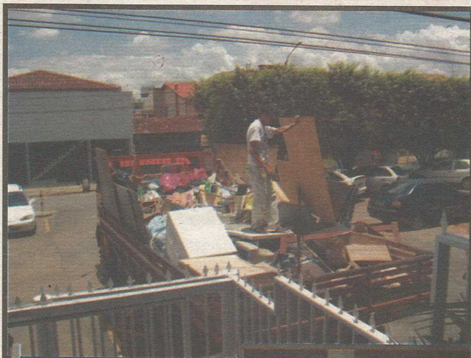
Foram recolhidos três caminhões de produtos descartados pelos moradores