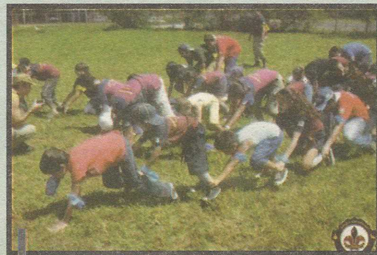
Gincana durou uma semana com tarefas variadas

Os encontros foram realizados nos dias 28 e 29 de novembro e 5 de dezembro no Complexo do Cave - Guará II. Mas a gincana se estendeu durante toda a semana com tarefas de enigmas a serem realizadas pelas equipes participantes. Quatro equipes mistas (incluindo pessoas da comunidade) empenharam-se nas realizações das dinâmicas ao redor do Teatro de Arena e do próprio Clube de Vizinhança (ponto de encontro dos escoteiros da cidade, que promovem