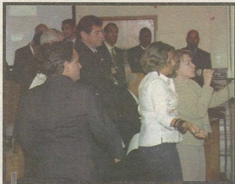
Deputados preferiram parar os trabalhos mesmo diante da pressão da população para discutir a crise no GDF

Também foi definida a composição da CPI, que terá como