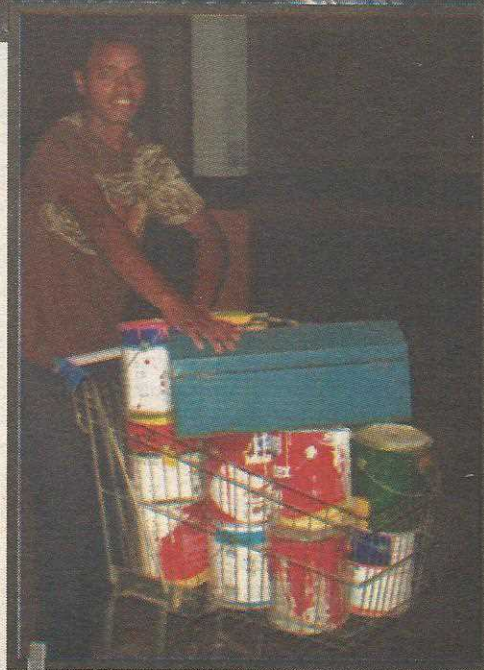
Quase tudo é reaproveitado