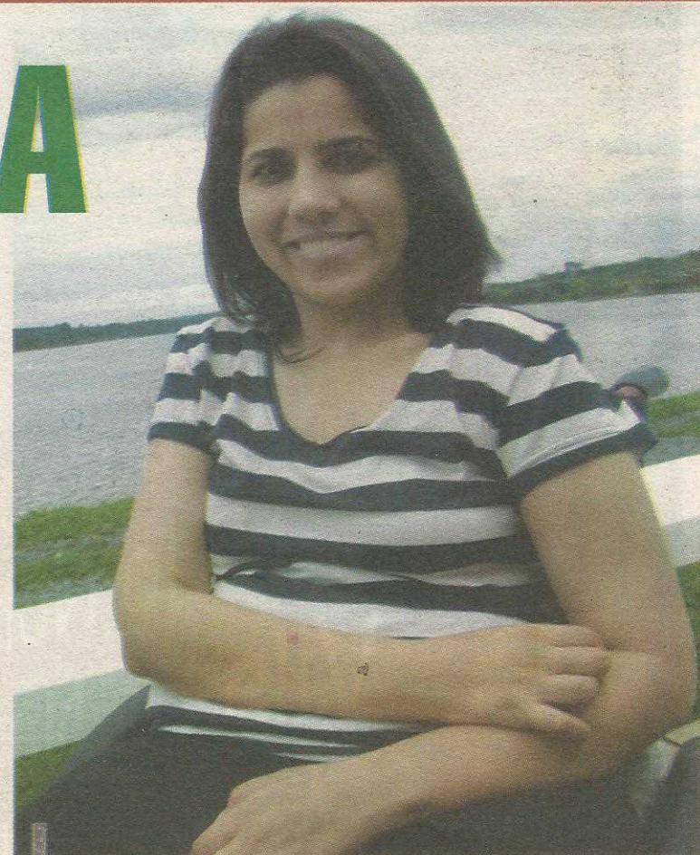
Jornalista vive drama semelhante à personagem Luciana