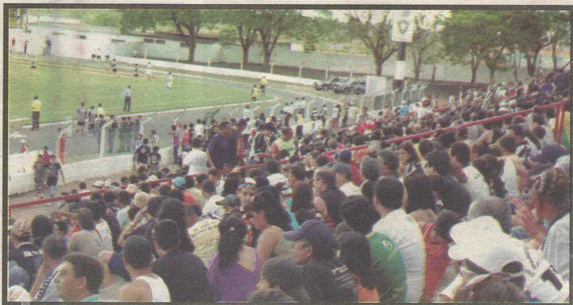
Reforma será quase completa. Capacidade será mantida, mas conforto aumenta

O Botafogo DF estreia no Campeonato Brasileiro da primeira divisão no dia 16 de janeiro, no Cave, contra o Brasiliense.