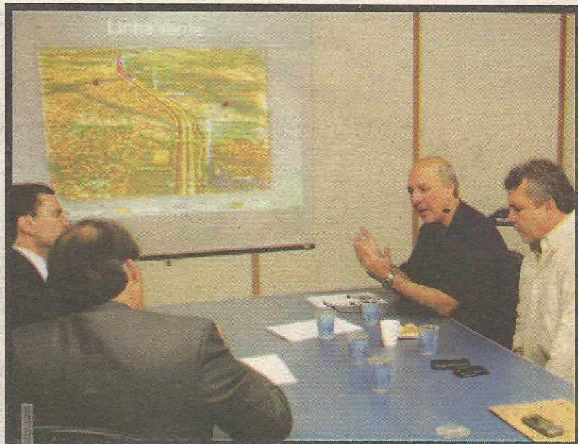
Arruda e Fraga conversam com os representantes do consórcio