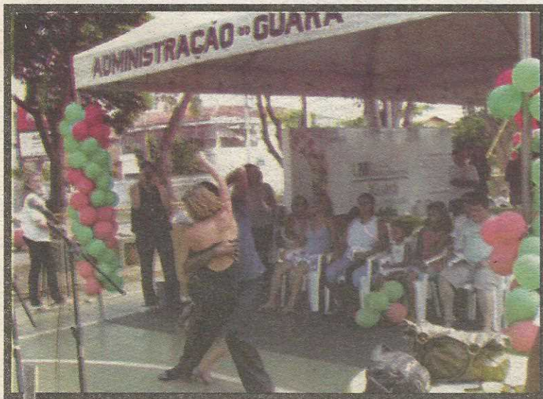
Enquanto os pais aproveitavam os serviços oferecidos, as crianças se divertiam nos brinquedos montados na praça