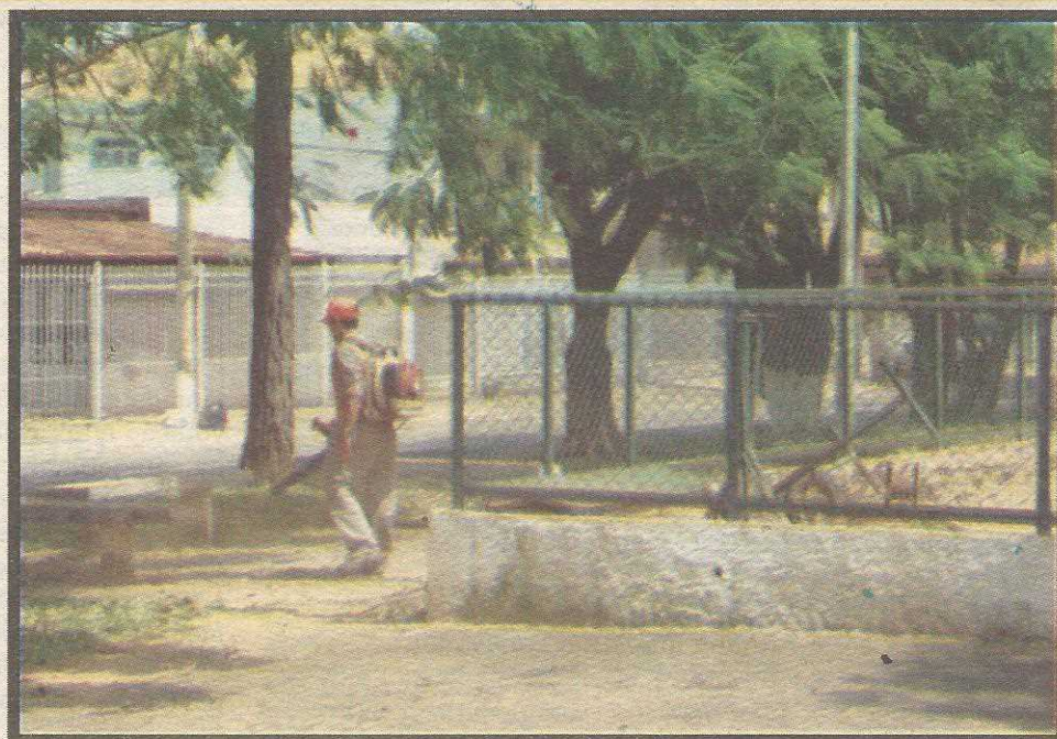
Serviço vai deixar praças e áreas públicas prontas para serem utilizadas pelos moradores durante as férias