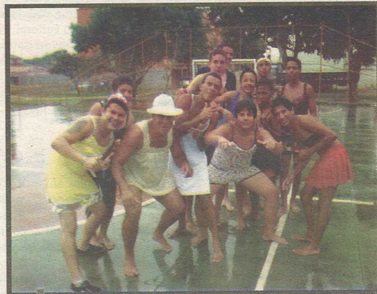
A festa mobilizou todas as faixas et4rias de moradores da quadra e mostrou a integraç4o entre eles

A Administraç4o tem apoiado iniciativas como essa constantemente, precisamos garantir que os guaraenses que queiram se organizar para lutar pela cidade ou festejar datas importantes tenham o apoio necess4rio para o sucesso de suas empreitadas"