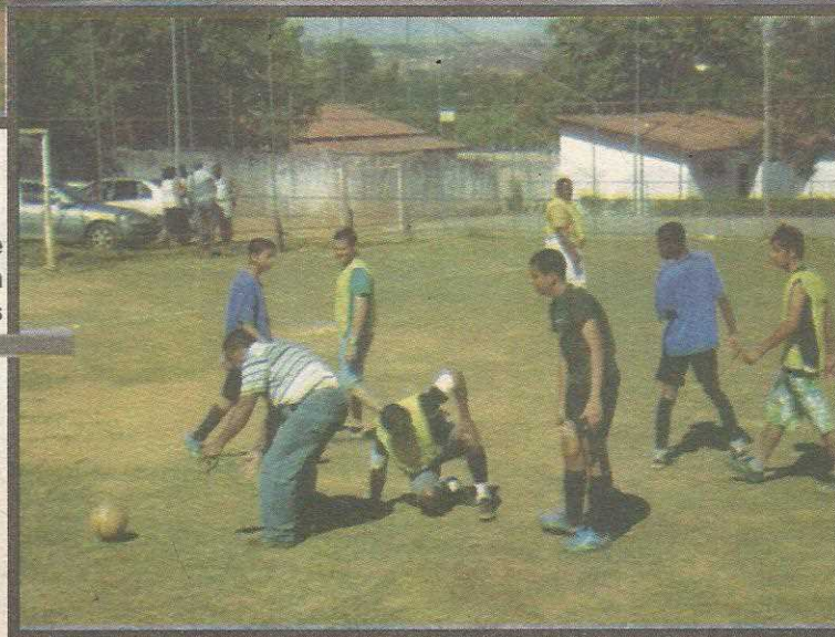
Escolinhas de esporte mantêm jovens ocupados