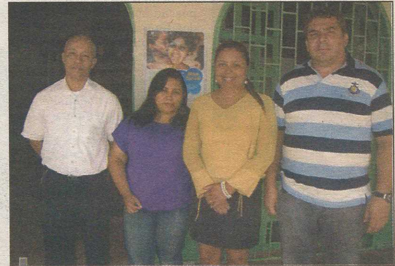
Por enquanto, Conselho do Guará é formado por quatro membros, porque a quinta vaga depende da Justiça

Hoje o Conselho Tutelar do Guará funciona na Casa das Pedras, imóvel da Administração do Guará sede da Gerência de Desenvolvimento Social e de várias ONGs que prestam assistência social. Além o espaço físico, a Administração do Guará apóia como pode o Conselho, cedendo material de escritório, mobiliário e computadores, além de uma carro da administração à disposição duas vezes