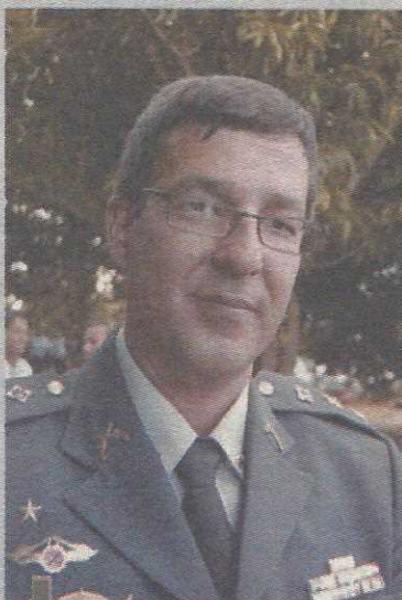
Novo comandante quer maior aproximao com moradores

o de palestras s ONGs da cidade sobre o assunto, e a reduo da criminalidade em cerca de 9,5% em toda a jurisdio do 4 BPM (Guar, SIA e Estrutural). Lembrou tambm da instalao da biblioteca pblica no prdio do comando, com mais de 2 mil obras,  disposio da comunidade guaraense.