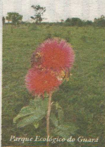
Parque Ecológico do Guará

E na luz de prata do luar / das lindas noites do Guará!