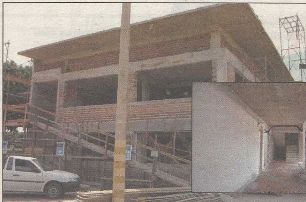
Obra est dentro do prazo previsto para a concluso