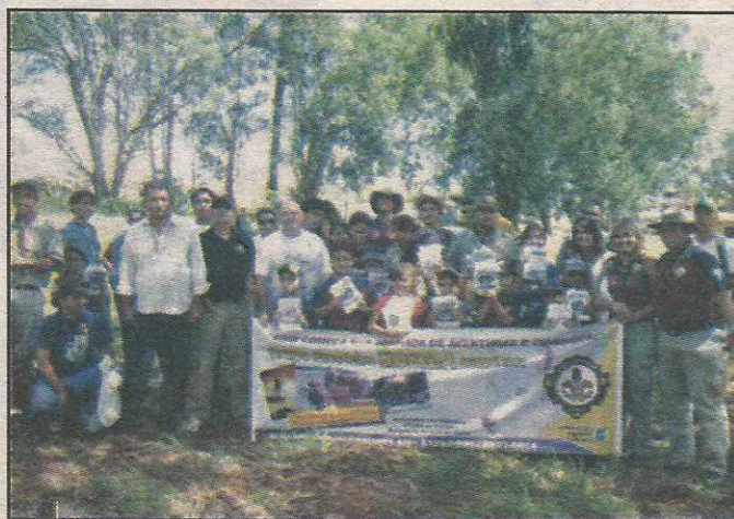
A participação dos escoteiros tem o objetivo de conscientizá-los também

ção também fará vistorias pela cidade para verificar áreas que precisam de reparos para evitar empoçamento de água e outras condições favoráveis ao desenvolvimento do mosquito. Os moradores que quiserem contribuir com informações e denúncias podem procurar a Ouvidoria da Administração ou telefonar para o número 3383-7237.