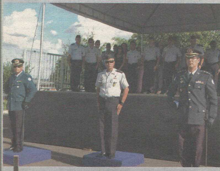
Troca de comando no 4 BPM foi nesta quarta