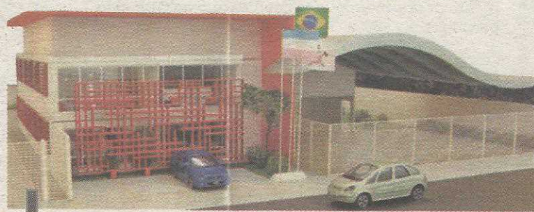
Como vai ficar a unidade dos Bombeiros no Guar

Durante a construo, os Bombeiros podero ser acionados para emergncia no prdio da Agncia do Trabalhador, entre o lote do quartel e o do Po de Augar. Uma base da Companhia est lotada na Administrao Regional do Guar para atendimento  comunidade quando houver necessidade de vistorias ou alvars.