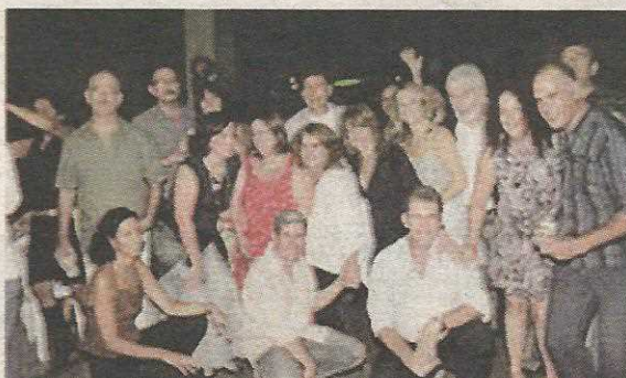
Festa marca o reencontro dos colegas da melhor fase do GG