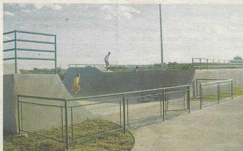
E pista de skate

O Complexo Esportivo fica próximo ao Posto Comunitário de Segurança, do Centro de Saúde e da Horta Comunitária. Além de oferecer uma estrutura moderna contendo equipamentos para prática de exer-