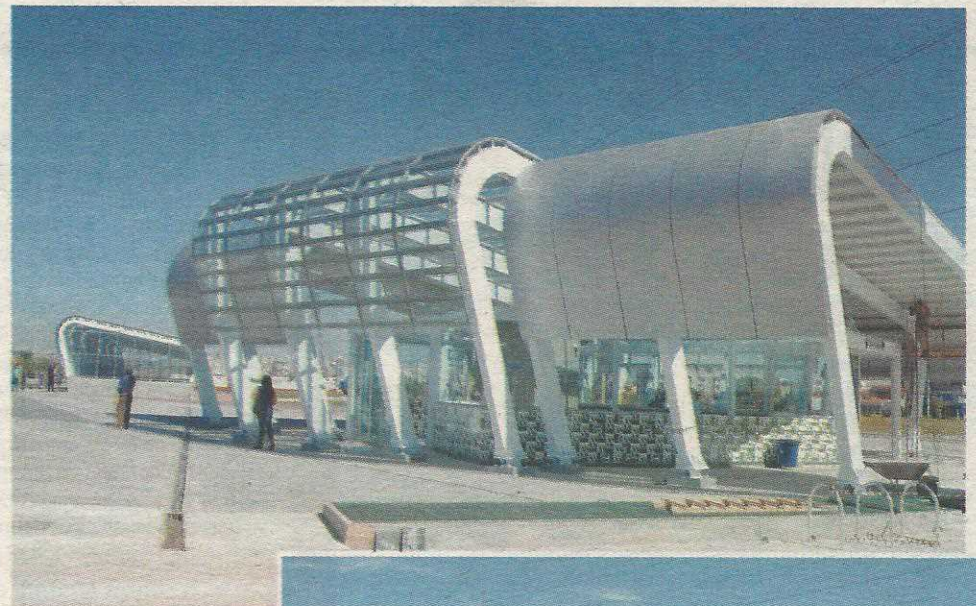
Estação é a mais moderna do DF

Situada na altura da QI 23 do Guar4 II, a nova estação fica a 900 metros da Estação Feira, em local de acesso privilegiado tanto à comunidade do Guar4 I quanto do Guar4 II. Esta é a 24ª estação do Metrô-DF. A linha completa prevê a operação de 29 estações. Atualmente, o sistema transporta 160 passageiros/dia