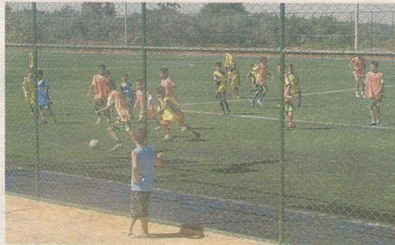
Campos de grama sintética

Cartório Eleitoral Chefe: Sandra Regina Gonçalves QI 7 Lote C Fone: 3382.7741