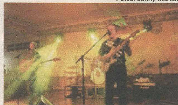
Os Pholhas fizeram o pblica cantar e danar os sucessos prprios e outros dos anos 70 e 80