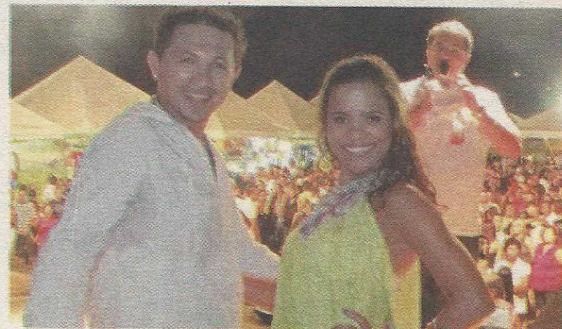
Forró Atraente, ao lado de bandas de pagode e axé animam o Teatro de Arena no domingo

O evento tem entrada franca e classificação etária livre. Esse evento retoma em 2010 a utilização do Teatro de Arena, que será seguido nos próximos finais de se-