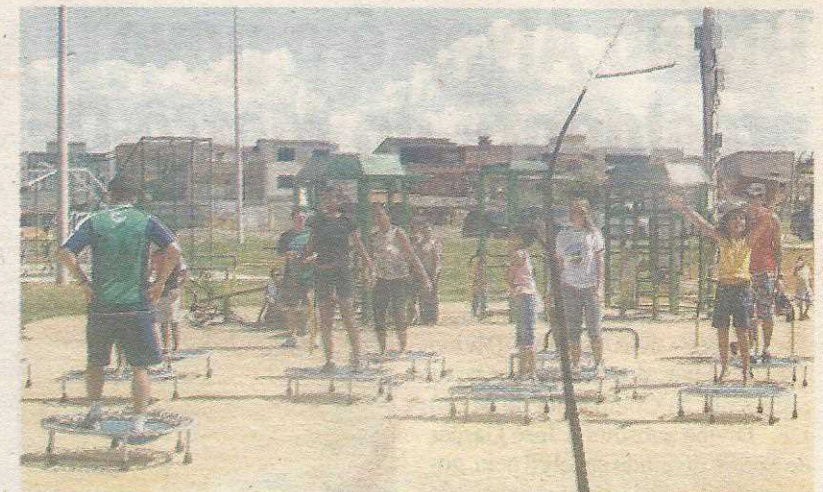
Equipamento de ginástica