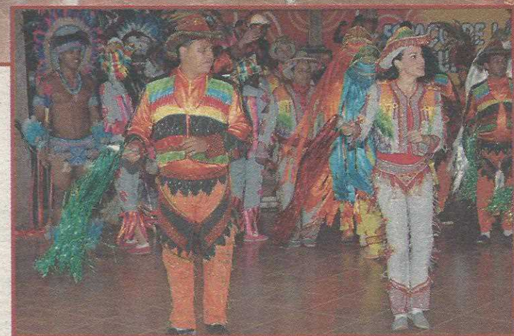
Em todas as casas visitadas há a apresentação da catira