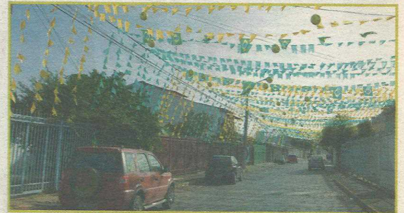
Alguns conjuntos da QE 32 se prepararam para a Copa

A Administração Regional do Guará também entrou no clima. Todo o prédio está decorado com bandeiras