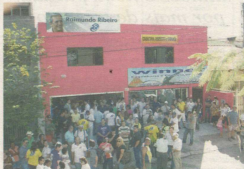
Escritório fica no Conjunto A da QE 32