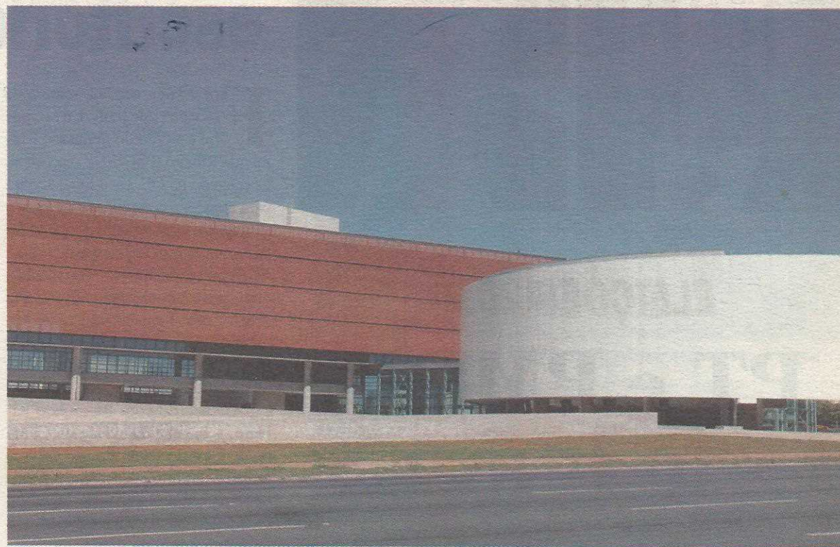
Nova sede está pronta para receber os distritais e os servidores

A nova sede da Câmara Legislativa custou cerca de R$ 106 milhões, quatro vezes mais o orçamento inicial. Os recursos foram divididos no orçamento da Câmara e do GDF - a obra foi retomada no início do Governo Aruda, quando o governo se comprometeu a liberar os recursos necessários para a conclusão.