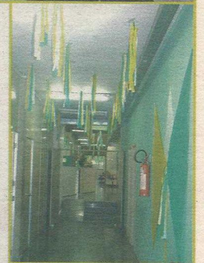
Prédio da Administração do Guará está no clima da Copa

Muitas ruas começaram a decoração, mas estão atrasadas. A expectativa é que neste fim de semana, antes da estreia do Brasi (dia 15 - terça-feira), é que outros locais sejam enfeitados. O Jornal do Guará vai divulgar as fotografias das ruas, casas e prédios melhor decorados para a Copa do Mundo ao longo da competição. Envie suas fotografias por correio eletrônico e deixe os seus dados para contato ( jornaldoguara@terra.com.br ).