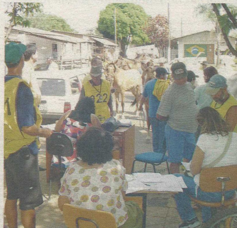
Mesmo com campanhas anteriores de conscientização, carroceiros continuam jogando entulho em qualquer lugar

O despejo de lixo em áreas ilegais pode gerar autuação e aplicação de multa que varia de R$ 150 a até R$ 50 mil. Segundo a Agefis, agentes sairão pela cidade fotografando e identificando os infratores para agirem de forma incisiva em defesa da limpeza na cidade. Os carroceiros que não cumprirem a determinação, terão suas carroças apreendidas.