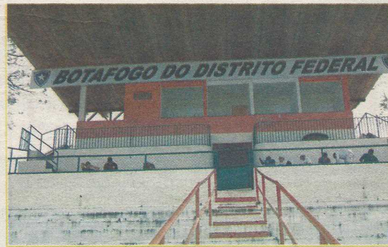
Parte das reformas foi feita pelo próprio Botafogo DF