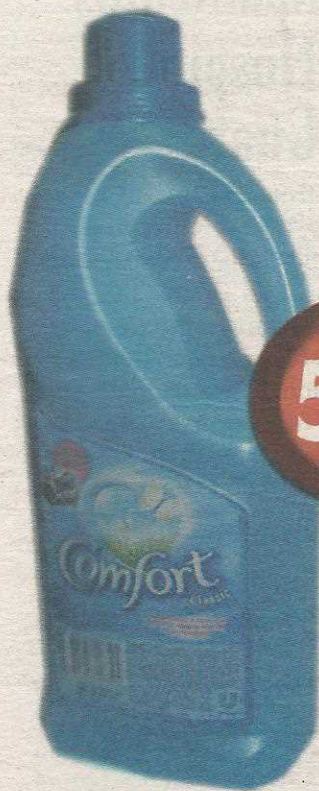
Amaciante Confort 2l Azul tradicional