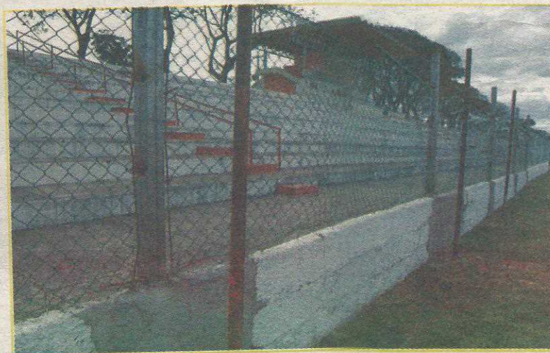
Instalações são antigas e estão deterioradas

No Bezerrão, o Botafogo joga dia 20 de julho contra o Araguaína (Tocantins), dia 7 de agosto contra o Ceilândia, e dia 14 de agosto contra o Brasília, na primeira fase da competição.