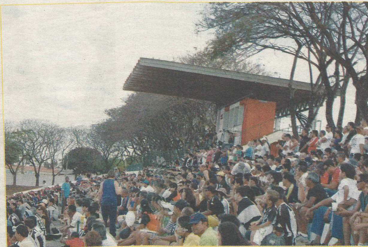
Trocedor do Botafogo DF terá que acompanhar time no Bezerrão

Antigo e sem reformas Com mais de 30 anos de construído, o Estádio do Cave nunca sofreu qualquer reforma