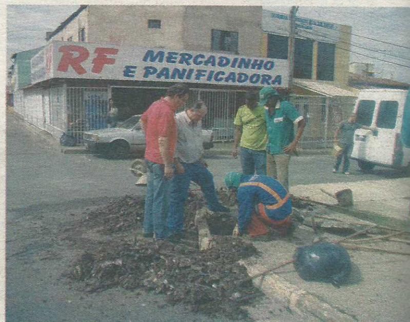
Limpeza vai evitar entupimento da rede