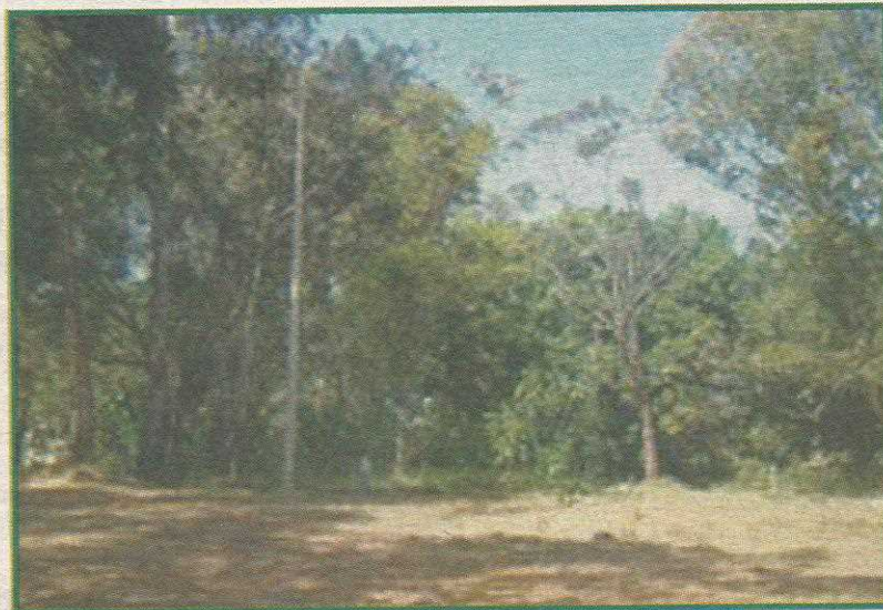
O parque ainda preserva parte de mata do cerrado e uma nascente