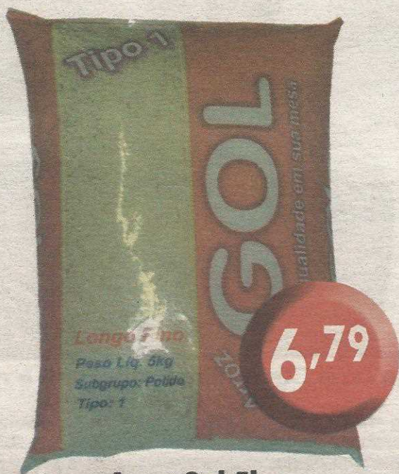
Arroz Gol 5kg