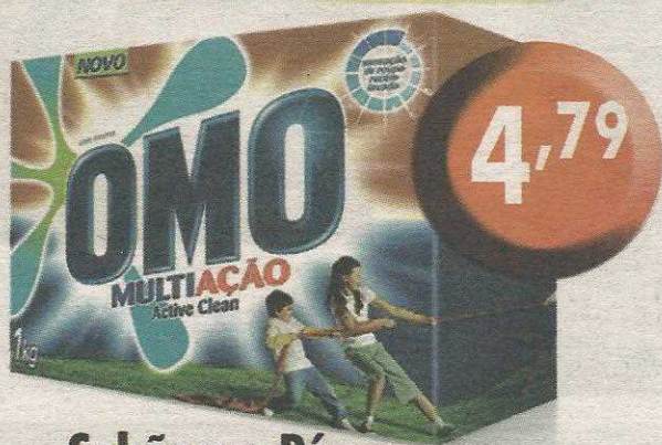
Sabão em Pó OMO Multiacção 1kg