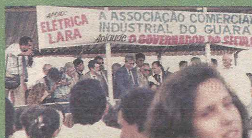
Solenidade de entrega dos lotes da QE 40