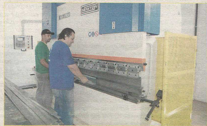
Equipamentos são os mais modernos da atividade