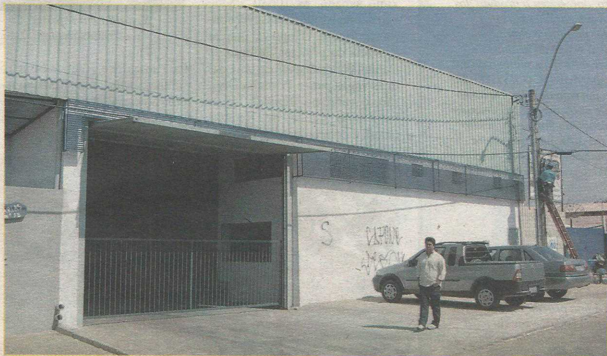
Indústria ocupa área de 520 metros e oferece 12 empregos diretos