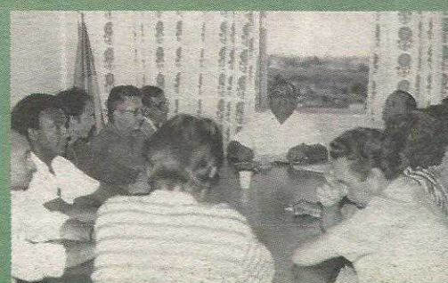
Empresários numa das reuniões nos melhores tempos da Acig