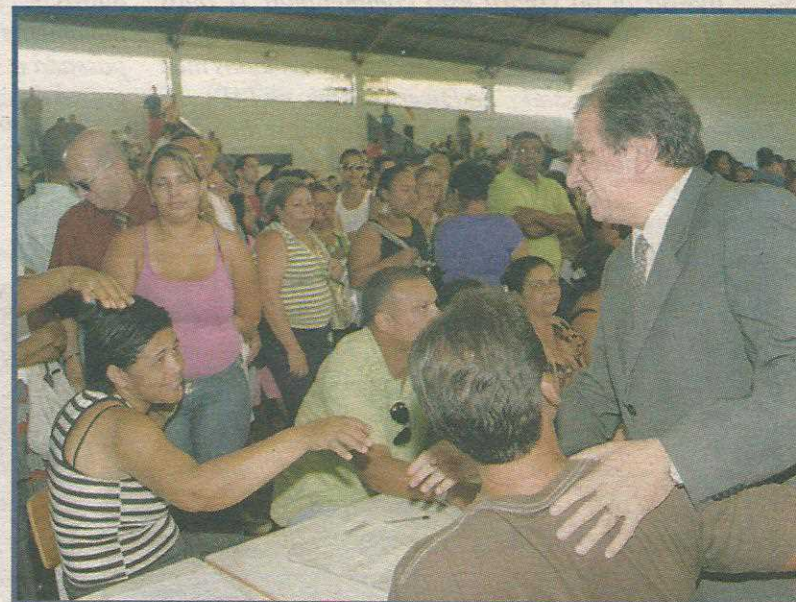
Para Izalci, a Educação é a melhor ferramenta para a qualificação

O economista Sérgio Besserman, ex-presidente do IBGE, é firme: "Avanço econômico, puro e simples, não garante melhorias na desigualdade. Principalmente quando falta uma política estruturante de distribuição do conhecimento." Outra figura nacional a defender a ideia, o presidente licenciado da Federação das Indústrias de São Paulo, Paulo Skaf