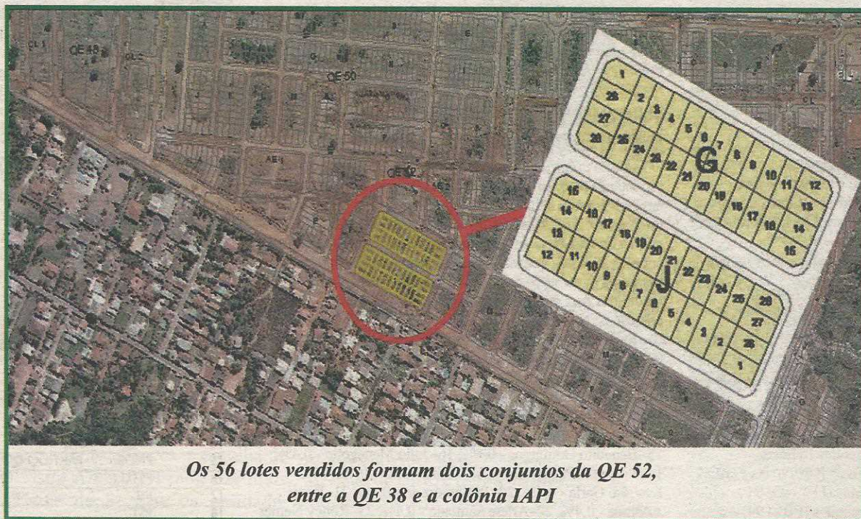
Os 56 lotes vendidos formam dois conjuntos da QE 52, entre a QE 38 e a colônia IAPI