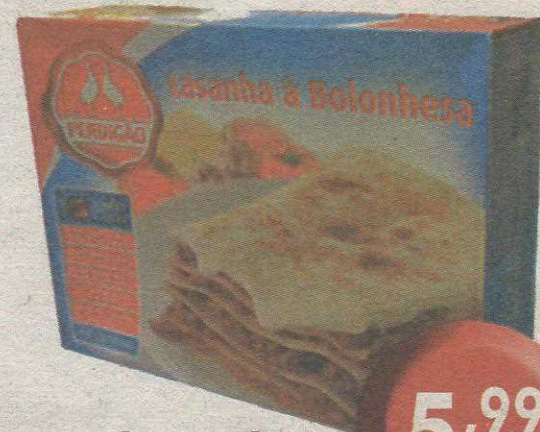
Lazanha Perdigão 650g