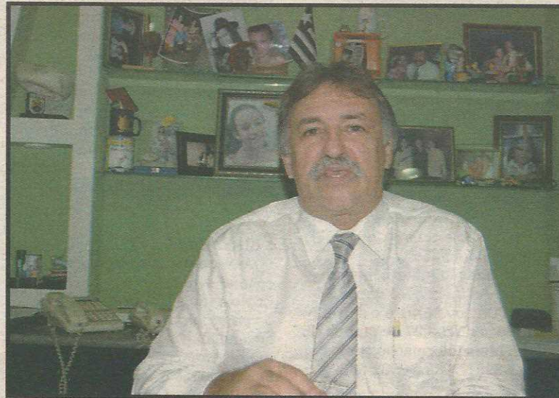
Aderbal: medidas a favor do locador

Aderbal garante que a SNI vai mexer com o conceito de locação de imóveis. A começar pela taxa de aluguel, que não será diferenciada entre "garantidos" e "não garantidos" como trata o mercado. "A SNI vai praticar o per-