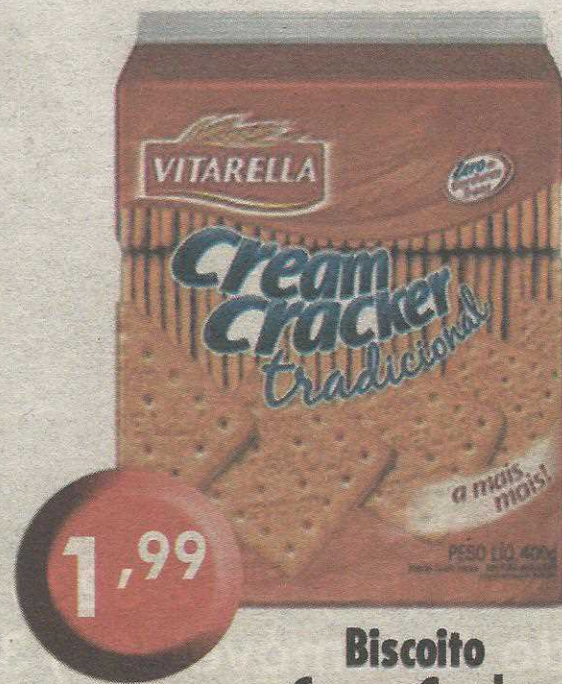
Biscoito Cream Cracker Vitarella 400g