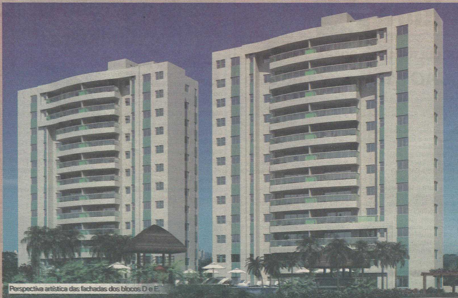
Perspectiva artística das fachadas dos blocos D e E.

O melhor 4 quartos do DF. Não existe nada igual.