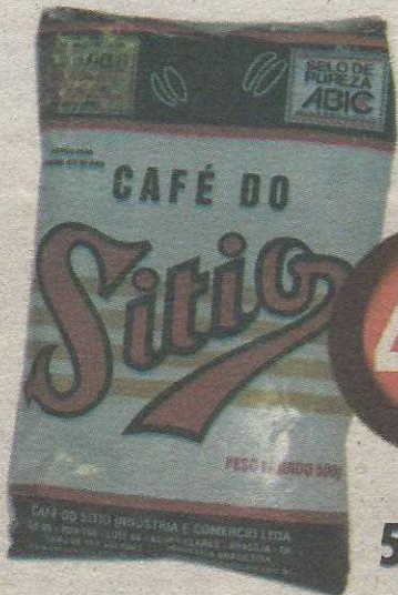
Café do Sítio 500g embalado