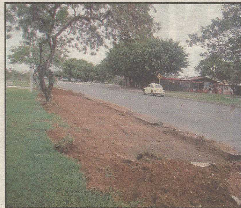
Obras aumentam segurança para quem vai retornar