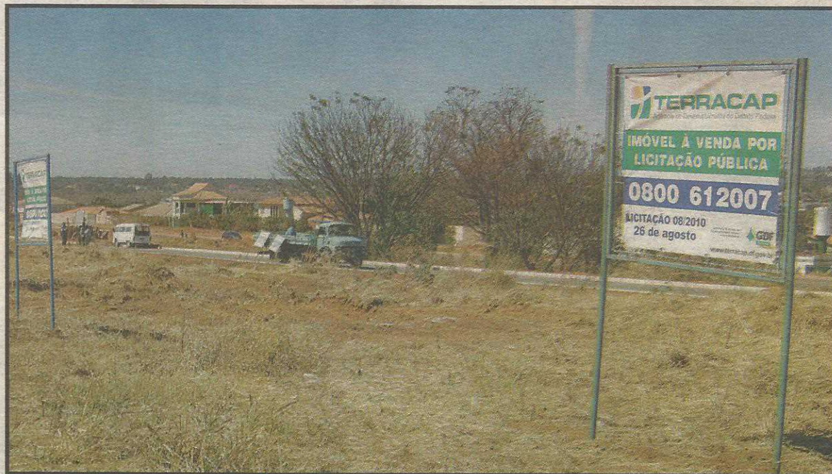
Area já conta com a infraestrutura montada para receber os novos moradores