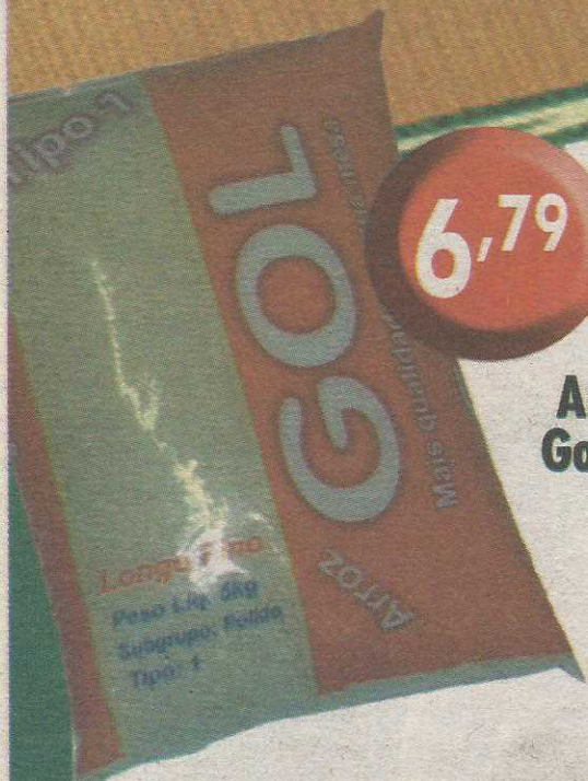
Arroz Gol 5kg