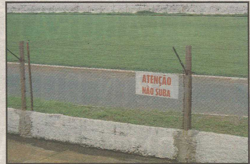
Troca do mureão será suficiente para liberar estádio em 2010