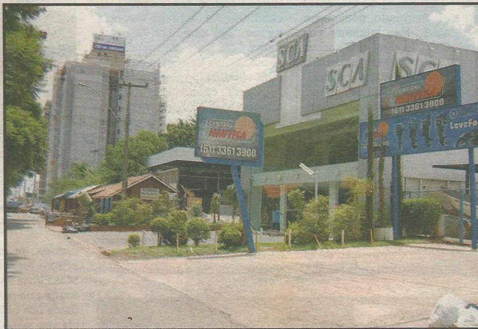
Doze empresas fizeram grandes investimentos, mesmo sabendo que a ocupação era provisória