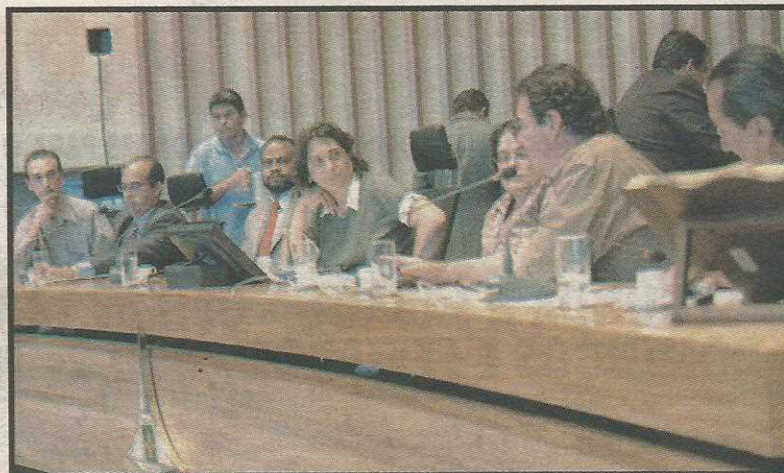
Audiência pública reuniu as partes interessadas em busca de uma solução