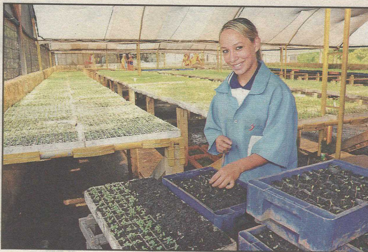
Todas as plantas que abastecem as áreas verdes são produzidas no viveiro

Para ajudar no trabalho de separação e plantio das mudas, a Novacap conta com a ajuda de 90 servidores, 330 menores aprendizes – que estudam em escolas públicas do DF –, além de 50 pessoas portadoras de deficiência que atuam nos viveiros há um ano. “Além das atividades de produção, os adolescentes participam de atividades didáticas