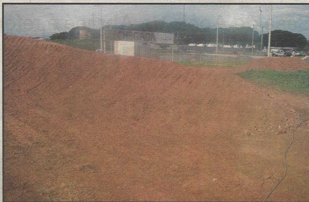
Cidade vai poder receber eventos internacionais

Cronistas Esportivos (encontro de confraternização que anualmente marca o encerramento das atividades do futebol candango) será no Guará, no dia 10 de dezembro, no estádio do Cave ou nas instalações do Lions Clube. O ingresso será 1 quilo de alimento não perecível, que será encaminhado a uma instituição de caráter filantrópico (e que dará direito, além de assistir os "craques" em ação, a um choppinho ou refrigerante bem gelado). /// APOIADOS por membros da FBF, árbitros, técnicos e alguns dirigentes, os cronistas vetaram o Bezerrão. /// SEGUNDO a revista da ESPN, o técnico Vanderley Luxemburgo tem como paixão, além do futebol, o carteadado. Em algumas oportunidades, já teria perdido até 1 milhão de reais em noitadas na mesa de poker. Pois é... Quem pode, pode. /// COLABORAÇÃO da coluna para a Cartilha do Lula: VOLÁTIL- Avisar ao tio que vai lá. É isso aí!