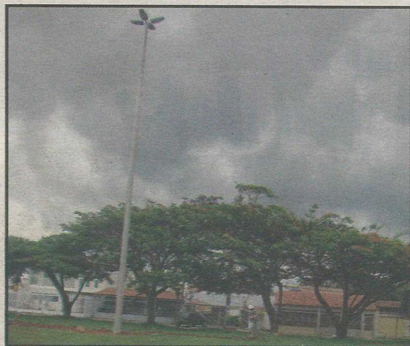
As áreas atendidas eram perigosas durante a noite