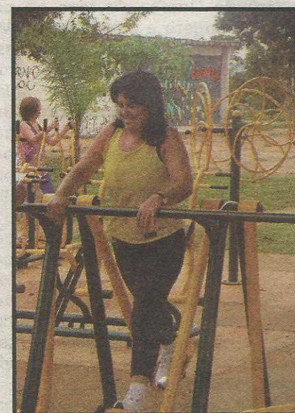
Moradores do Guará I aproveitam a novidade

A QE 2 (em frente ao comércio local) também será contemplada com um novo PEC. Para o ano que vem a novidade é que está prevista a construção de mais quatro PECs no Guará através de emendas parlamentares.