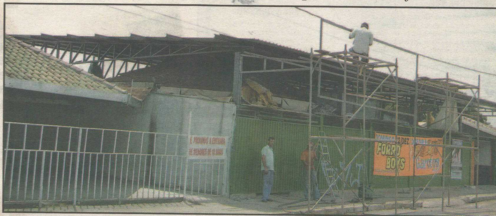
Uma cobertura metálica, sem autorização, cobre cinco quiosques, desfigurando o local

O imbróglio passa pela própria regularização do local. Caracterizado como ocupação de área pública e não quiosques, os estabelecimentos eram tributados diferenciadamente até 2009. Ano em que o GDF perdoou as dívidas de quiosque e similares através da lei 4.420. O débito do Pontão do CAVE, somados todos os estabelecimentos, superava meio milhão de reais. Meses depois, na tentativa de embarcar na regularização dos quiosques proposta pelo ex-governador José Roberto Arruda, os proprietários do Pontão do Cave acordaram em ser enquadrados como quiosques. Porém,