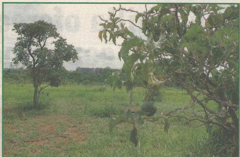
'Projeto prevê a recuperação da flora e a construção de equipamentos de lazer e cultura