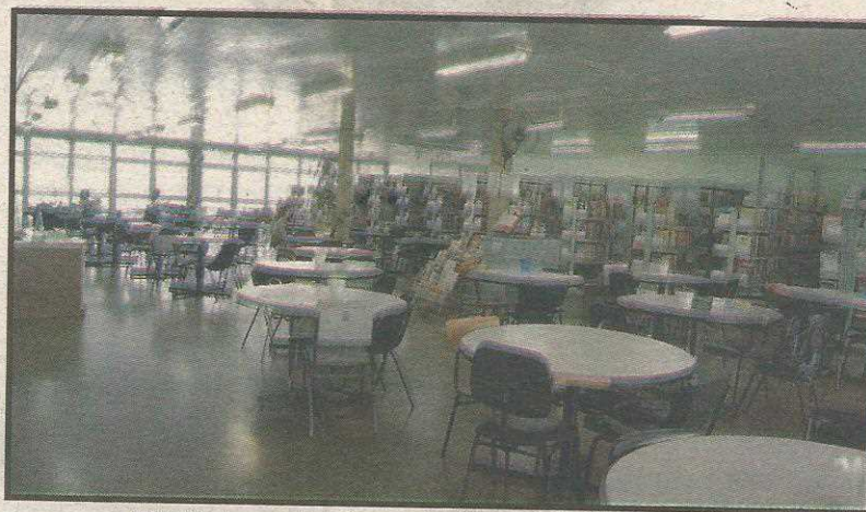
Biblioteca do Centrão é a maior do Guará, mas só vai funcionar durante o dia

O Guará tem apenas uma biblioteca pública, dentro da Casa da Cultura, pequena e com pouco mais de 20 lugares para estudo.