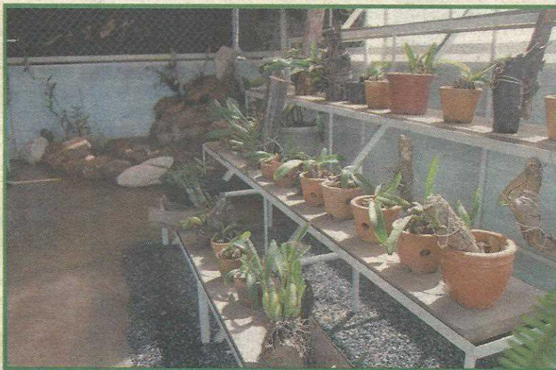
Orquidário cataloga e recupera mudas nativas