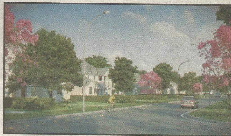
Empreendimento privilegia o conforto e o contato com a natureza