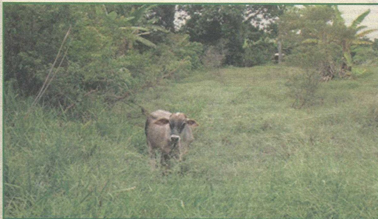
Atividades agropecuárias terão que deixar o Parque