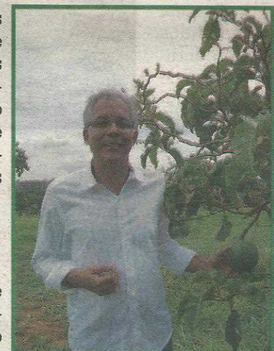
Presidente do Ibram, Gustavo Souto Maior, critica falta de recursos