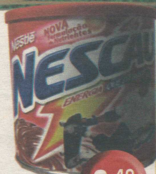
Achocolatado Nescau 400g