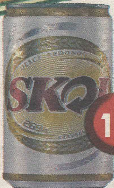
Cerveja Skol lata 269 ML BEBA COM MODERAÇÃO