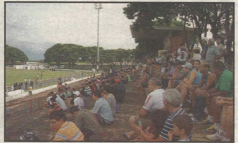
Novamente, o Cave volta a ter a melhor média de público do Candangão

ganhou um jogo (contra o Brasília) perdeu um (para o Brasiliense) e empatou dois (Formosa e Gama), volta a jogar no Cave no dia 29 de janeiro, neste sábado, contra o Ceilândia, e de-