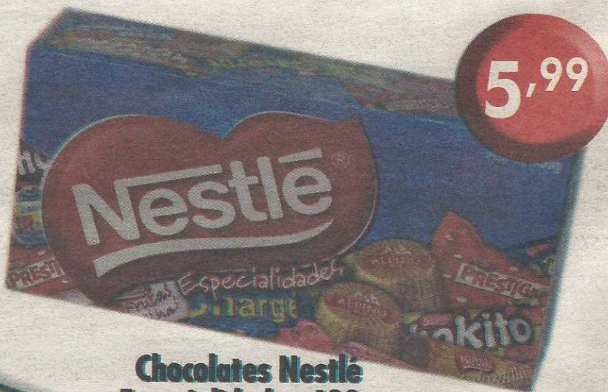
Chocolates Nestlé Especialidades 400g