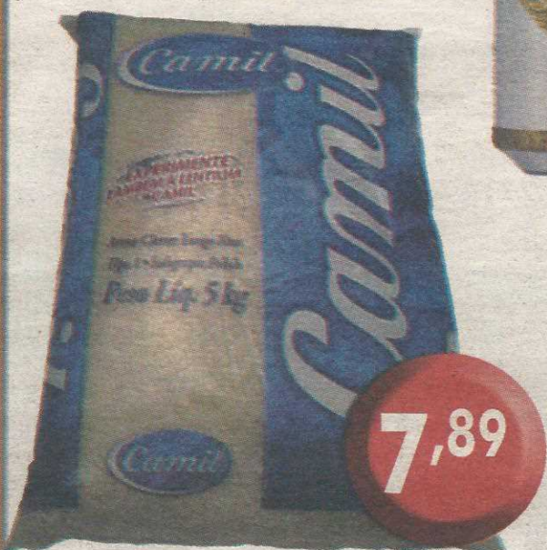
Arroz Camil 5kg