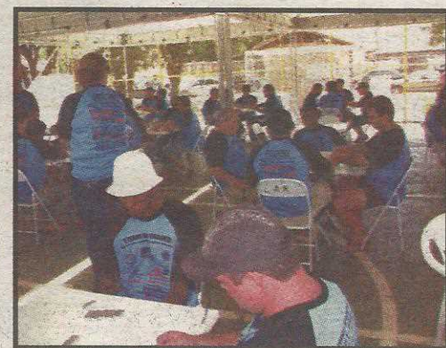
Torneios promovidos na QE 30 são os mais concorridos do DF