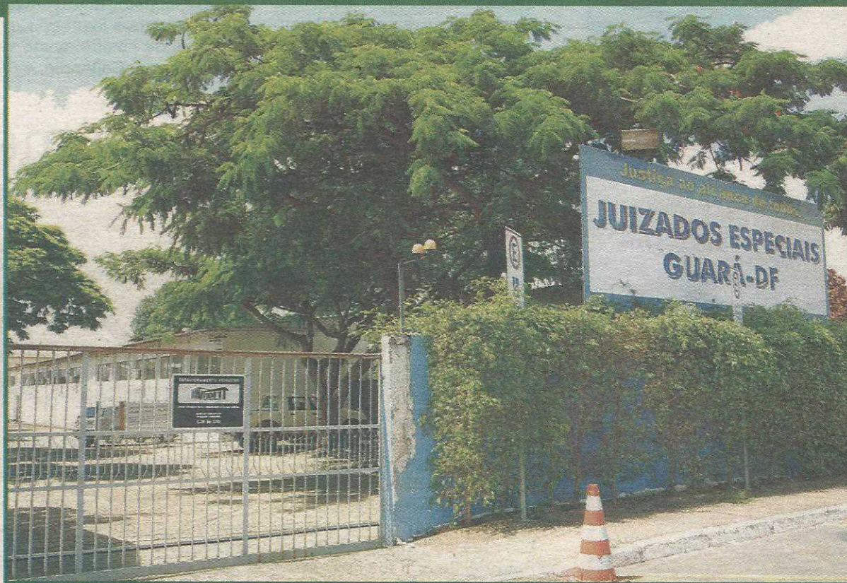
Juizado de Pequenas Causas funciona em prédio improvisado no Guarará II

Junto com a construção dos fóruns, o presidente do