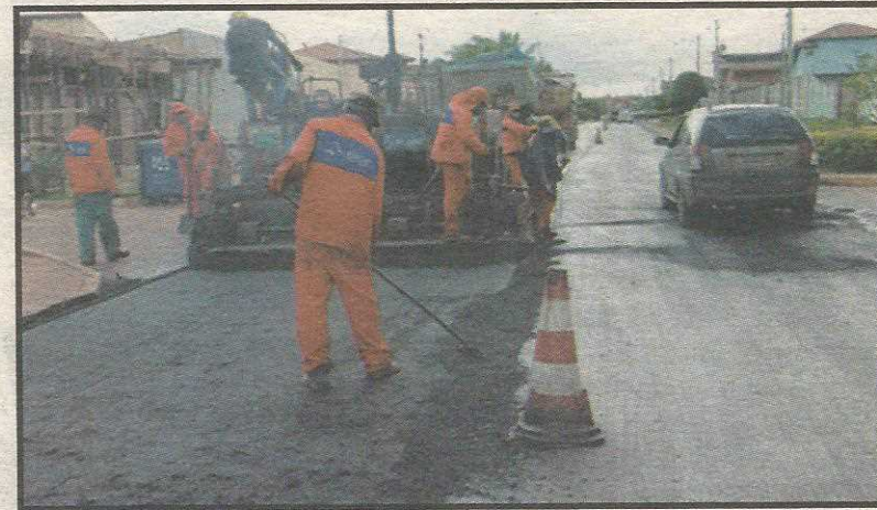
Força tarefa também recupera o asfalto

Na região de Vicente Pires, duas patrulhas mecanizadas – cada uma composta de 6 caminhões, uma patrol, uma pá mecânica, um trator grande, um rolo