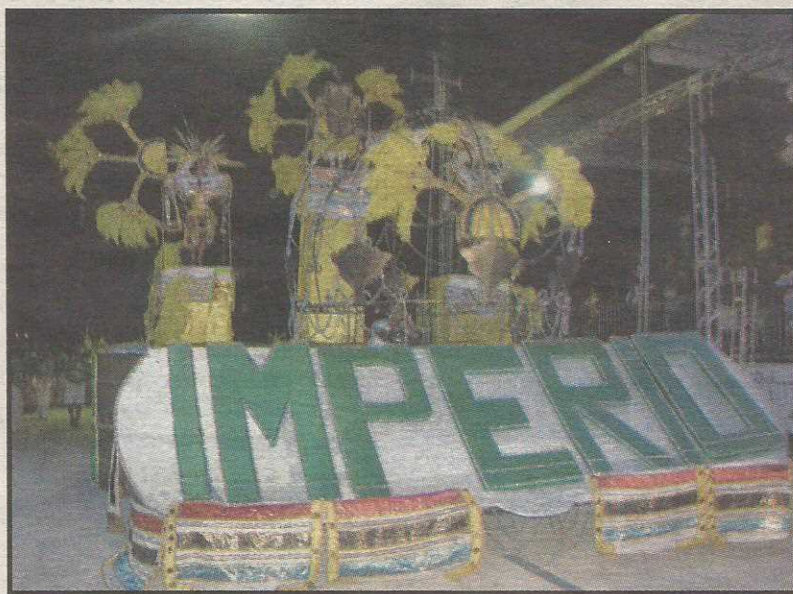
Império do Guará tenta subir mais uma vez

ZOOLOGICO: O zoológico fica fechado apenas na quarta-feira de cinzas. O horário de funcionamento é de 9h às 17 e o ingresso custa R$ 2. Crianças não pagam.