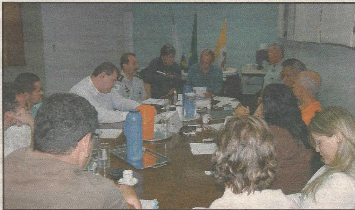
Todos os setores envolvidos com a segurança participaram da reunião