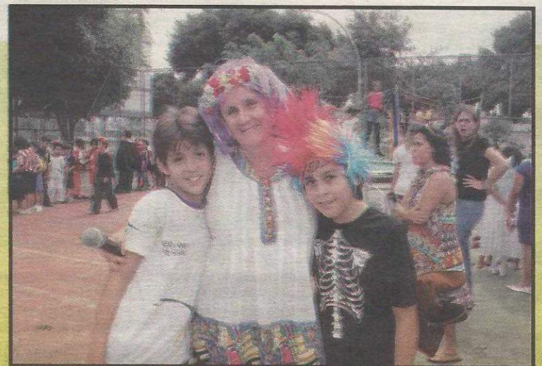
Professores, pais e alunos comemoram aniversário

nos (capacidade máxima), na Educação Infantil (1ª a 4ª séries) e Ensino Fundamental até 10 anos, a escola pretende oferecer também o ensino integral (quando os alunos permanecem em atividades além do currículo normal com atividades esportivas e culturais). Mas ainda falta um refeitório e outros equipamentos, de acordo com a vice-diretora.