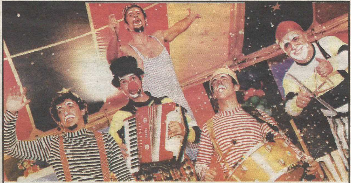
A trupe de palhaços da Cia Artetude vai acompanhar o bloco durante todo o fim de semana

Concentração às 14h em frente à Administração do Guará, próximo à feira.