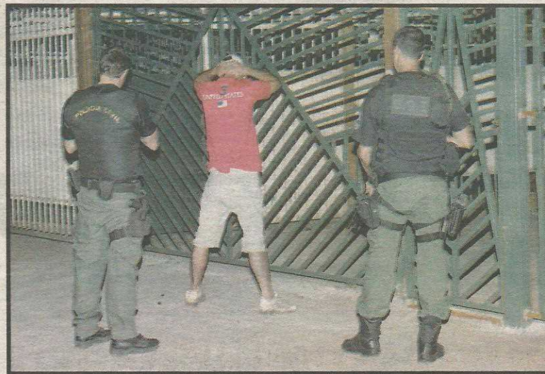
Operações reduziram ocorrências no Guará