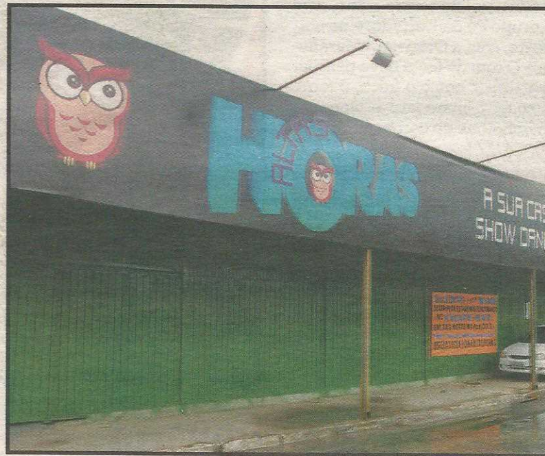
Deveriam ser quiosques, mais há anos funcionam como movimentadas casas noturnas