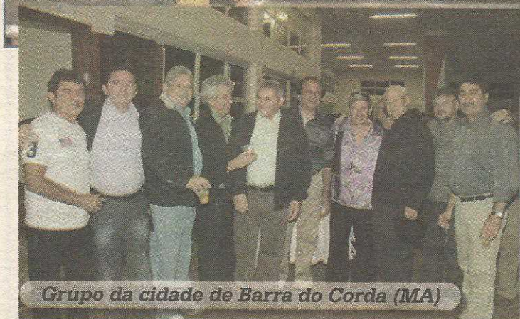
Grupo da cidade de Barra do Corda (MA)