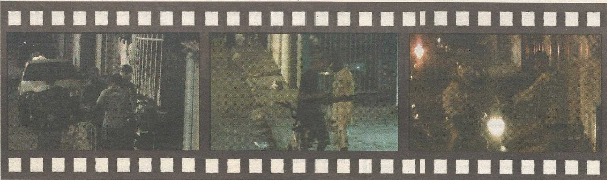
A venda de drogas foi filmada durante 15 dias nos pontos identificados pela polícia