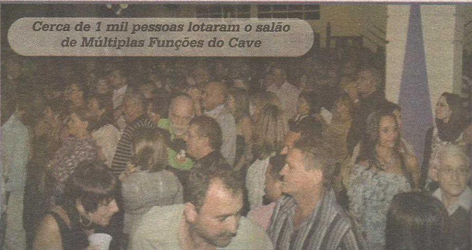
Cerca de 1 mil pessoas lotaram o salão de Múltiplas Funções do Cave