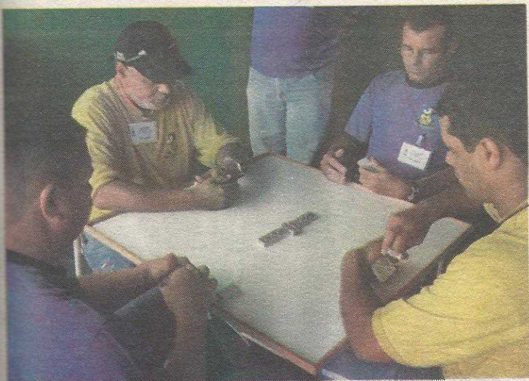
Jogo é cada mais popular na cidade