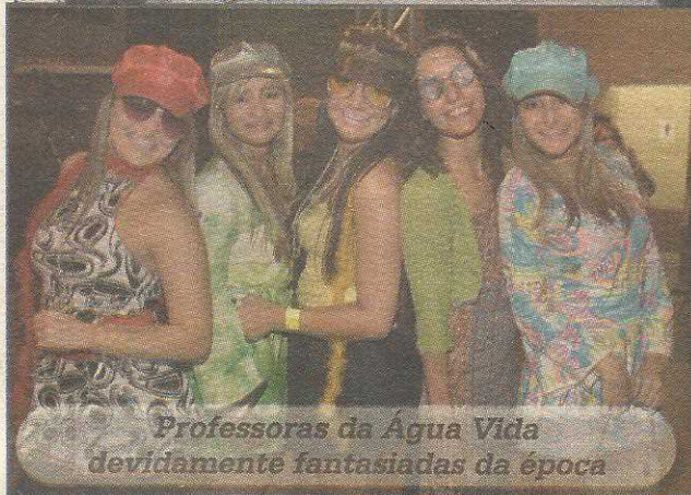
Professoras da Água Vida devidamente fantasiadas da época