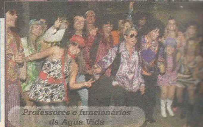
Professores e funcionários da Água Vida