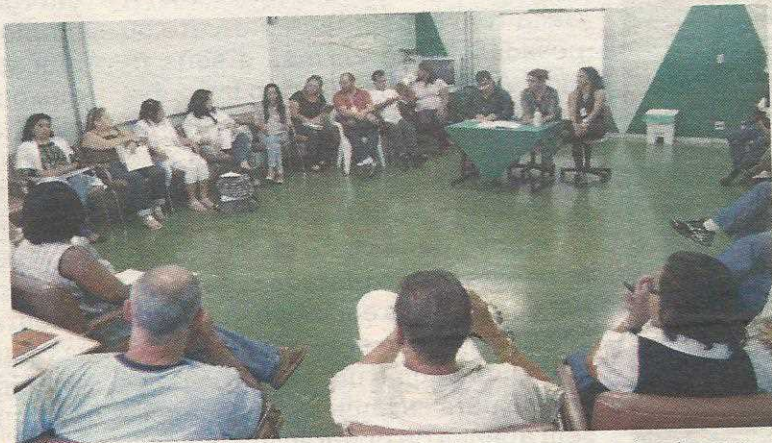
Líderes comunitários ligados à Junpag protestaram contra o que eles consideram de continuísmo

A divisão de posicionamentos ficou visível em vários momentos da reunião. De um lado, alguns integrantes do Conselho, indicados em sua maioria pela