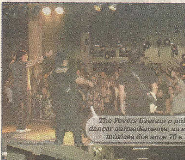
The Fevers fizeram o público dançar animadamente, ao som das músicas dos anos 70 e 80

A animação tomou conta do salão do Cave - a pista de dança foi insuficiente para tanta gente. O clima de confraternização por quem não se via há muito tempo era visível. O serviço de bar esava ágil. A festa, que já é tradição, é, sem dúvida, a mais animada do Guará.