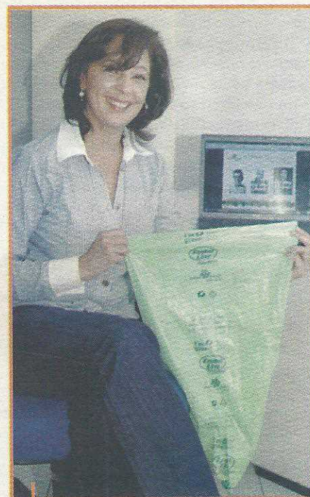
Sacolas identificando o tipo do lixo serão entregues aos moradores

Coleta definitiva Essa campanha é temporária, mas