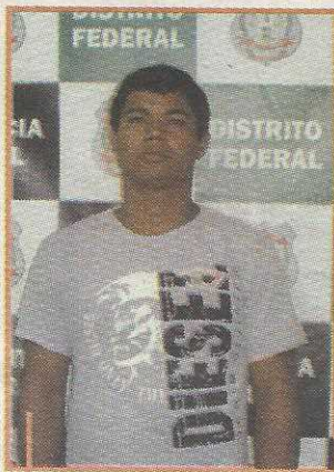
Denúncia anônima levou polícia ao traficante