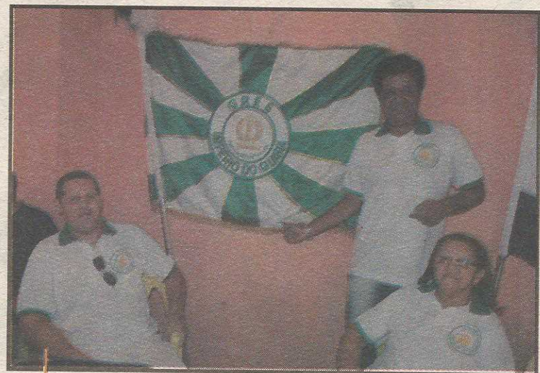
Rebaixada no ano passado e com nova diretoria, escola planeja seu carnaval com antecedência

Após o desfile deste ano, com o enredo homenageando a própria cidade, uma nova diretoria foi eleita. E uma nova vontade nasceu na escola. Segundo o presidente da agremi-