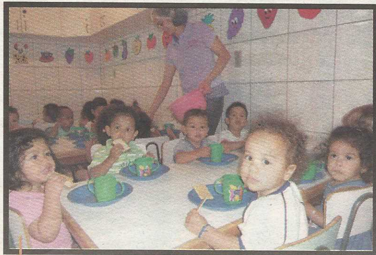
São atendidas 65 crianças carentes, de 1 a 3 anos

Quem desejar colaborar com a creche pode contribuir com alimentos, roupas e brinquedos.