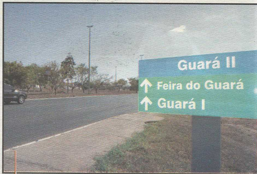
Acessos ao Guará passarão a ter identidade visual com as novas esculturas