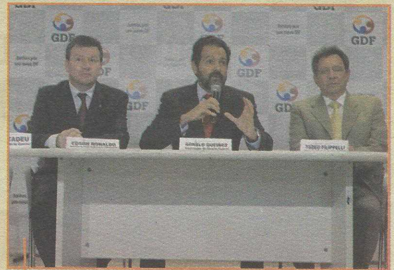
Agnelo propõe a valorização da sociedade na elaboração das políticas públicas

Elaborado com coordenação da Secretaria de Planejamento e Orçamento (Seplan), o PPA do próximo quadriênio aponta as prioridades escolhidas pelo governo e pactuadas com a população, a partir de debates e audiência pú-