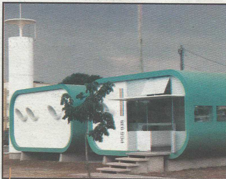
O maior deles, o posto comunitário de segurança da OE 7, aumentou a segurança para os comerciantes