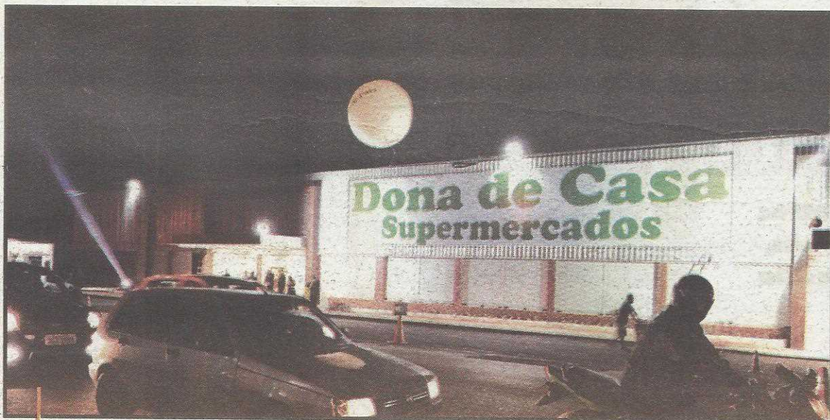
Nova loja fica na avenida Samdu Norte, numa região carente de atendimento de qualidade. O espaço permitiu maior conforto ao cliente