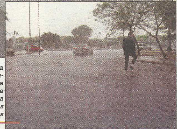
Chuva forte da semana passada mostrou que a QE 7 precisa melhorar a drenagem das águas