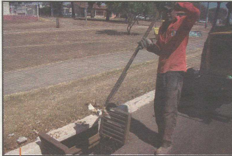
Riscos de alagamento são menores este ano, garante Administração do Guará