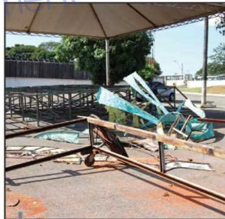
Fantasias estão sendo confeccionadas no Salão de Múltiplas Funções do Cave e na casa do presidente

em 1988 como Império do Cerrado. A estreia aconteceu no carnaval de 1989, quando ficou em 6º lugar. Em 1990, a escola ficou em 4º lugar.