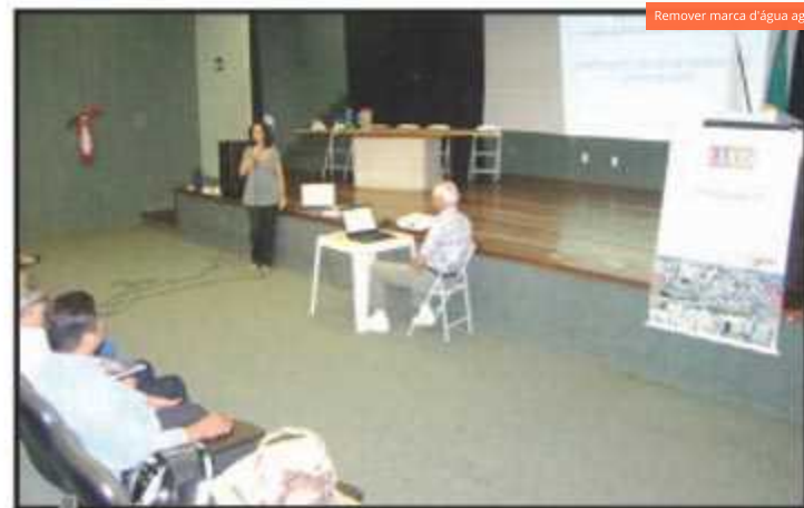
Técnicos da Secretaria de Habitação e lideranças comunitárias se reuniram nesta quarta-feira para iniciar as discussões

Até o fim de fevereiro, os técnicos organizarão novos encontros para levar à comunidade o resultado das últimas conferências. Essas reuniões serão essenciais para a elaboração do texto final da Luos do Plano de Preservação do Conjunto Urbanístico de Brasília.