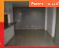
RUA 08 NORTE THAIS ED CERVANTES SL 2Q/1STE WC/BOX CZ/ARM AS GAR 30312200 CJ1704