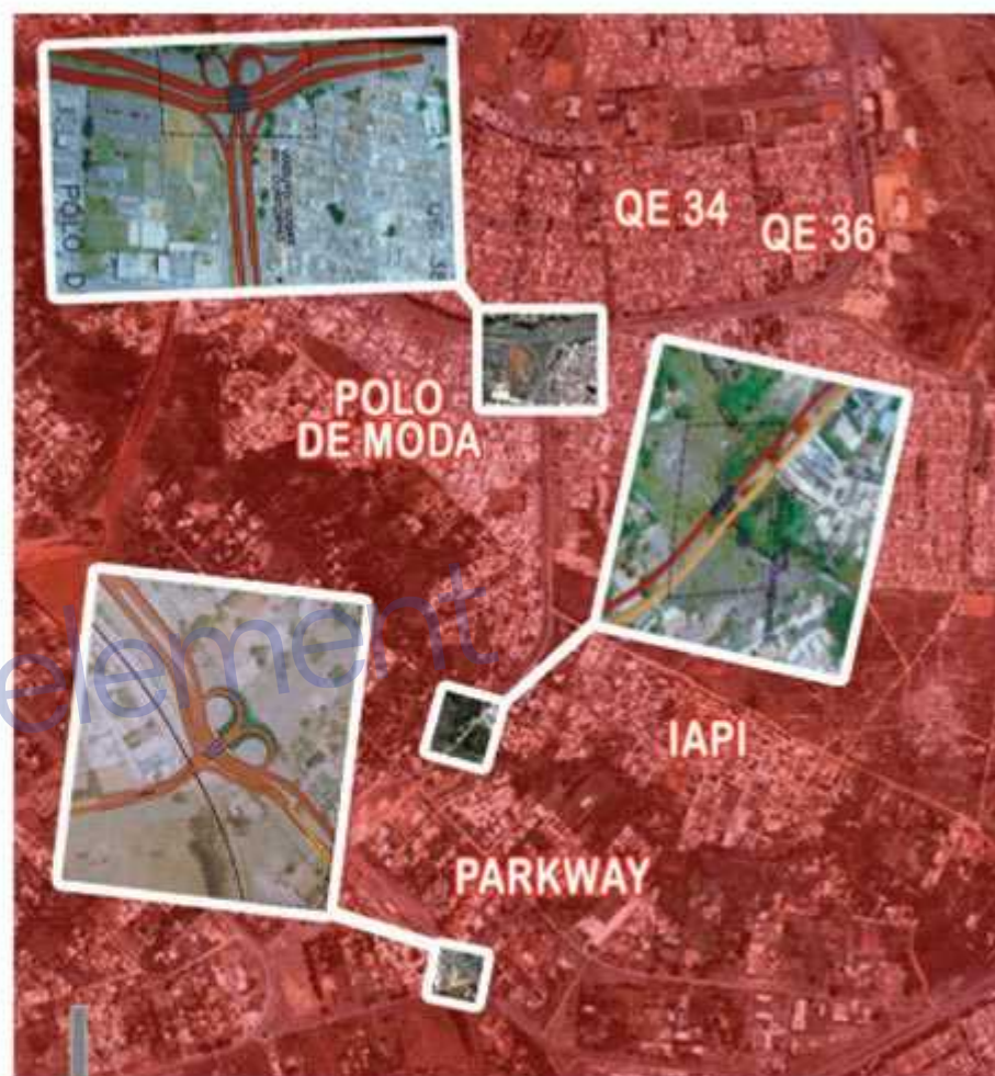
O projeto prevê a construção de três viadutos e o alargamento da via Guarará-NB

"Essas obras são importantes tanto para os moradores do Guarará quanto para os moradores do Park Way e do Núcleo Bandeirante. A passagem para as quadras 3 e 4 beneficiam muita gente, mas temos dificuldades para melhorar o acesso. Como a pista que cruza a linha férrea foi feita sem registro no Detran, não podemos sinalizar a via adequadamente e nem mesmo realizar obras no local" explica. Para ele a solução definitiva não apenas para o trânsito, mas para o escoamento de águas pluviais e para a preservação da natureza ao longo do córrego, é implantar o projeto vi-