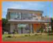
LAGO NORTE - CA 05 ED. OASIS THAIS LJ C/APROX 40M² WC NASC EQ 30312225 CJ1704