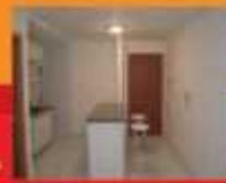
RUA COPAIBA THAIS ED ROSELY GONÇALVES SL 1Q/ARM AS GAR 30312200 CJ1704