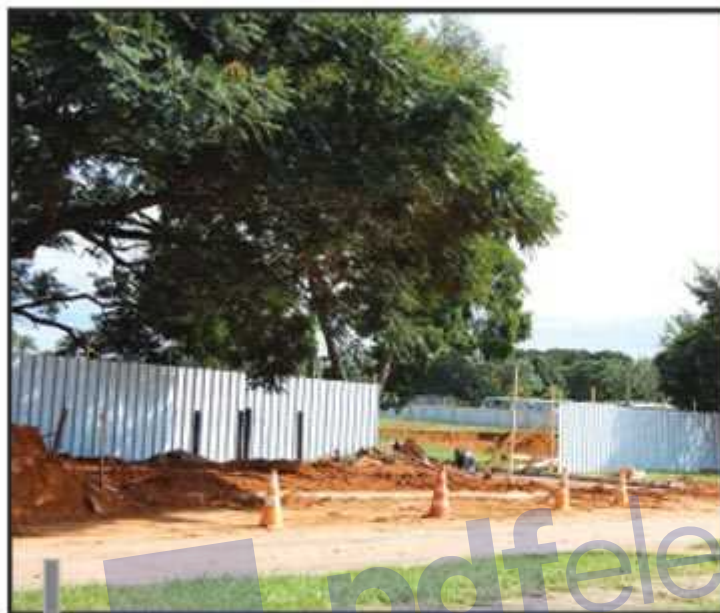
Prédio terá 6.500 metros de área construída

nal do Guará Carlos Nogueira, o fator mais importante na construção do Fórum será a descentralização dos processos e a agilidade da tramitação: "Com isso, os moradores do