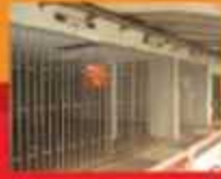
QI 25 THAIS LJ/SUB 2 WC 30312225 CJ1704