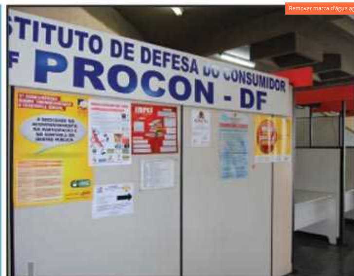
Posto volta a funcionar no mesmo local onde funcionava até 2009

Segundo levantamento da Diretoria de Serviços Públicos da Administração existem cerca de 300 quiosques regularizados no Guará e pelo menos 10% clandestinos.