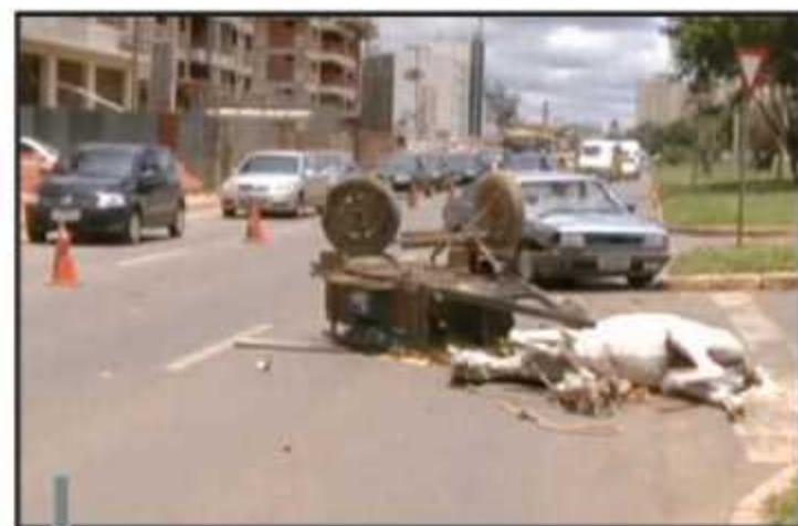
Moradoras jogaram água no animal para aliviar o sofrimento

De acordo com boletim da 4ª Delegacia de Polícia a carroceria teria se chocado com um