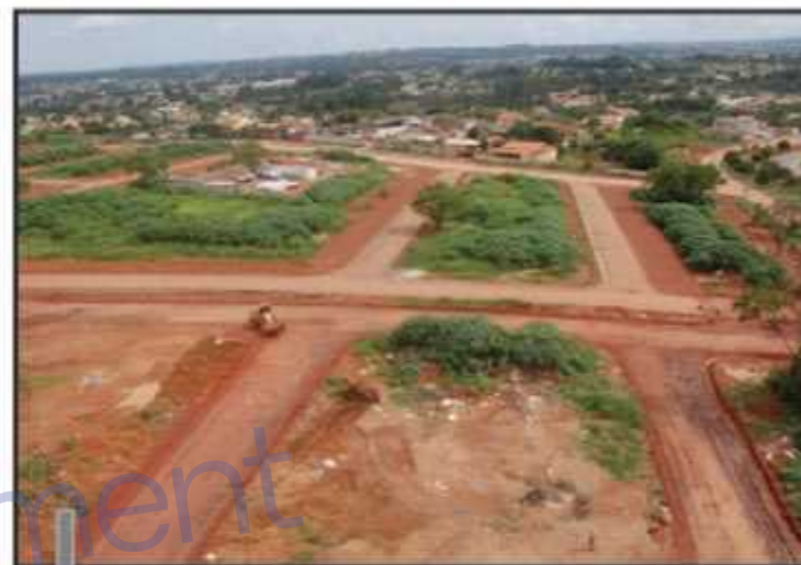
Apenas parte dos serviços estão concluídos na área

do 56 lotes residenciais em agosto de 2010, quando uma ação da Organização das Cooperativas do DF impediu a homologação da licitação e interrompeu as seguintes.