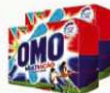
Sabão em Pó OMO Multilação 1 Kg