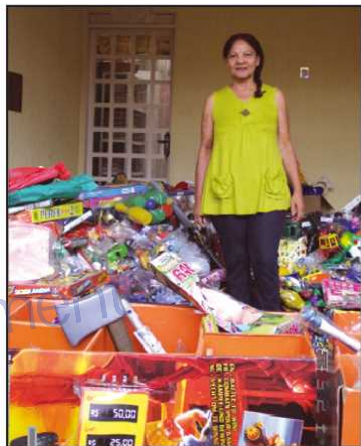
Sara pretende arrecadar no mínimo dois mil brinquedos este ano

Associação do Guará amplia projeto a cada ano