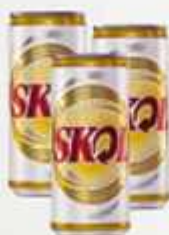
Cerveja Skol 269 ml