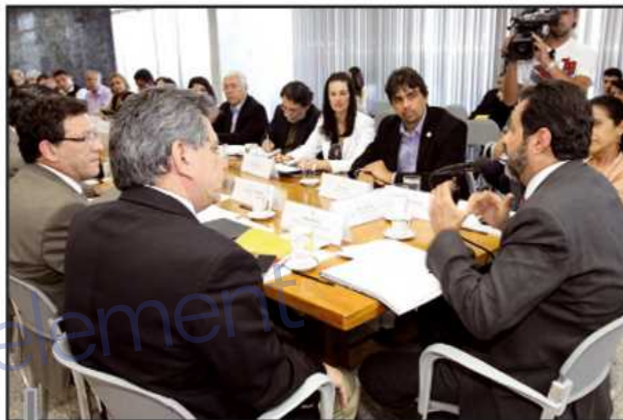
Governador prometeu atender às reivindicações dos administradores