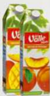
Suco Del Valle Maiz - Sabores 1,5 L