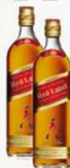
Whisky Johnnie Walker Red Label 1 L