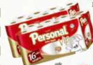
Papel Higiênico Personal Leve 16 e Pague 15 16 rolos