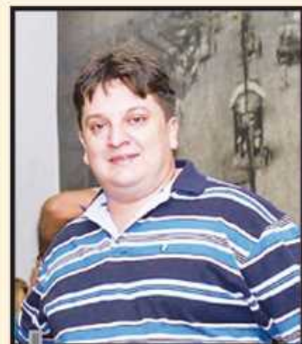
Foi o próprio Wellington que aperfeiçoou o prato

O bar Traira sem Espinha completa dez anos no Guará.