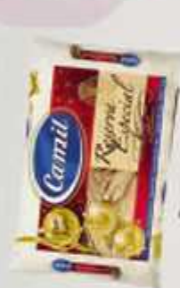
Arroz Camil Reserva Especial 5 Kg