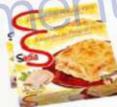
Lasanha Sofria 650 g