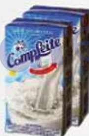
Leite Longo Vida Completo 7 L