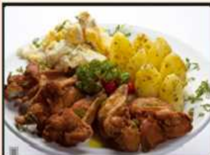
Debaixo da Asa da Mamãe, prato premiado no Roda de Boteco

O empresário comanda ainda mais três empreendimentos, a Boutique da