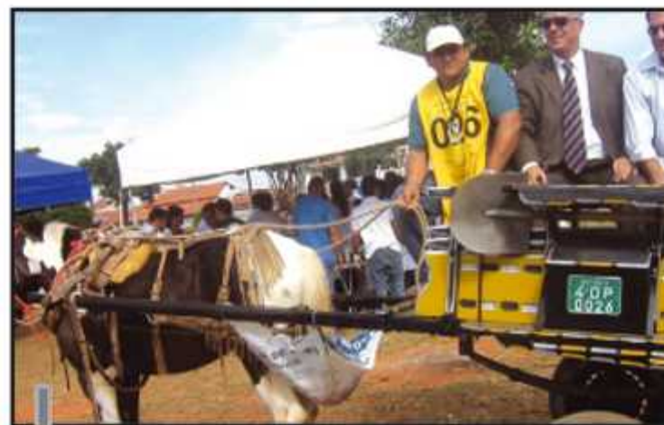
A identificação dos carroceiros e o emplacamento das carroças já foram feitas em outras regiões

O Guará tem três áreas de transbordo, locais onde se é permitida a dispensa de entulho para posterior recolhimento ao aterro sanitário. Uma nas proximidades da QE 18, próximo ao trilho do metrô, outra atrás da pista de motocross, no CAVE e uma atrás do posto de gasolina BR, ao lado do Batalhão de Polícia Militar no Guará II. Para ter acesso a essas áreas, os carroceiros precisam trafegar pela avenida contorno do Guará II, a mais movimentada da cidade.