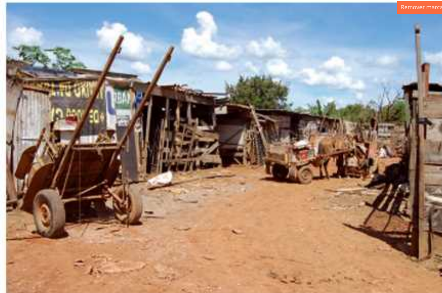
O recolhimento de entulho de obra é a principal atividade dos carroceiros. Curral comunitário protege os animais dos maus tratos