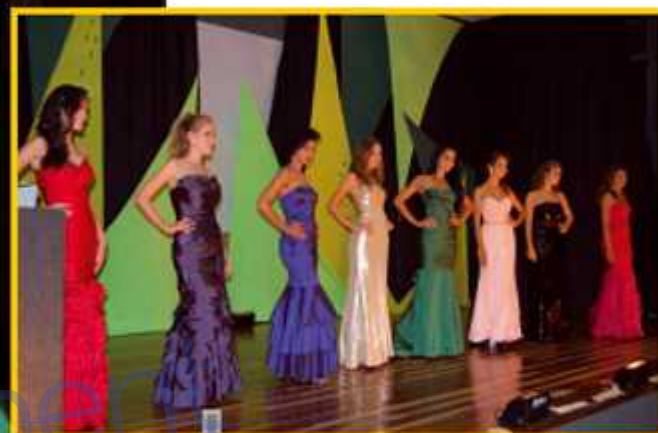
Concurso teve a participação de oito candidatas, pre-selecionadas

A Miss Guará 2012 vai representar a cidade no Miss DF 2012 em maio.