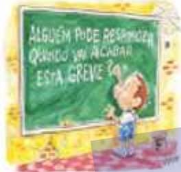
É a greve dos professores continua