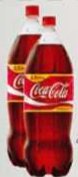
Refrigerante Coca-Cola 2,5 L