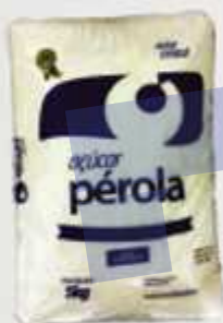
Açúcar Cristal Pérola 5 Kg