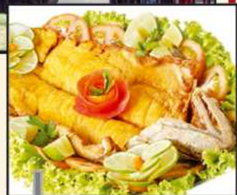
Traira é o carro-chefe da casa e ficou conhecido em todo o DF

Pizza, a Chopperia Cidade Livre e Boteco da Traira. No ano passado a chopperia foi escolhida o melhor bar de Brasília no concurso Roda de Boteco, e um dos garçons do quiosque da Traira Sem Espinha levou o título de segundo melhor garçom do DF, além do prato Debaixo da Asa da Mamãe, considerado o segundo melhor tiragosto do DF.