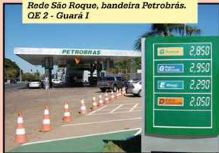
Rede São Roque, bandeira Petrobrás. QE 2 - Guarú I