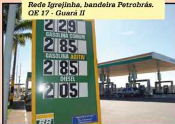
Rede Igrejinha, bandeira Petrobrás. QE 17 - Guarú II