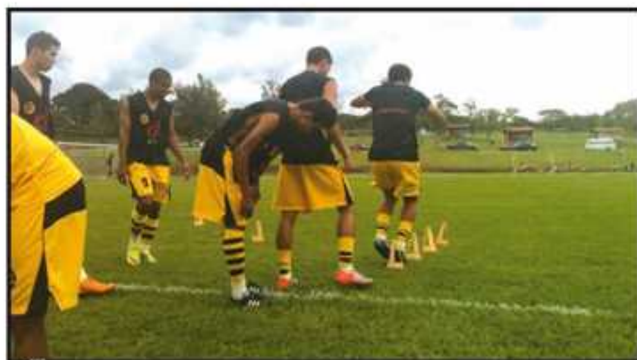
Preparação intensa para fazer bonito na Holanda começou há dois meses

O primeiro jogo do Guaraense será no dia 17 de maio,