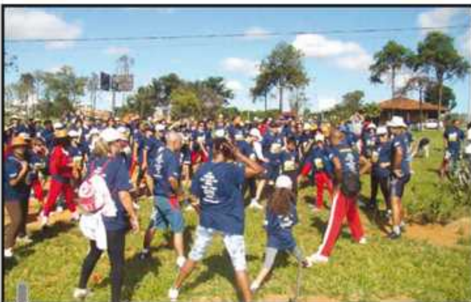
Caminhada chamou a atenção para a situação do parque

Quando chegaram no parque, os participantes plantaram várias mudas de árvores do