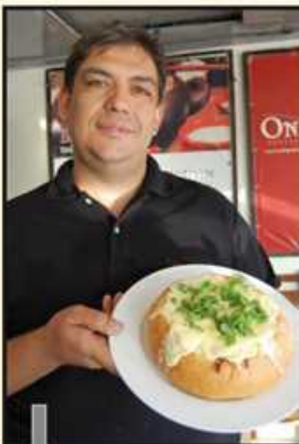
Marconi e o exclusivo Escondidinho no Pão

Para elaborar um cardápio especial e atrair tanta fidelidade - a casa está sempre cheia -