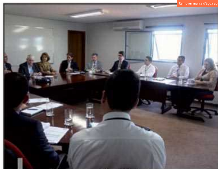
reunião com o conselho do Projeção

Todos os professores da Pós-Projeção são mestres ou doutores. A oferta das especializações é dividida por Escolas de Educação Superior: Negócios (MBA em Gestão de Negócios, MBA em Gestão Financeira e Contábil, MBA em Gestão Estratégica Sustentável); MBA em Inovação em Publicidade e Propaganda; Tecnologia (Segurança da Informação, Gerenciamento em TI, Desenvolvimento de Aplicações Web, Gestão e Governança de Tecnologia da Informação); Ciências Jurídicas e Sociais (Direito Prático Previdenciário, Direito Militar, Advocacia Civil, Advocacia Criminal, Direito dos Contratos, Gestão em Serviço Social); e Formação de Professores (Estudos Afro-Brasileiros, Africanos e Indígenas; Gestão de Processos Acadêmicos; Gestão Escolar, Orientação Educacional, Direito Educacional e Perícia