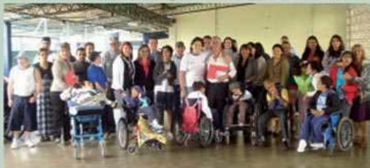
O Centro de Ensino Especial 1 (Guará I) ganhou o aquecimento da sua piscina, doado da empresa Art Sol, do empresário Edmar Silva Simões