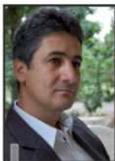
Massom: moradores querem permanecer na Região do Guará