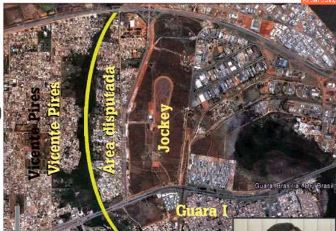
Córrego Vicente Pires separa a área em demanda

A discussão da posse administrativa da área começou na reunião setorial da Conferência das Cidades, coordenada pela Secretaria de Habitação, que definirá as poligonais das regiões administrativas do Distrito Federal. Lá, os dois grupos se mobilizaram para defender o que consideram seus direitos. As conclusões dos debates foram incluídas no PDOT, para serem votadas pelo deputados distritais, quando haverá