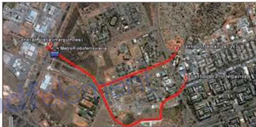
Interbairros resolveria também o problema de transporte no Guará. Projeto está pronto

Para o governador a melhoria da qualidade de vida da população é uma das consequências diretas dos investimentos no transporte público. "Aqui em Brasília, esses projetos vão