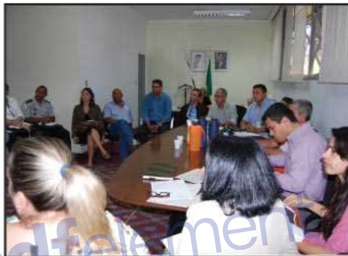
Na primeira reunião, foram apresentadas as dificuldades para resolver o problema. Nova reunião vai propor as soluções.

Segundo o administrador, essa população de rua vem aumentando na cidade, colocando em risco a segurança dos moradores. "Temos relato de casos de constrangimento, ameaça e atentado ao pudor em área pública. Outra preocupação é com o consumo de dro-