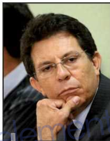
Alírio alega descumprimento de acordo e perseguição pessoal para deixar o partido

"Eu não estou saindo do partido, ele é que está saindo de mim". O deputado alega que a aliança firmada pela governabilidade no GDF sempre esteve mantida. "O partido mudou a linha programática assim como fez no governo do ex-presidente Lula, que alterou sua orientação programática e saiu da base daquele governo. Não podemos assumir