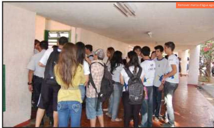
Os alunos foram surpreendidos com a ação policial, mas a escola garante que não houve constrangimento a eles