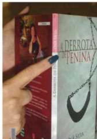
Livro fala sobre a saga das mulheres para resolver seus próprios sentimentos

Além da noite de autógrafos, a autora apresentará outros escritores guaranaenses.