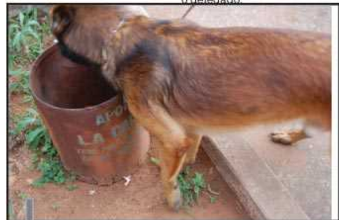
Cães farejadores ajudam na localização das drogas

"Essas operações tem reduzido drasticamente as ocorrências policiais no Guará", conta o delegado.