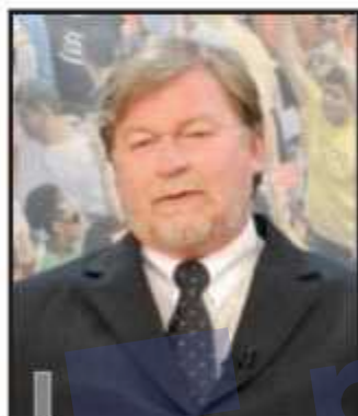
Bessow: nome para o novo estádio do Cave

"Sem querer polemizar acerca do nome, mas é uma questão mais ampla. O atual estádio vai desaparecer. Não será como uma reforma, como no caso do Maracanã, do Beira Rio. Pelo que me consta, a própria