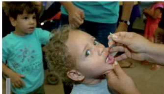
A previs4o 4 de vacinar mais de 200 mil crianç4s no DF

O objetivo da campanha, de acordo com a diretoria de Vigil4ncia Epidemiol4gica da Secretaria de Saude, 4 manter o Brasil na condiç4o de pa4s certificado internacionalmente