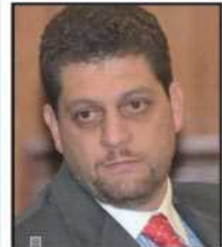
Desvios do ex-deputado Brunelli motivaram o decreto