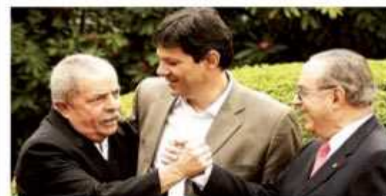
Alguém imaginaria esta cena na vida política brasileira? Os dois extremos de radicalismo: direita e esquerda?

no próximo ano: a redução de despesas com pessoal e com custeio para aumentar os recursos para investimentos, ou melhor, obras. Ou seja, nada de aumento para ninguém.