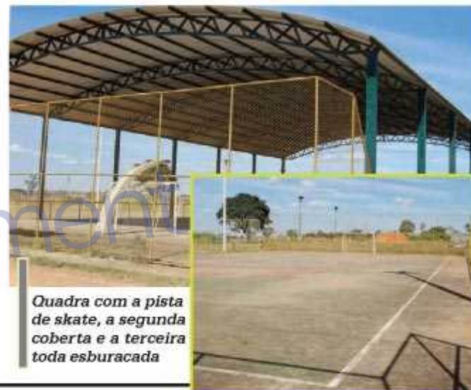
Quadra com a pista de skate, a segunda coberta e a terceira toda esburacada