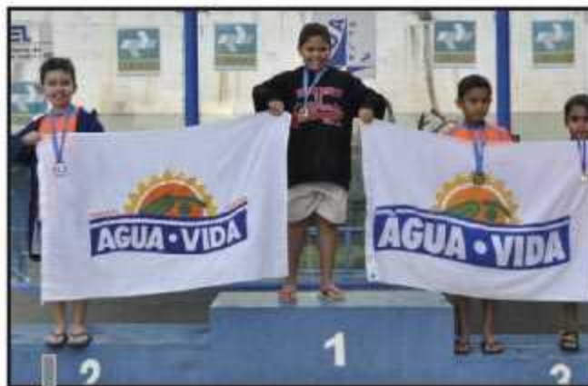
Água Vida revela novos talentos para a natação

Para as próximas etapas, que acontecerão em setembro e dezembro, a Água Vida levará novos atletas e pretende sagrar-se campeã absoluta do DF.