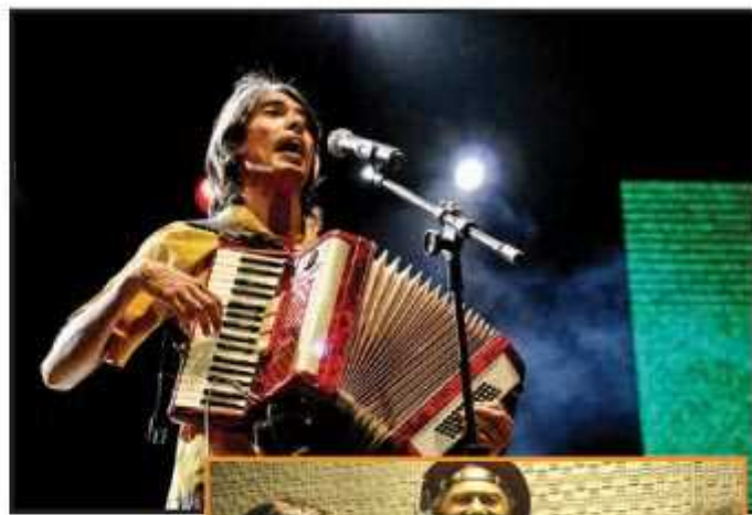
Pé de Cerrado e Trio Siridó, as principais atrações musicais da festa

Tradicionalmente realizada atrás da 4ª Delegacia de Polícia, entre as quadras 15 e 26 do Guará II, neste ano acontece no terreno ao lado, onde também é encenada a crucificação na encenação da Paixão de Cris-