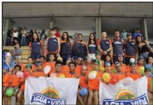
Equipe guaraense lidera o ranking do DF