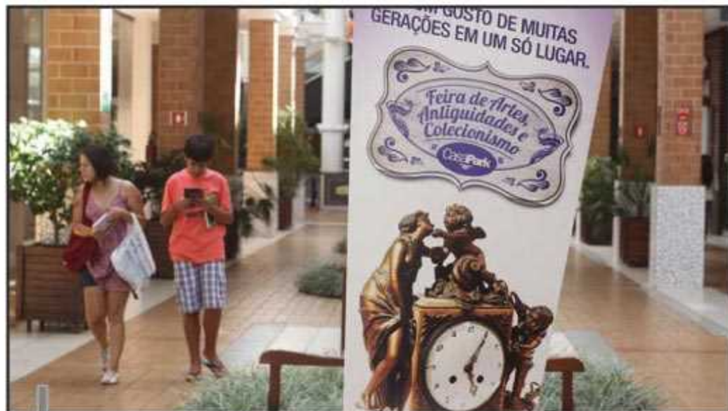
Feira vai mostrar móveis e objetos antigos de decoração