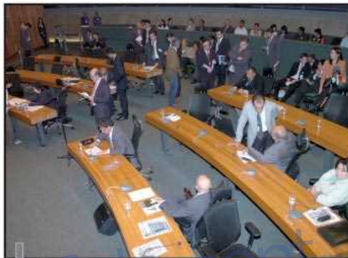
Distritais reclamam do jogo de empurra-empurra do GDF