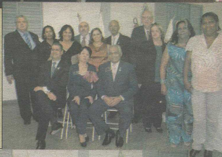
Conselho Diretor do clube para a gestão 2012/2013