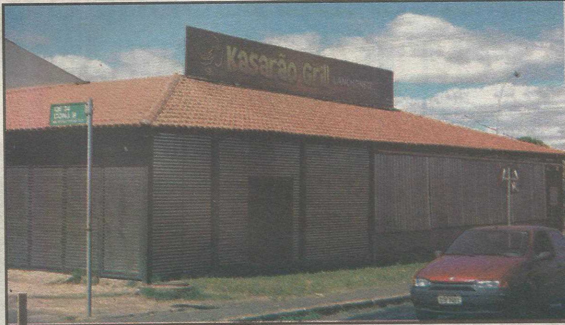
Por causa da burocracia, a liberação de alvarás de construção e de funcionamento demoravam até meses. Agora, apenas alguns dias

De acordo com o Decreto nº 33.734/2012, a Coordenadoria das Cidades passa a ser "instância terminativa para dirimir dúvidas relacionadas à aprovação ou visto de projetos de edificação e ocupação de área pública". Os pareceres técnicos elaborados pela coordenadoria em resposta às consultas das administrações regionais passarão a ter natureza vinculante, ou seja, valerão para casos