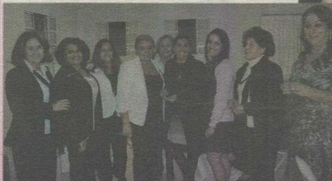
Conselho Diretor da Casa da Amizade