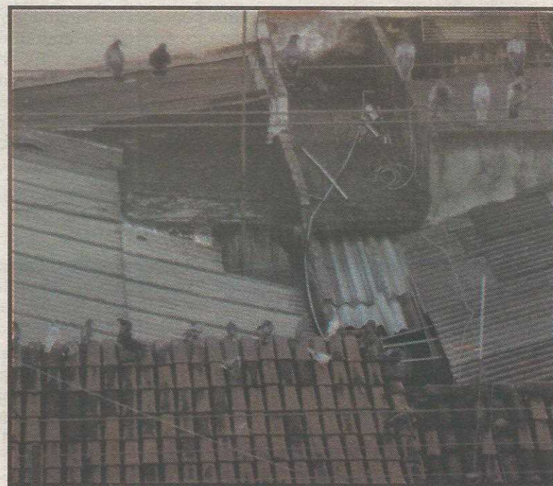
Em busca de comida, os pontos se amontoam no telhado da casa da moradora

Assim, qualquer ação de controle que provoque morte, danos físicos, maus-tratos e apreensão das aves é passível de pena reclusiva e inafiançável de até cinco anos.