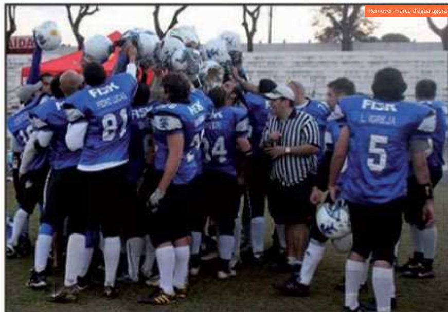
Público médio nos jogos do Tubarões do Cerrado no Cave é de 1 mil torcedores. Clube escolheu o Guará como sua sede e mandar seus jogos