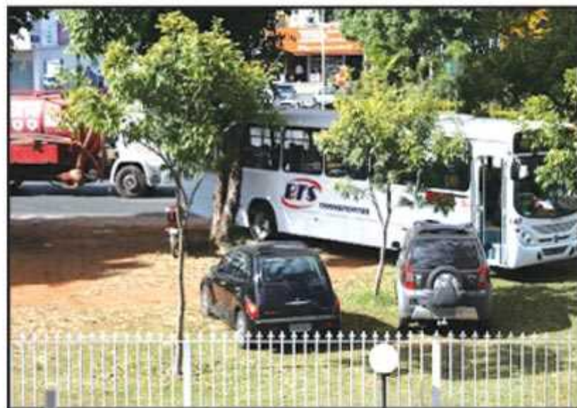
Os moradores fotografaram o abuso durante vários dias e reclamam que as denúncias feitas não foram atendidas