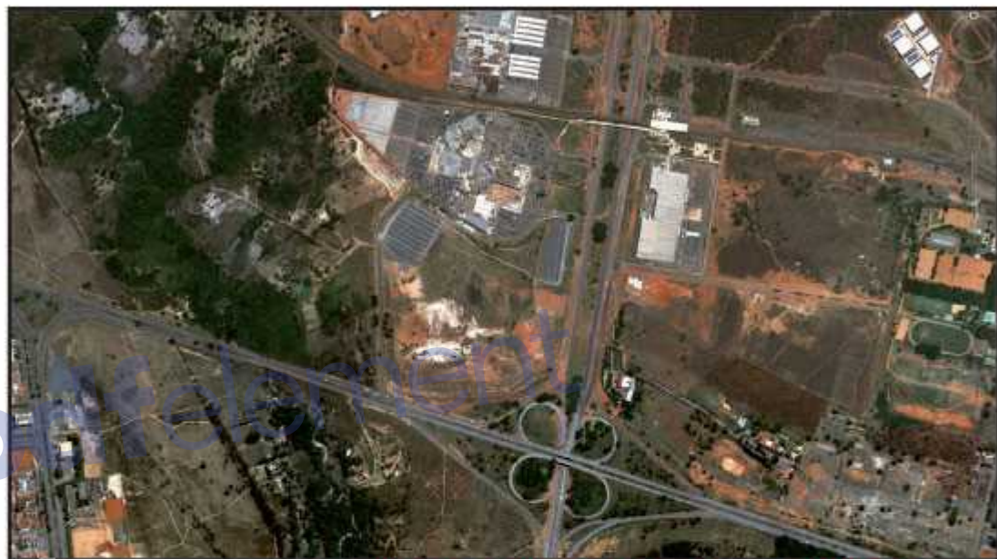
A área que o governo pretende vender é a mesma do antigo projeto do Park Sul.