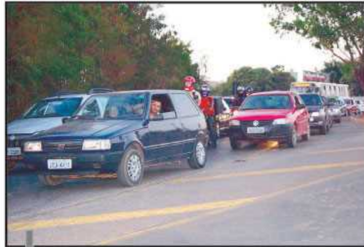
Nem a duplicação da via Guará-Núcleo Bandeirante foi considerada prioridade

A lista de 31 prioridades especiais foi elaborada a partir das 600 ações definidas nas plenárias realizadas nas administrações regionais. A votação