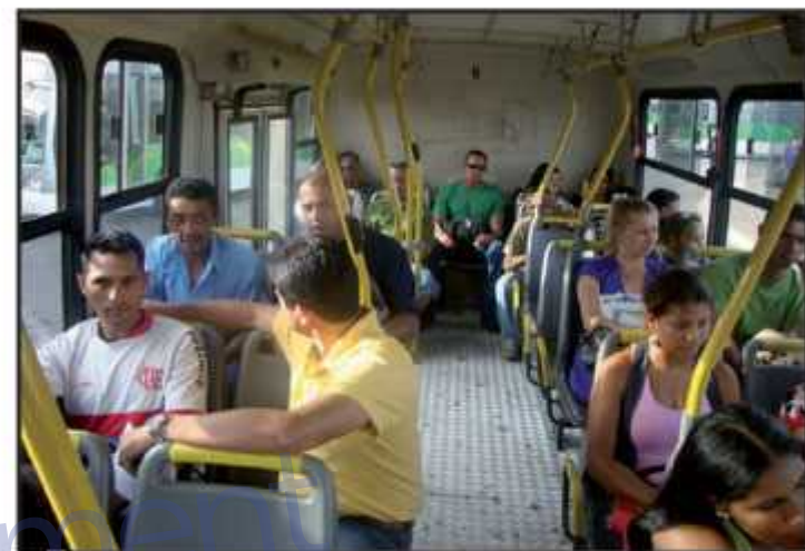
Conselheiros vão poder opinar sobre criação ou mudança de linhas de ônibus

Oficialmente, o Guará é a terceira cidade a receber um comitê, que tem o objetivo de promover debates para aperfeiçoar o planejamento e a execução de novas políticas como a criação de linhas de ônibus, a inclusão de novas empresas no