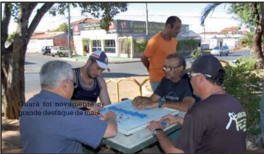
Guará foi novamente o grande destaque de mais