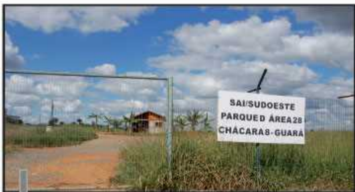
Empresário amigo de petistas tenta garantir direito ao terreno onde seria construído parque aquático