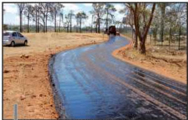
Ecovia fica pronta em duas semanas