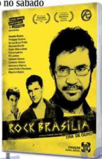
Renato Russo era um dos mais assíduos espectadores do Cinema Voador

Uma história feita de depoimentos reveladores dos grandes protagonistas do período, como Renato Russo (em imagens raras e inéditas), Dado Villa-Lobos, Marcelo Bonfá, Dinho Ouro