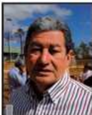
Gilson: até agora, só encaenação

A falta de avanço nas discussões nesta sexta-feira cabe principalmente ao Instituto Brasília Ambiental (Ibram), gestor do parque, que enviou apenas um assessor como representante, que se limitou a