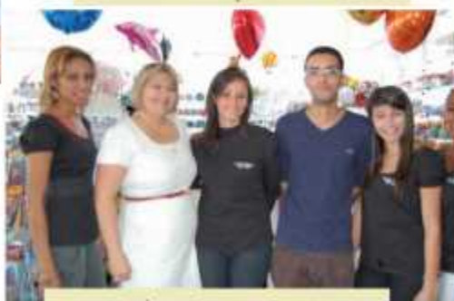
A empresária e a equipe da nova loja