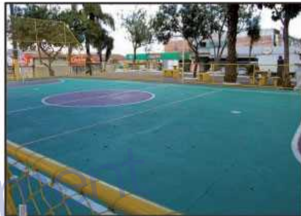
Reforma oferece mais segurança aos praticantes de esportes e às crianças que utilizam os equipamentos

"Uma revitalização como esta é ótima porque as pessoas que ameaçam a comunidade saiam da praça com a presença crescente dos moradores. E para o comércio é muito bom, pois com aumento do fluxo de pessoas, as vendas também crescem", comemora o comerciante. Outra iniciativa para os moradores da quadra acontecerá nas noites de sexta-feira (24), sábado (25) e domingo (26). O Cinema Voador irá exibir filmes para a comunidade. Esta iniciativa reforça a preocupação da Administração e do GDF em garantir o sucesso social e cultural da cidade e também promove a interação na comunidade.