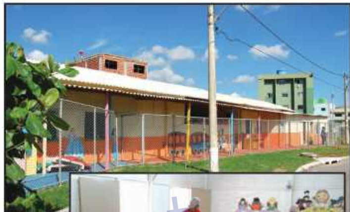
Creche funciona em instalações precárias. Crianças recebem quatro refeições saudáveis por dia

Como o terreno onde está instalada a creche foi cedido pelo governo à paróquia Divino Espírito Santo por concessão de uso, a Administração do Guará está impedida de for-