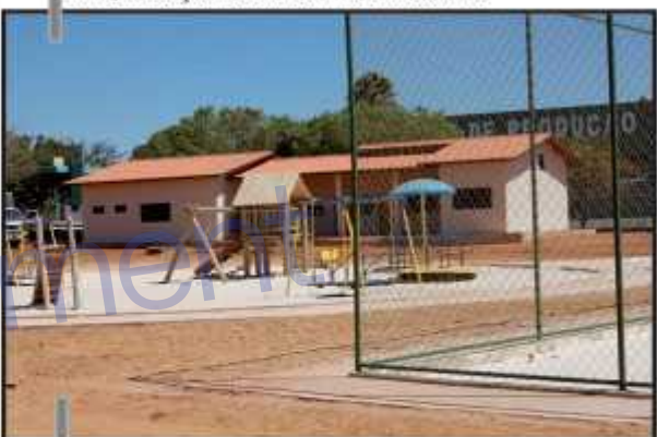
Estão prontos a sede da administração do Parque, um parque infantil e quadra de areia, construídos pela JCGontijo a como compensação ambiental