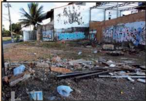
Terrano com obra inacabada h4 nove anos acumula sujeira

est4 completamente abandonada", diz Paulo Aquino Sodre.