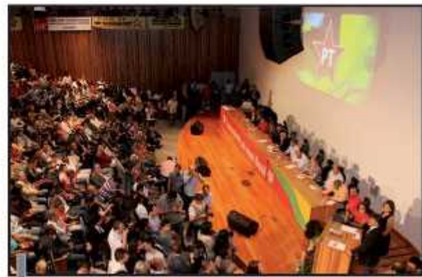
Plenário da Câmara Legislativa ficou lotado para lançamento

Na carta de divulgação, a corrente informa que é “uma tendência aberta, sem centralismo democrático ou subordi-