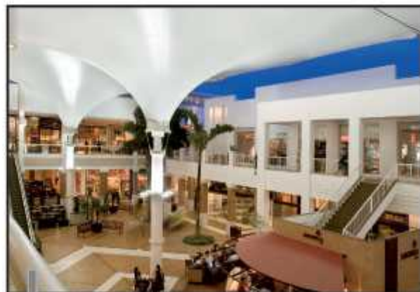
Mix inclui, além das lojas de móveis e decoração, restaurantes, cinemas e livrarias

Além do cinema, o CasaPark abriga a maior livraria do país - a Livraria Cultura - e Galeria Referência, que ocupa 400m 2 de exposição e vendas de obras de arte, telas, esculturas e instalações.