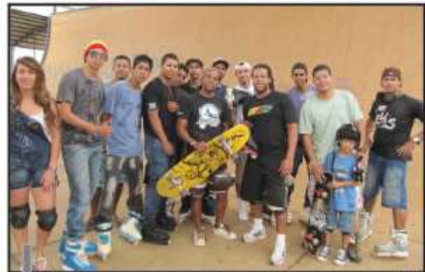
Skatistas garantem que usam a quadra coberta com frequência e querem uma boa convivência com os peladeiros