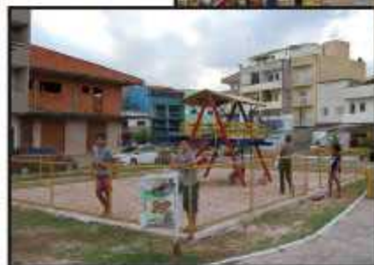
Praça Itajubá receberá o cinema voador no fim de semana