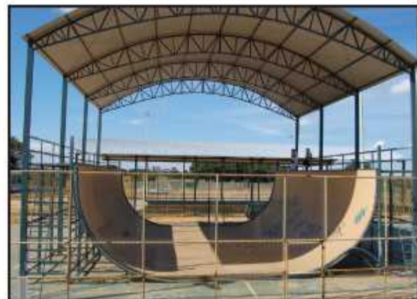
Segundo os peladeiros, a quadra com o halfpipe foi cara e é pouco utilizada pelos skatistas