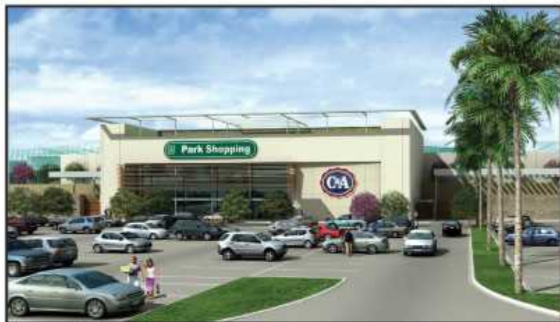
Os novos residenciais do SOF Sul passam para o SIA, mas o ParkShopping fica no Guará