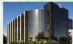
Localizada no Centro Cirúrgico do Guará