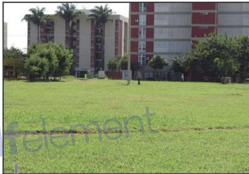
Assassino misterioso envena os cães nas áreas verdes entre as duas quadras

Por se tratar de um produto ilegal, não deve ser usado em nenhuma circunstância. Os sintomas típicos de intoxicação por "chumbinho" são as manifestações de síndrome colinérgica e ocorrem em geral em menos de 1h após a ingestão, incluindo