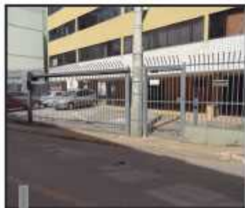
Sem abrigo, moradores sofrem com o sol e a chuva

EM FRENTE À QE 42, AO LADO DO POSTO BR - GUARÁ II