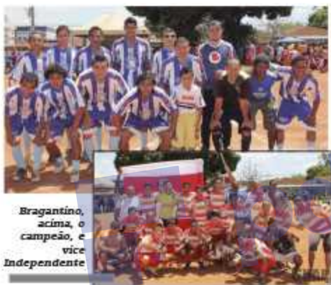
Bragantino, acima, o campeão, e vice Independente