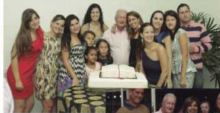
O aniversariante ladeado pelos netos, destaque para grande e belo time feminino