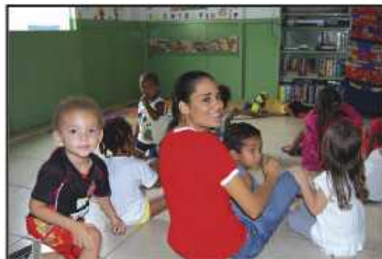
A creche funciona em instalações improvisadas e não há espaço para recreação

Para a supervisora socioeducativa da Instituição, Deni-