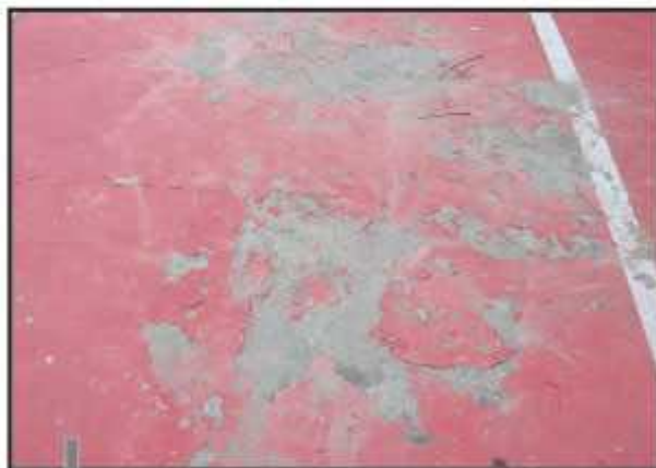
Pintura das quadras soltou-se dois dias depois de ser aplicada