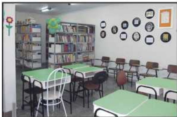
Espaço oferece ambiente próprio para pesquisa e leitura. Parceiros do Rotary e da Administração viabilizaram o projeto

O ambiente calmo e tranquilo é essencial para o estudo e leitura. "As pessoas precisam ter contato com livros, pois diante de toda essa tecnologia a magia e encanto dos livros fi-