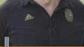
Joubert: iniciativa para unir os moradores

valho, 47, filho de um dos pioneiros, é um dos que mais zela pelo local, reconhecendo nele um fator de união entre todos os que frequentam o local e, até mesmo, de afastamento da criminalidade. Para ele, a prioridade hoje é a substituição do campo de grama existente, herança dos primeiros tempos de futebol organizado na cidade, por um de grama sintética e a reforma da quadra de esportes existente, além de