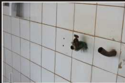
Torneiras quebradas e corrimão empenado colocam os usuários em risco