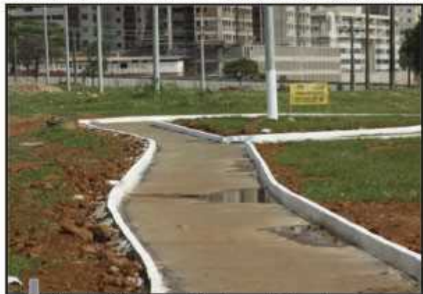
Pista de ciclovia e caminhada construída pelo governo no Guará I: aproveitamento do espaço que ainda resta

O que se busca, então, é aliar o desenvolvimento e a expansão da cidade, inevitáveis diante de uma realidade sócio-econômica que não é exclusiva do Guará, com a manutenção de uma qualidade de vida que sempre marcou a vida dos guaranaenses, gerando um conceito semelhante ao que norteou o projeto das "Unidades de Vizinhança", hubs localizados nas entrequadras do Plano Piloto, destinados a atender aos moradores e congregar vizinhos. E agora, esse mesmo conceito parece ser imperativo para nossa cidade. A preservação das praças e equipamentos existentes é difícil diante das restrições orçamentárias, mas vem sendo feita. A demanda agora é por uma ampliação do espaço, atendendo a todos que moram, vivem e amam o Guará.