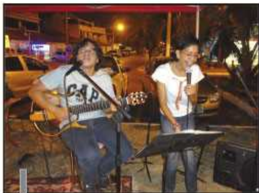
São várias atrações ao longo do calçadão

Em cada ponto, ao longo do caminho, é montada uma tenda onde se apresenta uma atração. Para esta caminhada estão previstas as apresentações do grupo Roupas de