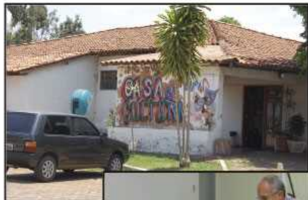
O prédio que era da Casa da Cultura vai abrigar as duas instituições.