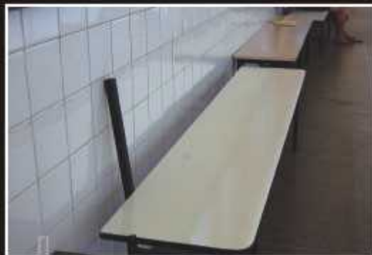
Parte dos assentos para os usuários estão quebrados