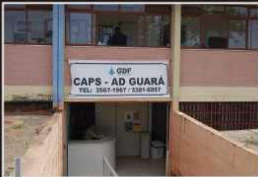
Caps funciona precariamente no subsolo