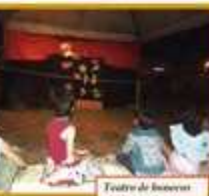
Teatro de bonecos de Jorge Cristo