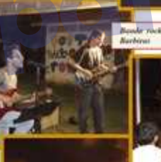
Bandas rock Barbiers