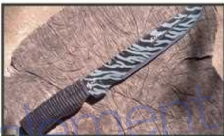
Cabo de ferro e aço será uma das inúmeras atrações da feira

A arte da cerâmica remonta os primórdios da humanidade. As primeiras facadas criadas pelo homem que se tem registro foram feitas na Tailândia e no Etiópia há 2,5 milhões de anos, no período Paleolítico inferior, e eram feitas de pedras lascadas. Por só há pouco tempo, na idade do Bronze (2000 a.C. a 700 a.C.), que o homem aproximou a técnica de produção e passou a usar o bronze. Por volta do ano