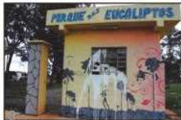
Área serve de moradia de mendigos e para consumo de drogas

O administrador financeiro do atual estado em que se encontra o Parque JK, tras questiona que a Administração possui poder fazer para recuperá-lo. Segundo ele, o compromisso legal para cuidar do parque é do Instituto Brasília Ambiental (Ibram), que é responsá-