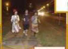
Palhaços divertem presentes de caminhada