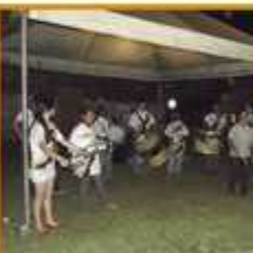
Aluno de coral dos Gigantes de Cerrado