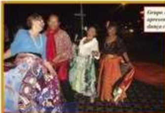
Grupo cênico Anax com apresentação de dança regional