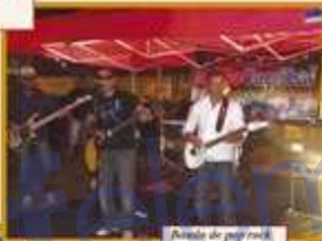
Bandas de pop rock Sólito Capital