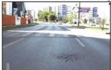
Após a conclusão da reforma da via central, será a vez de