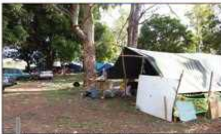
■ O grupo de 15 famílias sobrevive da venda de produtos artesanais e da “venda” de carros usados

O DF Sem Miséria também prevê ações de incentivo como: redução de tarifas, elevação do nível de escolaridade, acesso aos serviços de saúde, política habitacional, educação, cultura, esporte e lazer, e finalidades de projetos sociais em famílias e comunidades pobres em áreas rurais e urbanas.