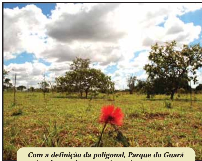
Com a definição da poligonal, Parque do Guará vai poder receber novos investimentos

O debate é aberto e todos estão convidados a participar