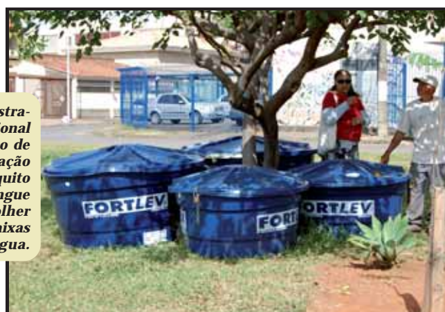
Administração Regional alega risco de proliferação do mosquito da Dengue para recolher as caixas d'água.