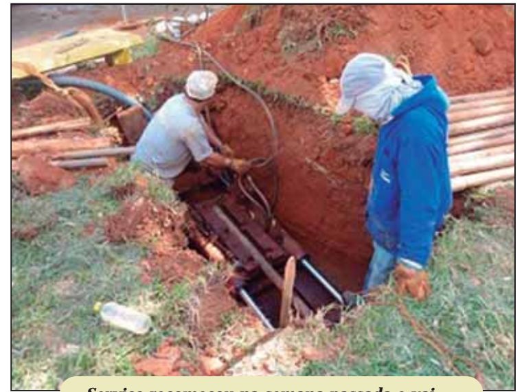
Serviço recomeçou na semana passada e vai atender principalmente ao Guará I

Além de melhorar a luminosidade nas ruas, a ampliação no sistema de iluminação pública no Guará, de acordo com a CEB, vai reduzir os apagões na cidade. O abastecimento de energia do Guará serão reforçado a partir do final do ano com a interligação da rede local com a estação de Riacho Fundo.