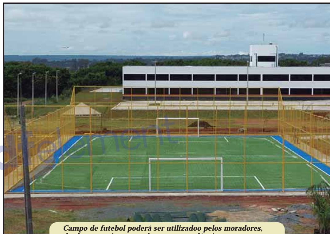
Campo de futebol poderá ser utilizado pelos moradores, desde que seja reservado com antecedência