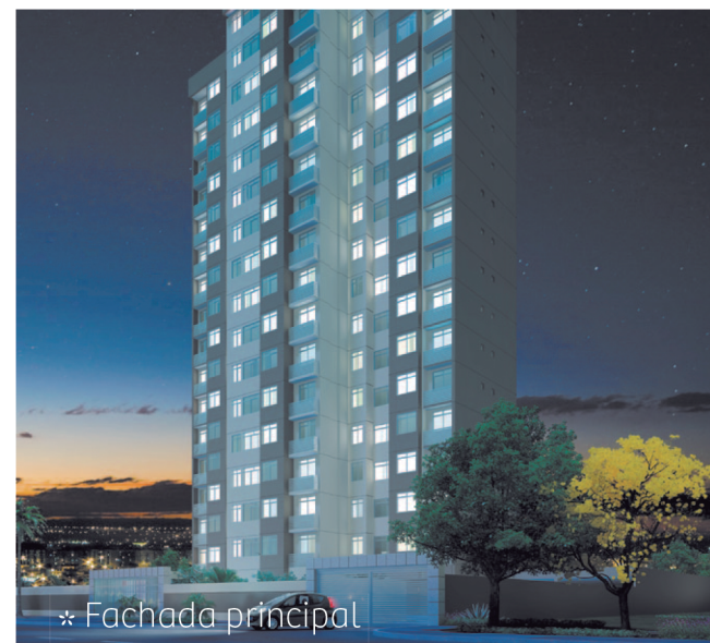
* Fachada principal