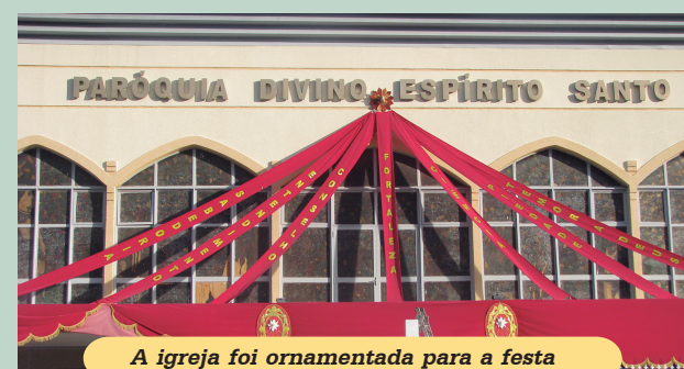
A igreja foi ornamentada para a festa