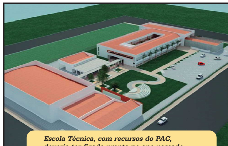
Escola Técnica, com recursos do PAC, deveria ter ficado pronta no ano passado

de três creches no Guará. As obras estavam previstas no Caderno das Cidades, mas sua confirmação animou os presentes. Das 112 em todo o DF, três serão na RA-X. Uma no Lúcio Costa, uma entre as OEs 26 e 28 e uma entre as OEs 17 e 19. O governador também anunciou os convênios com creches particulares e comunitárias a partir deste ano. A meta do GDF é atender a pelo menos 11 mil crianças.