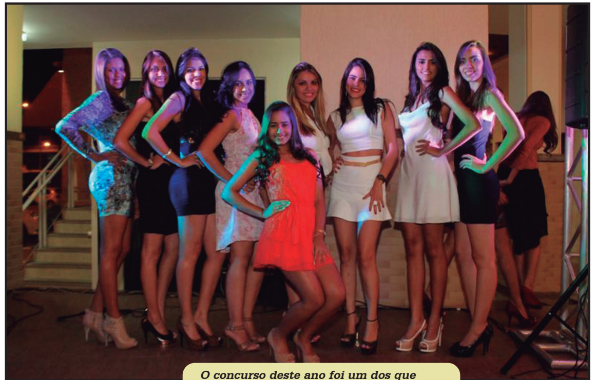
O concurso deste ano foi um dos que mais atraiu candidatas ao Miss Guará