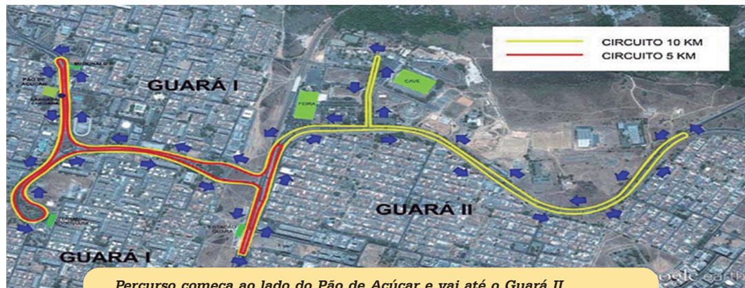
Percurso começa ao lado do Pão de Açúcar e vai até o Guarará II

dos nas categorias masculino e feminino geral, na prova de 10 km, receberão medalhas e prêmios de R$ 1.500,00 (1º lugar); R$ 800,00 (2º); e R$ 500,00 (3º colocado).