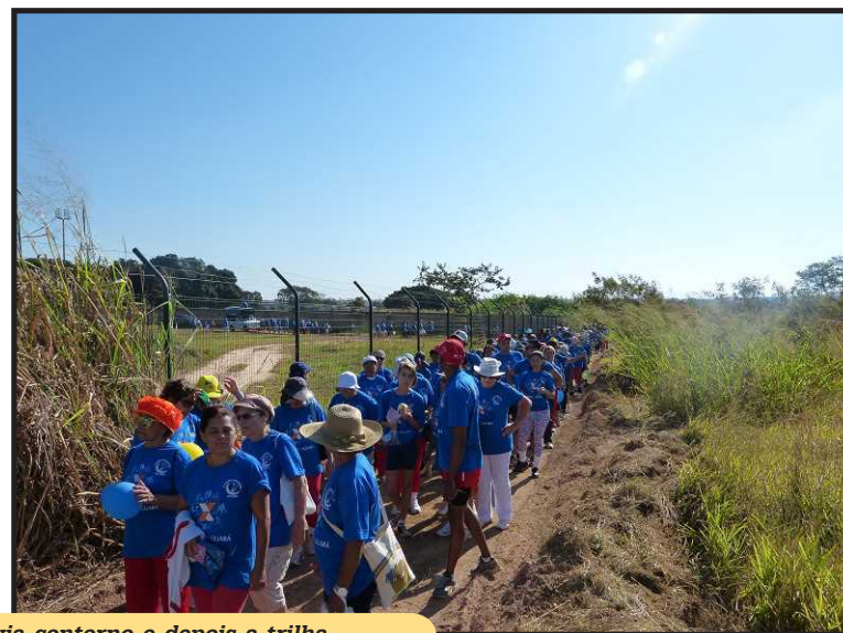
Os participantes percorrem a via contorno e depois a trilha