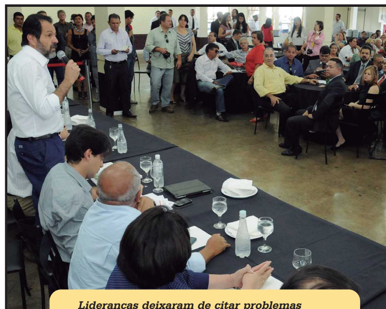
Lideranças deixaram de citar problemas cruciais da cidade ao governador

Além dos recursos para a construção, o governo federal repassará recursos para o mobiliário, equipamentos, desenvolvimento de gestão e formação de professores. Inicialmente a escola deve oferecer cursos nas áreas de saúde, turismo e tecnologia. O início da