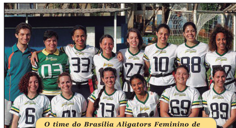
O time do Brasilia Alligators Feminino de Futebol Americano manda seus jogos no Guar4, no Estádio do Cave

Para mais informações acesse www.educamaisbrasil.com.br ou entre em contato com a central de atendimento através dos fone 0800.724 7202.