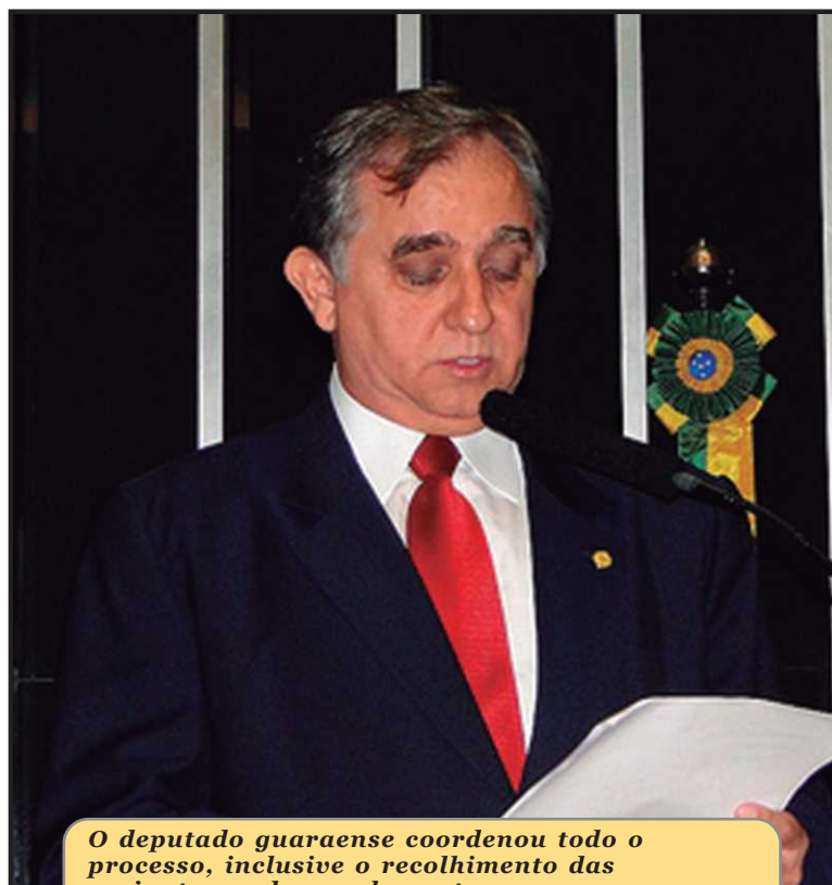
O deputado guaraense coordenou todo o processo, inclusive o recolhimento das assinaturas dos parlamentares

Izalci admite que até lá é possível que alguns parlamentares retirem suas assinaturas. Para que a CPMI seja instalada, são necessários o apoio de 171 deputados e 27 senadores. A partir do momento em que for lido o requerimento de instalação da CPMI, os parla-