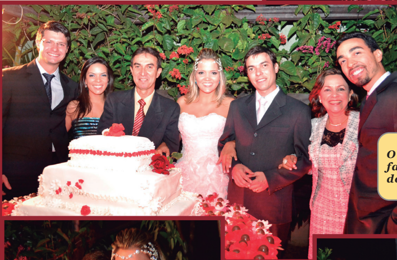
Os familiares do noivo