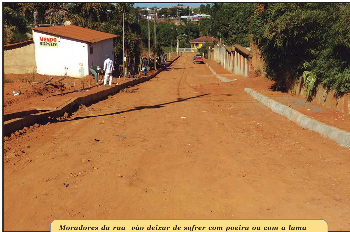
Moradores da rua vão deixar de sofrer com poeira ou com a lama