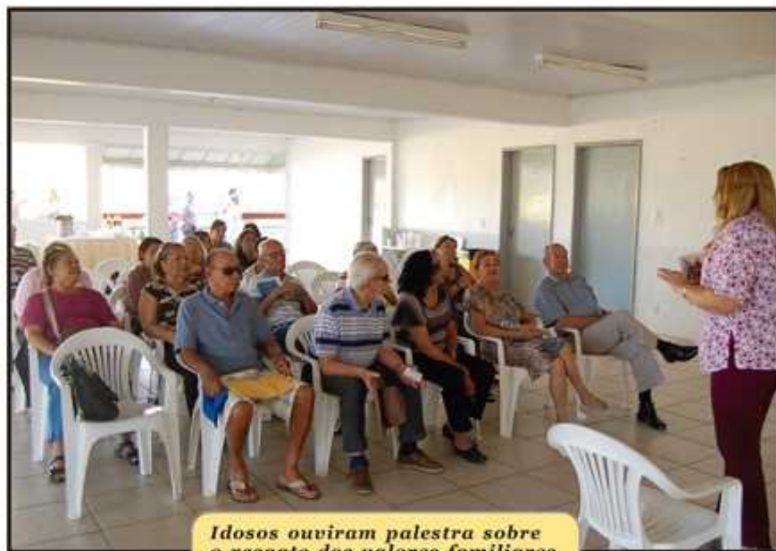
Idosos ouviram palestra sobre o resgate dos valores familiares

"As administrações não se dão conta da importância dos CCIs. Esse espaço deve ser destinado para a prática de atividades de lazer, esportivas, culturais e palestras. É aqui que o idoso pode se encontrar com os amigos, sair de casa, da fren-