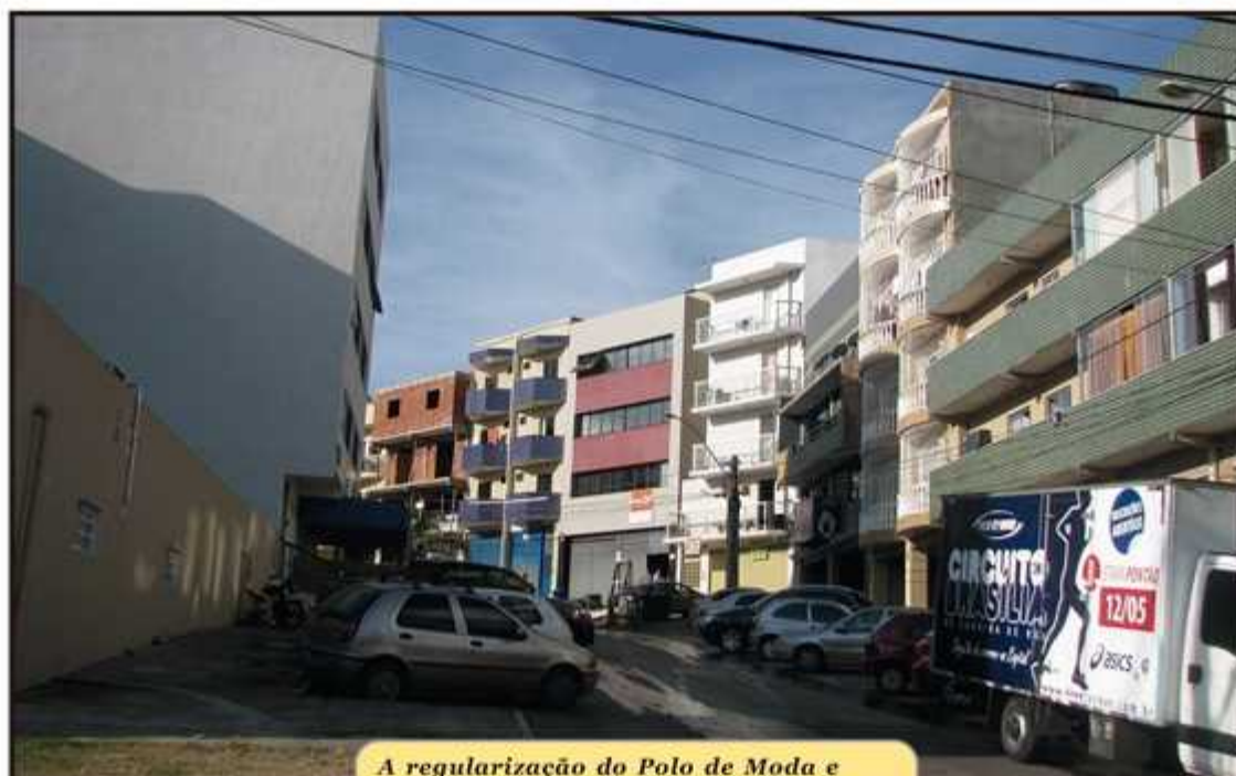
A regularização do Polo de Moda e limites para a verticalização da cidade serão temas certos dos debates

As novas quadras 48 a 58 do Guará, atualmente bloqueadas pela lacuna na legislação urbanística, podem ser liberadas para licitação e construção após a votação a LUOS. Mas, as associações e coope-