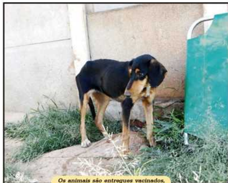
Os animais são entregues vacinados, vermifugados e cadastrados

Serão oferecidos cerca de 30 animais, entre cães e gatos, adultos e filhotes, tratados, vacinados e castrados. Todos os animais que estarão no local para adoção foram encontrados nas ruas ou são vítimas de maus tratos.