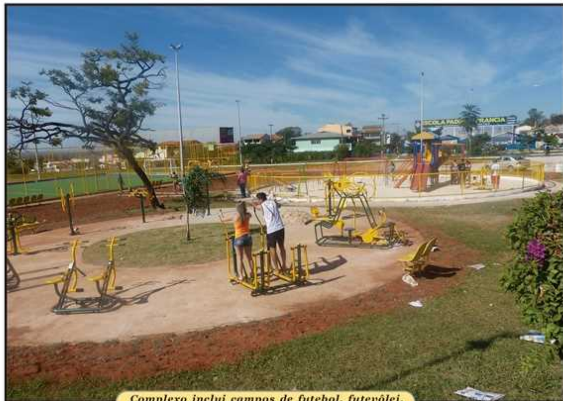
Complexo inclui campos de futebol, futvôlei, equipamentos de ginástico e parque infantil.

Com o novo centro, a comunidade do Guará passa a contar com três áreas de lazer integradas: o do Guará Park, instalado próximo à Colônia Agrícola Águas Claras; e o do 4º BPM. Está sendo construído um na QE 18, em frente ao conjunto R, e um outro na