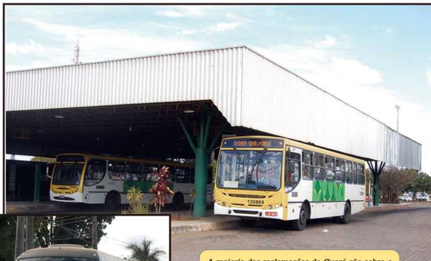
A maioria das reclamações do Guará são sobre o não cumprimento dos horários e dos itinerários. A postura dos motoristas e cobradores também rendem protestos dos usuários