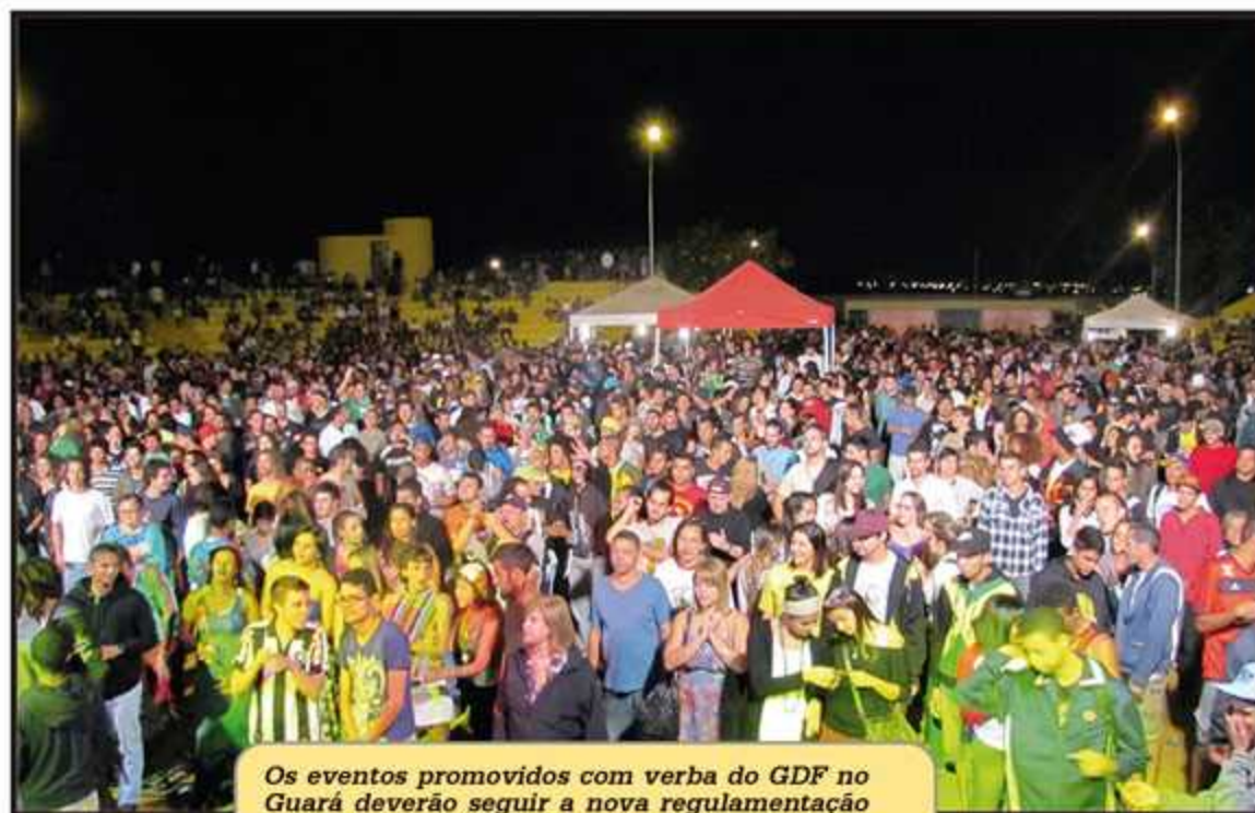
Os eventos promovidos com verba do GDF no Guará deverão seguir a nova regulamentação

Além disso, o decreto permitirá o rodízio dos talentos da cidade de forma a contemplar um maior número de artistas.