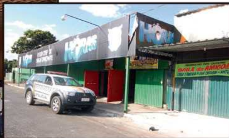
Enquanto mostram uma fachada modesta, o interior evidencia que os estabelecimentos não funcionavam como quiosques