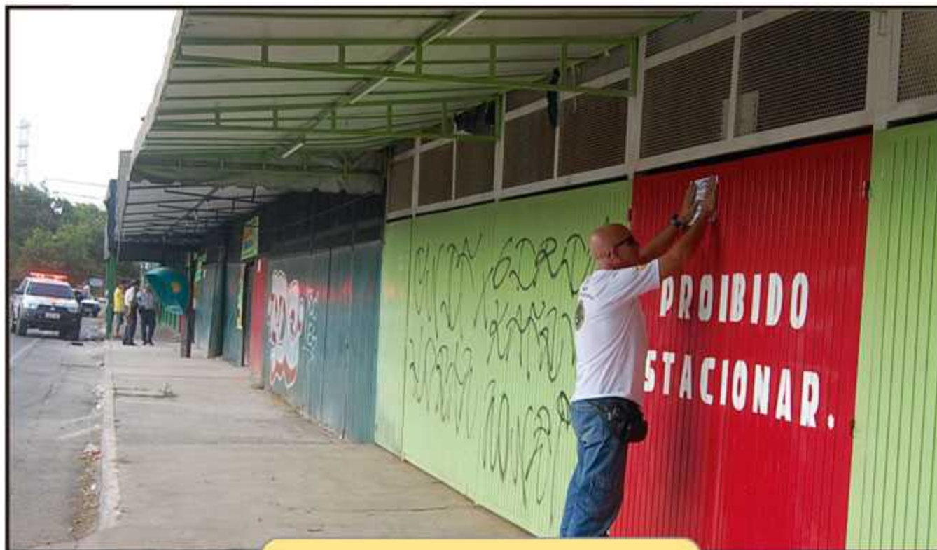
A operação lacrou cada uma das sete casas noturnas do Pontão do Cave

Próximo ao Parque do Guará e afastados das residências, foi nos primeiros anos de sua existência um dos locais mais agradáveis da cidade. Mas, a ausência do Estado permitiu que os concessionários dos quiosques os vendessem, mesmo sendo a venda ilegal. Alguns estão anunciados em sites de venda de imóveis por valores entre 120 e 300 mil reais. Dos 11 originais hoje somam apenas sete estabelecimentos.