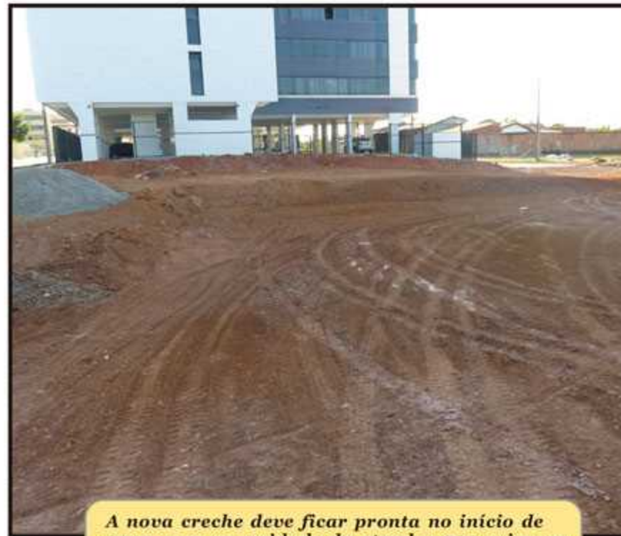
A nova creche deve ficar pronta no início de 2014, com capacidade de atender 300 crianças