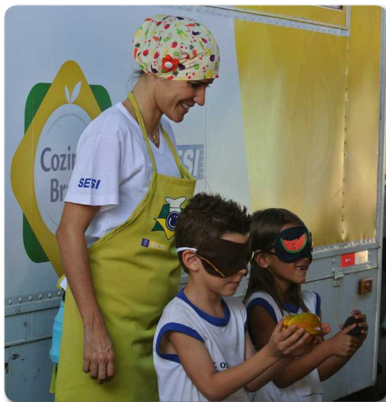
Alunos da Escola Classe 5 durante atividade do projeto Cozinha Brasil. No horário de aula, os alunos tem contato com técnicas de cozinha, visando uma alimentação saudável e o aproveitamento integral dos alimentos.