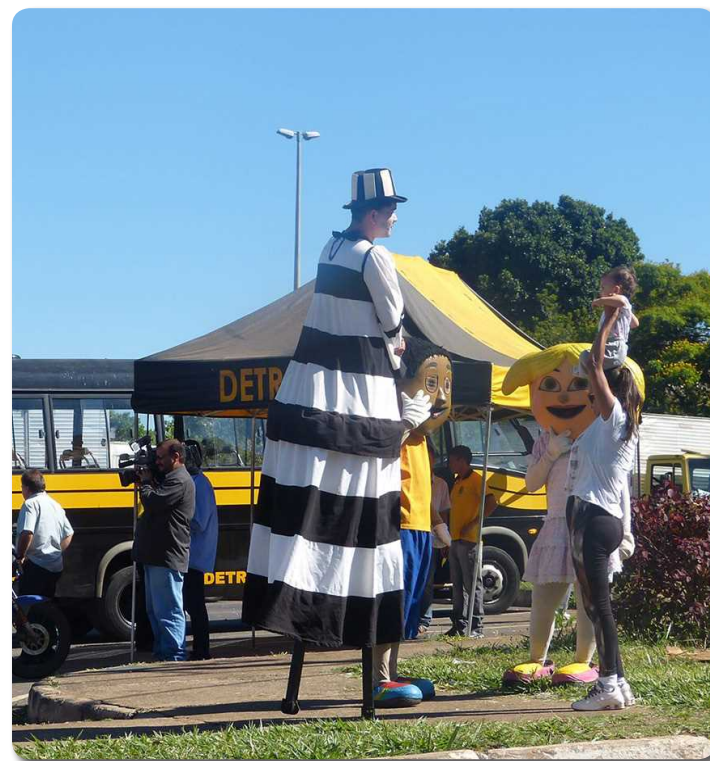
A blitz foi apenas educativa para conscientizar o motoboy da necessidade de regularizar seus documentos.

As empresas vencedoras serão responsáveis pela