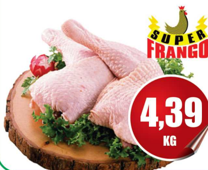
Coxa e Sobrecoxa Super Frango kg