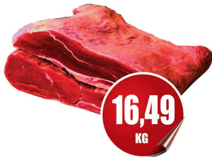
Carne de Sol kg