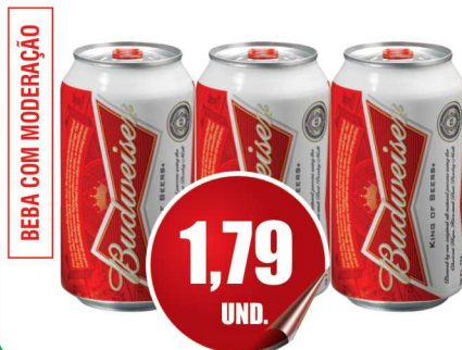
Cerveja Budweiser Lata 350ml