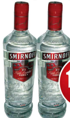
Vodka Smirnoff 998ml