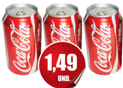
Refrigerante Coca-Cola Lata 350ml