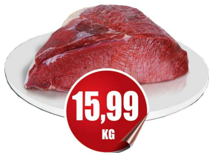
Coxão Mole kg

Ofertas Válidas de 18/01 Sábado a 20/01 Segunda