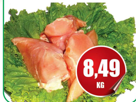
Filé Super Frango kg