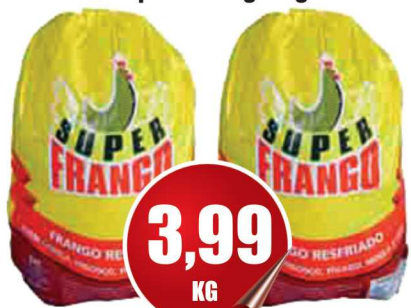
Frango Resfriado Super Frango kg