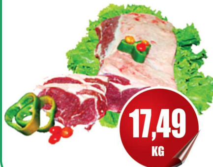
Contra Filé kg