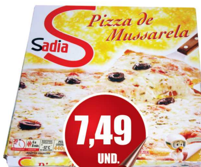
Pizza Sadia 460g Sabores