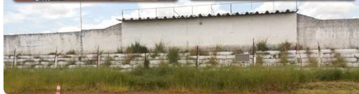
As instalações e o gramado do Cave estão impraticáveis

A seis meses do início da Copa do Mundo em Brasília, a prometida reforma do estádio do Cave no Guarará continua parada. De acordo com o Governo do Distrito Federal (GDF) o estádio será um dos dois centros de treinamento das seleções que vão jogar na cidade no período da Copa.