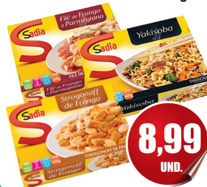
Prato Pronto Sadia 600g