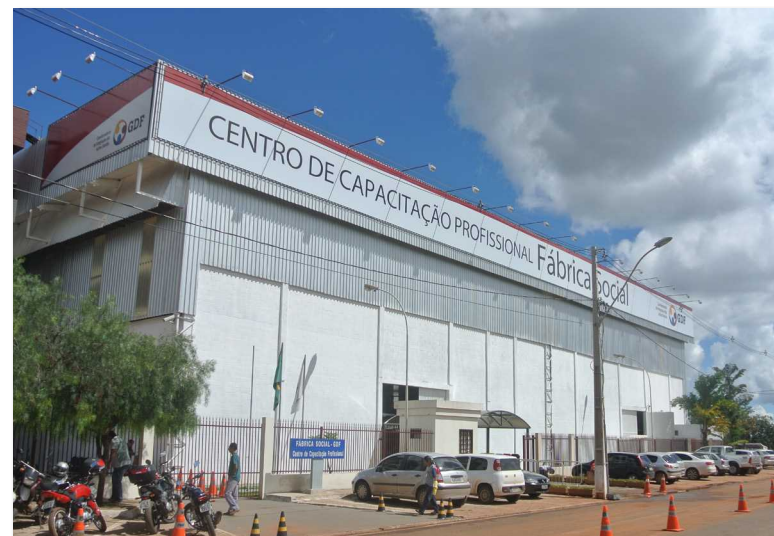
A Fábrica Social, instalada ao lado da cidade Estrutural, gera renda e capacitação para mais de 1200 famílias.