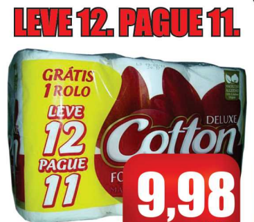
Papel Higiênico Cotton

Qualidade e variedade diariamente pra você!