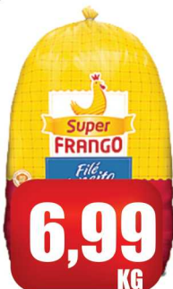
Filé Peito Super Frango