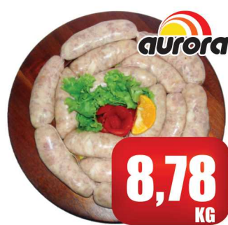
Linguíça Grossa de Frango Aurora