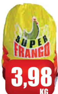
Frango Resfriado Super Frango