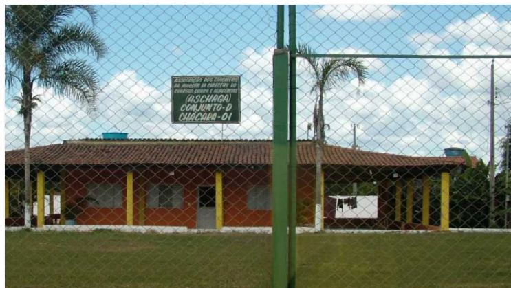
Algumas das chácaras estão no local há pelo menos 30 anos. A maioria dos ocupantes já foi indenizada e voltou a invadir a área.

O Ibram determinou que a retirada dos chacareiros seja feita de forma a causar o menor impacto ambiental possível, sob pena de multa por dano ambiental. Portanto, os chacareiros não poderão demolir as construções existentes, que serão doadas ao GDF, que, depois de análise das construções, poderá utilizá-las para outros fins, como sedes de entidades civis e públicas ligadas à causa do meio ambiente, escolas ou