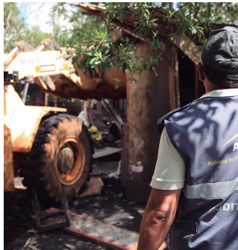
Servidor da Agência de Fiscalização do DF coordena as operações de retirada de invasões em área de proteção ambiental

Entre as construções irregulares retiradas estão um galpão do Condomínio Terra Santa, onde