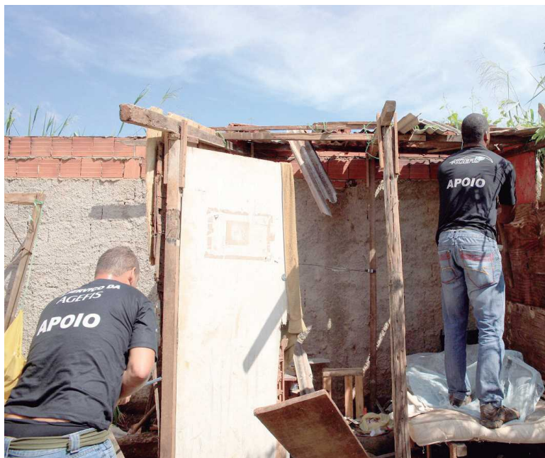
Invasões próximas ao Lúcio Costa, dentro da Reserva Biológica do Guarά foram retiradas assim que a Agefis as identificou

também 10 metros de muro foram retirados. Na Rua São Francisco foram removidos 150 metros de calçada e outros 100 de cerca. A ação foi encerrada no residencial Mansões Paraíso, onde uma edificação e 10 metros de muro acabaram retirados.