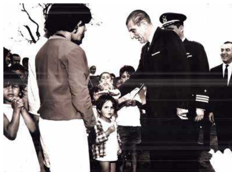
Presidente do Chile Eduardo Frei vem ao Brasil apenas para visitar o mutirão do Guará.

Em 1987, a cidade aumentava sua população com a inauguração da Quadra Lúcia Costa. Em 1990, mas de 400 famílias foram assentadas nas OEs 42 e 44. Em 1987, no finalzinho do Governo Roriz foi criada a OE 46, onde foram assentados apadrinhados do governo e não inquilinos de baixa renda como era o previsto.