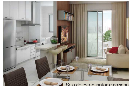
Sala de estar, jantar e cozinha