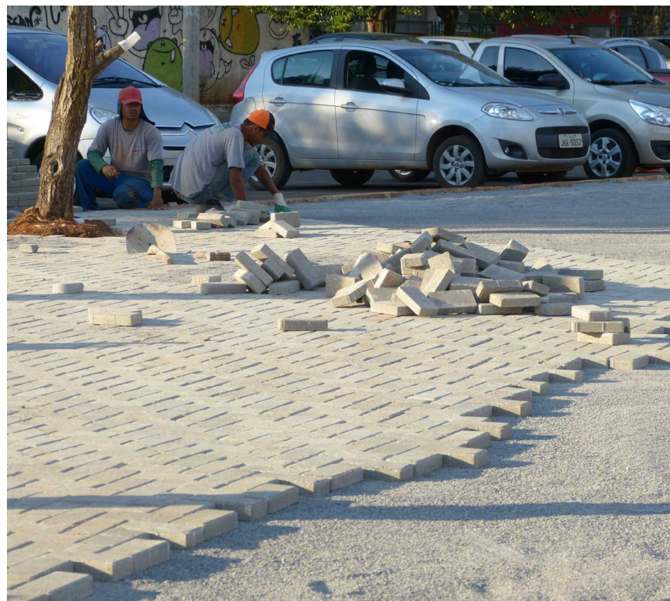
Uma das obras licitadas é a revitalização de uma praça na QE7, um dos principais centros comerciais da cidade. Rebatizado de Espaço Tai Chi Chuan, o local receberá novo gramado, a troca da pavimentação e mobiliário urbano, como bancos e pergolados.

zar uma tomada de preços ou concorrência pública, mesmo se a obra custar menos de R$ 150 mil, ou pode licitar obras com valores bem inferiores. Não há obrigação de se fazer um orçamento tão próximo ao valor limite para o convite de empresas.